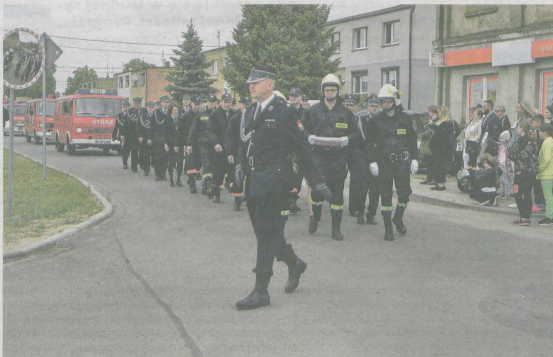
Jednostka OSP Hilarów została odznaczona złotym medalem