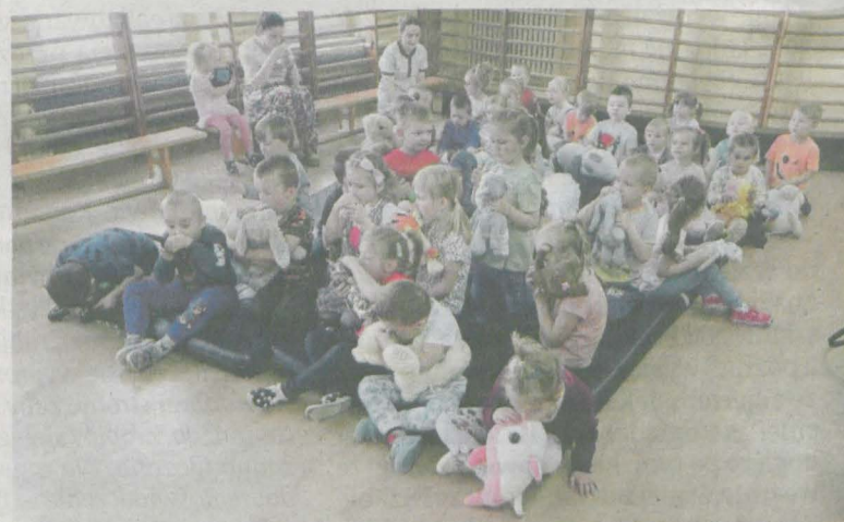
Zajęcia były dostosowane do wieku dzieci

Młodszy uczniowie po omówieniu zagadnień związanych z wzywaniem pomocy, naśladowali prowadzącego zajęcia, ratując własne pluszaki. Na szczęście wszystkie maskotki zostały uratowane i dzieci opuściły zajęcia zadowolone i uśmiechnięte.