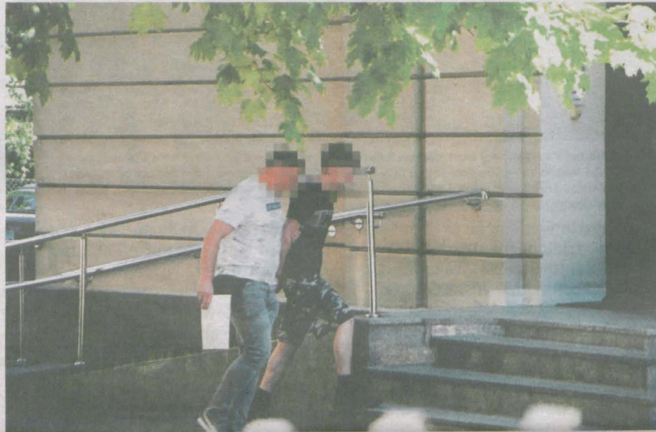
W środę podejrzany 19-latek został doprowadzony do Sądu Rejonowego w Jarocinie

19-LETNI KIEROWCA BMW POTRĄCIŁ ŚMIERTELNIE NA PRZEJŚCIU dla pieszych 20-latkę przechodzącą z rowerem. Prokuratura złożyła wniosek o tymczasowe aresztowanie młodego mężczyzny.