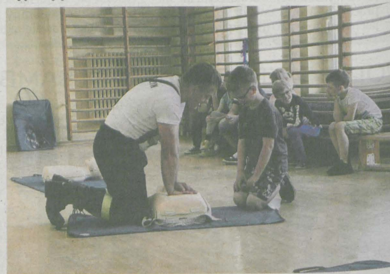
(BB) Uczniowie ćwiczyli na fantomach