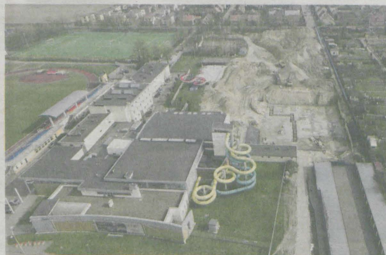
Basen odkryty w Jarocinie został zlikwidowany blisko 4 lata temu

drugiego etapu oceny i czekamy na decyzję. Spółka może dostać około 30% kosztów zadania, które są na poziomie 8 mln zł, czyli ponad 2 mln zł.