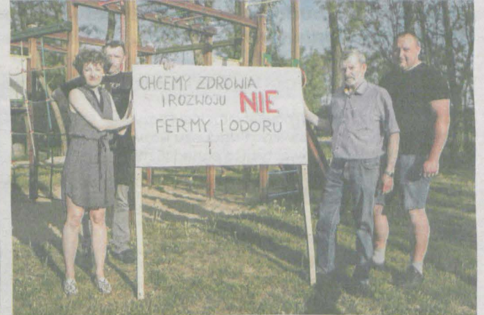
W miejscowości stanęły banery sprzeciwu wobec inwestycji

Społeczeństwo Niedźwiad, podobnie jak niedawno Siedlemina czy Kadziaka, protestuje przeciwko budowie siedmiu kurników. Ogromna inwestycja ma powstać w centrum wsi. Ludzie obawiają się, że ferma chowu drobiu wraz z infrastrukturą będzie dla nich bardzo uciążliwa. Burmistrz Jaraczewa wszczął postępowanie administracyjne w sprawie wydania decyzji o środowiskowych uwarunkowaniach dla przedsięwzięcia. Postępowanie jest w toku. Jaraczewscy urzędnicy czekają na stanowiska różnych instytucji. Póki co inwestycję pozytywnie zaopiniował jarociński sanepid.