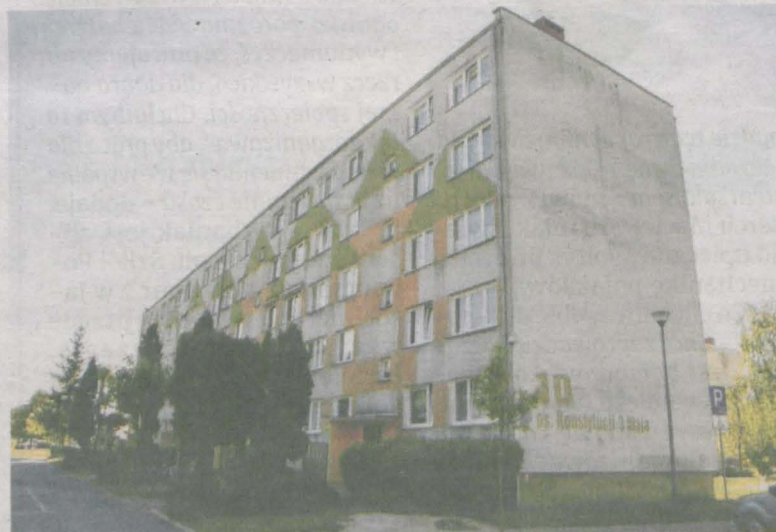
Mieszkańcy bloku odetchnęli z ulgą po tym, jak ustały hałasy