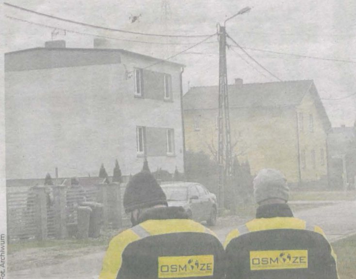
W minionym sezonie grzewczym przy pomocy drona wykonanych zostało 547 kontroli tego, co wylatuje z kominów domów mieszkańców gminy Jarocin

Opinie na temat działań antysmogowych nadal są podzielone. Są tacy, którzy czekali na ich podjęcie. - To, co dzieje się w Jarocinie, kiedy zaczną palić