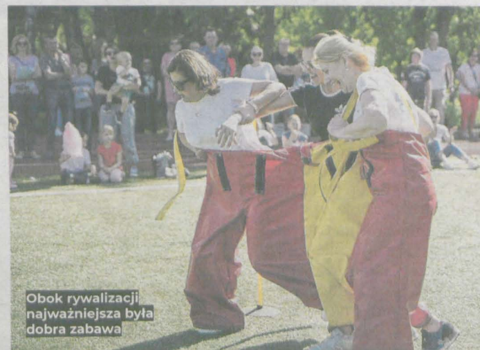
Obok rywalizacji najważniejsza była dobra zabawa