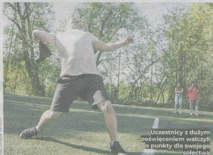
Uczestnicy z dużym poświęceniem walczyli o punkty dla swojego sołectwa

W pierwszym Turnieju Sołectw rywalizowały ze sobą Wilkowyja i Annapol. – To było fantastyczne niedzielne