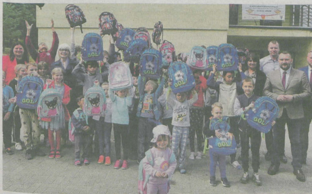
Plecaki z wyposażeniem sprawiły ukraińskim dzieciom wiele radości