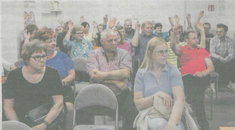
Mieszkańcy Niedźwiad nie chcą siedmiu kurników w wiosce

MIESZKAŃCY NIEDŹWIAD WNIOSKUJĄ DO BURMISTRZA JARACZEWA ORAZ RADNYCH, aby sporządzić miejscowy plan zagospodarowania przestrzennego dla wioski, gdzie planowana jest budowa siedmiu kurników na 303.000 sztuk brojlerów w jednym cyklu produkcyjnym. Dokument miałby być narzędziem do zablokowania niechcianej przez mieszkańców inwestycji.