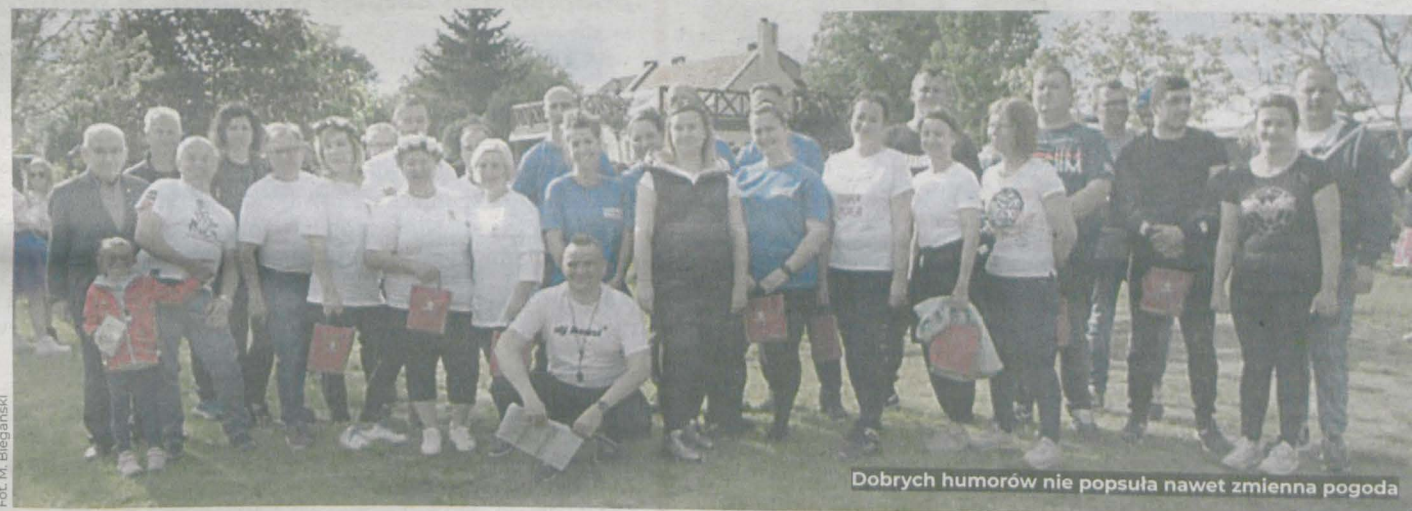
Dobrych humorów nie popsula nawet zmienna pogoda

popołudnie. Zacięta, ale zdrowa rywalizacja między zaprzyjaźnionymi sołectwami trwała kilka godzin – relacjonują organizatorzy. Wiele emocji i śmiechu wzbudziły takie konkurencje jak bieg drużynowy w ogromnych spodniach, bieg na czas trzyosobowej ekipy na jednej parze nart, rzut jak najdalej kaloszem czy przenie-