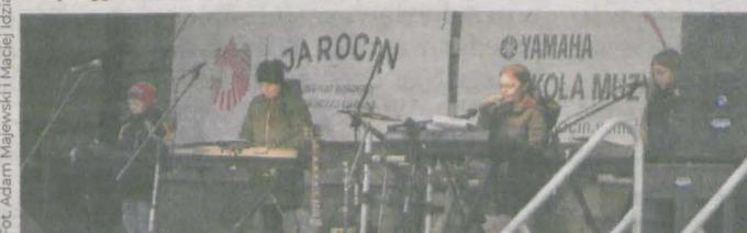
Na zaimprovizowanej scenie wystąpili uczniowie ze Szkoły Muzycznej Yamaha