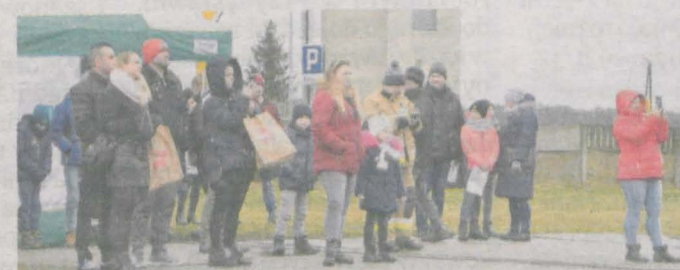
Nieprzyjazna aura sprawiła, że frekwencja była mniejsza