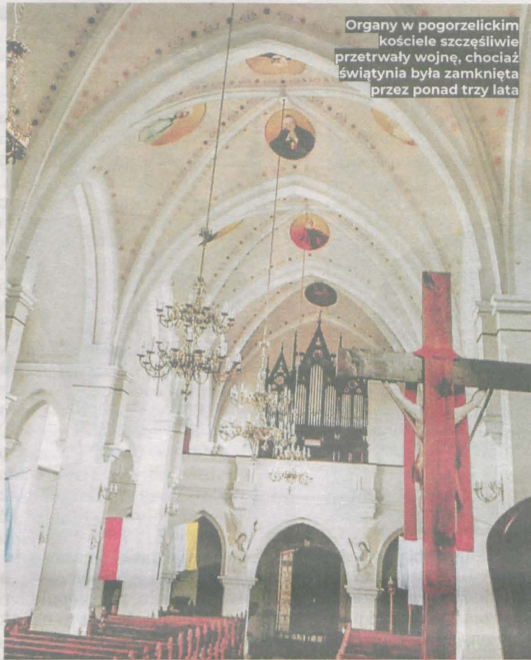
Organy w pogorzelińskim kościele szczęśliwie przetrwały wojnę, chociaż świątynia była zamknięta przez ponad trzy lata