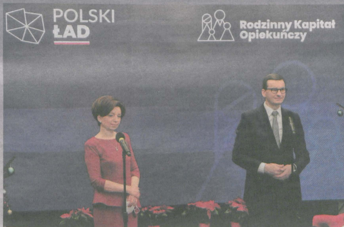
Marlena Maląg Minister Rodziny i Polityki Społecznej, Posel na Sejm RP wraz z Prezesem Rady Ministrów - Mateuszem Morawieckim

” Dla nas, Polaków, rodzina jest jedną z najważniejszych wartości, a szczęście utożsamiamy ze szczęściem rodzinnym. Młode pokolenie deklaruje, że chce mieć dzieci. Najlepszym środowiskiem do przychodzenia na świat i dorastania dzieci jest właśnie rodzina. Dlatego wychodząc naprzeciw oczekiwaniom Polaków realizujemy konsekwentnie kompleksową i spójną politykę prorodzinną, w ramach której kolejnym wsparciem dla rodzin - obok programów Rodzina 500+ czy Dobry Start - jest Rodzinny Kapitał Opiekuńczy.