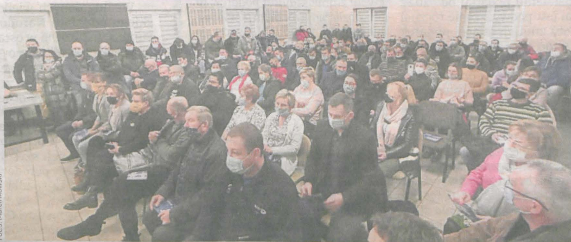
Zebranie w Siedleminie cieszyło się dużym zainteresowaniem wśród mieszkańców. Sala wiejska była wypełniona niemal po brzegi