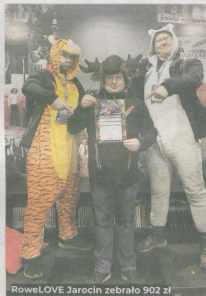
RoweLOVE Jarocin zebrało 902 zł