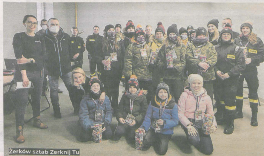
Żerków sztab Zerknij Tu