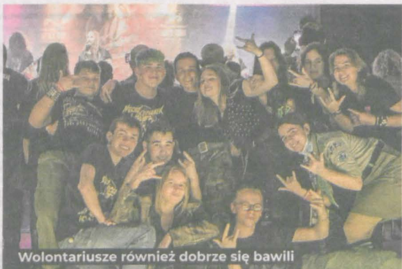
Wolontariusze również dobrze się bawili