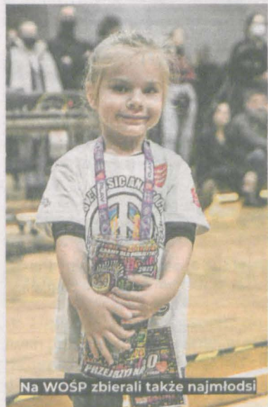
Na WOSP zbierali także najmłodsi