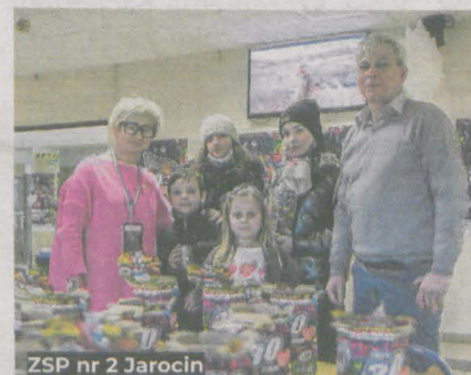
ZSP nr 2 Jarocin