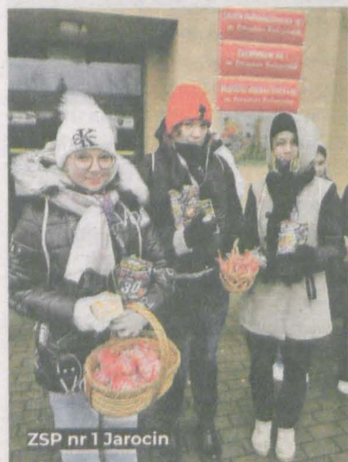
ZSP nr 1 Jarocin