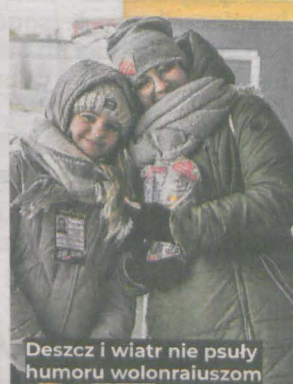
Deszcz i wiatr nie psuły humoru wolonraiuszom