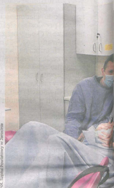
Warunki w Szpitalu Powiatowym w Jarocinie

Fundusz podał, że więcej porodów w 2021 r., w porównaniu z poprzednim rokiem wykazało