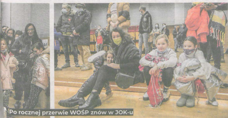
Po rocznej przerwie WOŚP znów w JOK-u