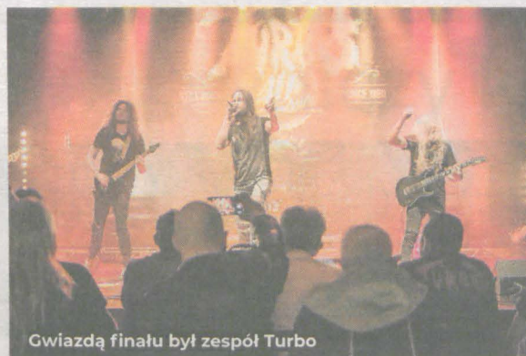
Gwiazdą finału był zespół Turbo