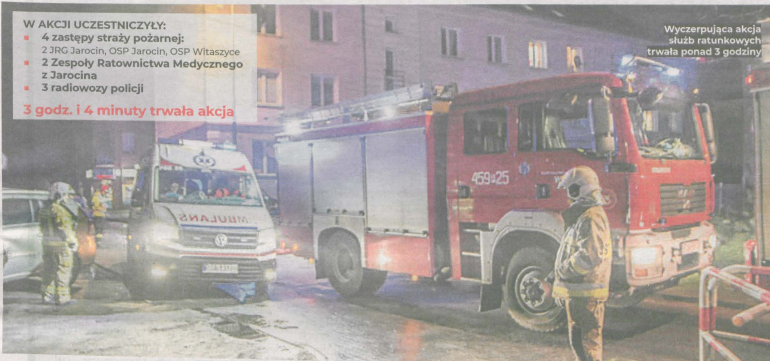
Wyczerpująca akcja służb ratunkowych trwała ponad 3 godziny

mł. kpt. MARIUSZ BANASZAK oficer prasowy PSP w Jarocinie