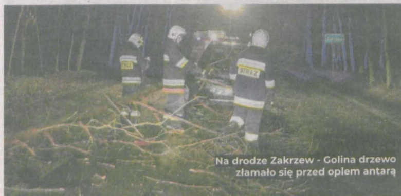
Na drodze Zakrzew - Golina drzewo złamało się przed oplem antarą