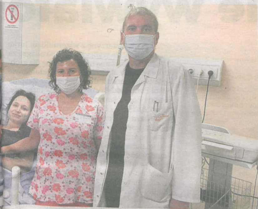
umożliwiają - mimo pandemii - przeprowadzanie porodów rodzinnych

CORAZ WIĘCEJ DZIECI. Z DANYCH NARODOWEGO ończył się wzrostem o 34 urodzenia w stosunku do za powiatu jarocińskiego, które decydują się na po-