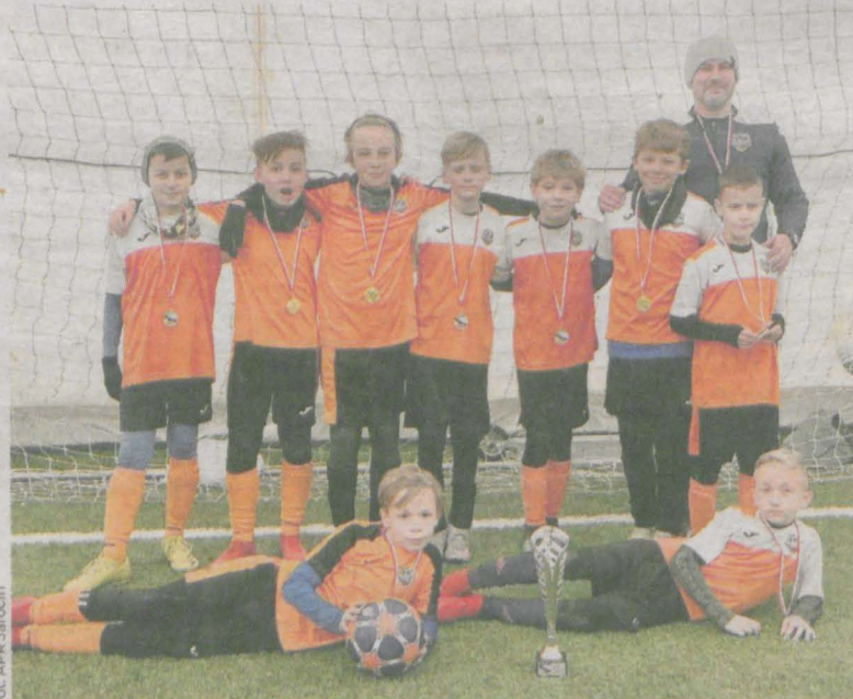
Jedna z drużyn Akademii Piłkarskiej Reissa Jarocin, które wywalczyły awans do finału krajowego turnieju Bielik Cup

Jarocińska APR wystartowała w trzech rocznikach i we wszystkich awansowała do finałów. Zespoły z roczników 2011, 2012 oraz 2013 na przestrzeni kilku tygodni mierzyły się, pod balonem w poznańskiej APR Arena Dębicz, z zespołami