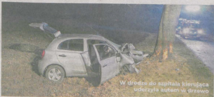
W drodze do szpitala kierująca uderzyła autem w drzewo

W ŚRODKU NOCY WYPADŁ Z OKNA. TELEFONICZNIE PROSIŁ O POMOC ZNAJOMĄ, która wsiadła w nissaną micrę i wiozła mężczyznę do szpitala. Na drodze Chrzan - Żerków auto uderzyło w drzewo.