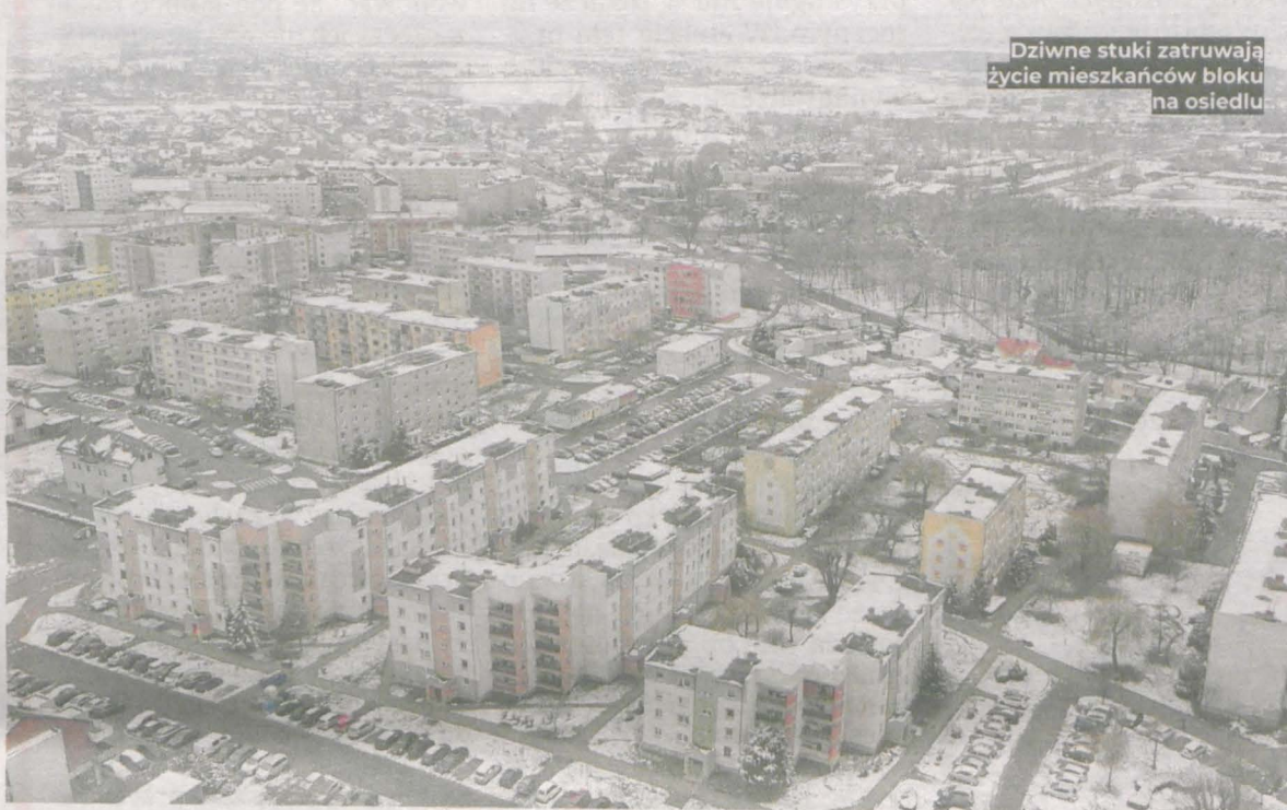
Dziwne stuki zatruwają życie mieszkańców bloku na osiedlu

Dziwne dźwięki wyrzuciły do góry nogami życie wszystkich, którzy mieszkają w 2. lub 3. klatce bloku na osiedlu Konstytucji 3 Maja. – To jest taki metaliczny odgłos. Czasami jest taka jakby piłkarska przyspiewka. Mylę, że ktoś specjalnie chce nam dokuczyć. Nie da się spać. Jestem potwornie zmęczony. Czasami zaspałem do szkoły. Nie da się tak funkcjonować. Nic z lekcji się nie wynosi – mówi 15-latek. Ludzie są już tak zdesperowani, że w środku nocy są nawet gotowi jechać spać do rodziny w innej miejscowości. – Ja mam niechodzącą i dializowaną babcię oraz dwojkę dzieci. Babcia budzi się w nocy, a o 4.40 ma wyjazd na dializy. Dzieci budzą się w środku nocy i płaczą – opowiada inna mieszkanka. – Miałam taką sytuację, że byłam w domu tylko z dziećmi,