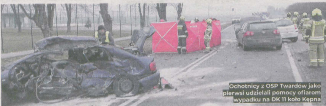
Ochotnicy z OSP Twardów jako pierwsi udzielali pomocy ofiarom wypadku na DK 11 koło Kępna