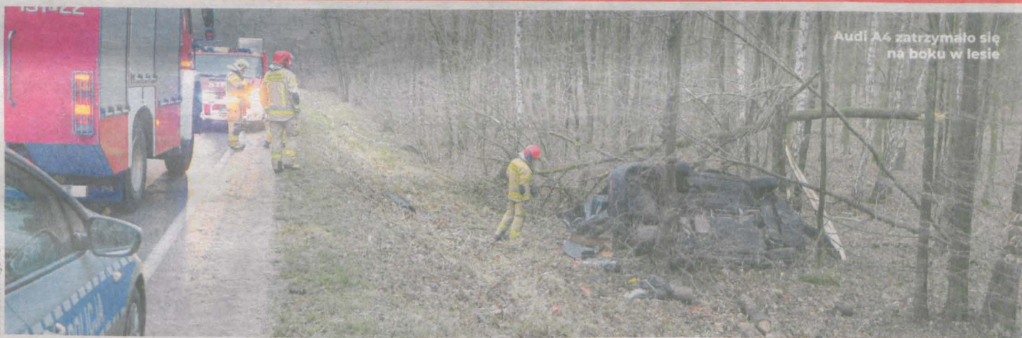
Audi A4 zatrzymało się na boku w lesie

- TO CUD, ŻE ŻYJE - TAK MÓWILI ŚWIADKOWIE ZDARZENIA NA ULICY POZNAŃSKIEJ W JAROCINIE. Kierowca audi A4 wypadł z drogi i kompletnie roztrzaskał samochód na drzewach.