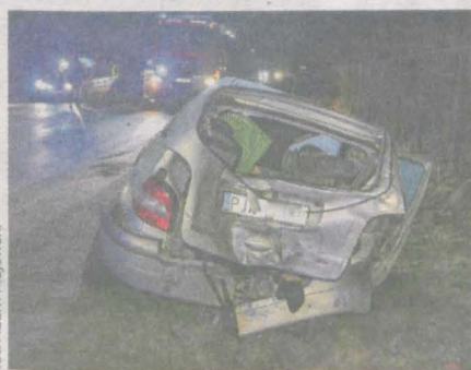
W tył renaulta wjechał pijany kierowca busa