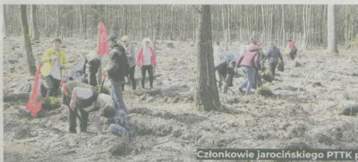
Członkowie jarocińskiego PTTK podczas sadzenia lasu