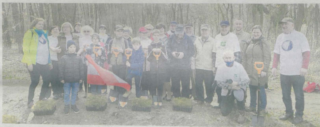
Po pracy wykonano wspólne zdjęcie