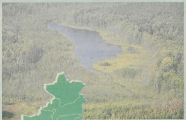
Fot. Nadleśnictwo Sarbia

Zaczerpnięto: www.sarbia.pila.lasy.gov.pl , „Leśne rezerваты przyrody województwa wielkopolskiego” Poznań 2016