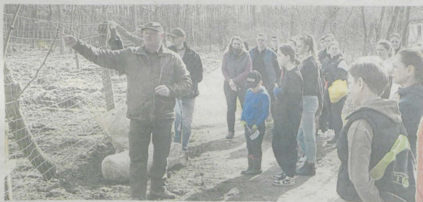
Uczniowie SP w Pięczkowie na leśnym spacerze