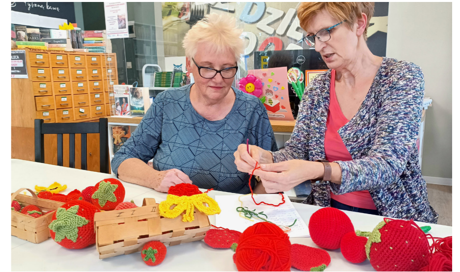
fol. BiKiMiG Buk

Warsztaty skierowane są zarówno do dzieci, jak i dorosłych znających już podstawy szydełkowania. To idealna okazja, by wspólnie – bez względu na wiek – nauczyć się czegoś nowego, porozmawiać, wymienić doświadczeniami