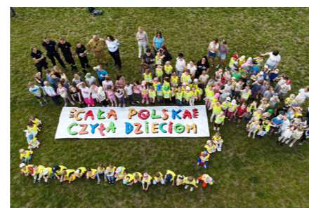
fol. BPMiG Września

Biblioteka Publiczna Miasta i Gminy we Wrześni