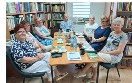
fol. GBP Sieroszewice

Pod koniec czerwca w ramach Dyskusyjnego Klubu Książki Poczytajmy – pogadajmy, działającego przy Gminnej Bibliotece Publicznej w Sieroszewicach, omawiano powieść Karoliny