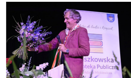
fol. RBP Raszków

Raszkowska Biblioteka Publiczna im. Adama Mickiewicza w Raszkowie