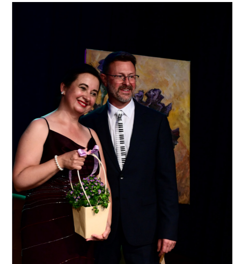
Biblioteka Publiczna i Centrum Kultury Gminy Łubowo

„Klasyka w sercu Łubowa” udowodniła, że wielka sztuka może być blisko. I że w niewielkiej miejscowości można doświadczyć koncertu z duszą.