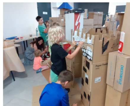
fol. K. Bukowska

Były to pierwsze wakacyjne spotkania zorganizowane w filii bibliotecznej w Biskupicach, otwartej w październiku 2024 roku. Placówka wykorzystuje zarówno walory przyrodnicze regionu, jak i potencjał Biblioteki Publicznej Miasta i Gminy Pobiedziska. Zainteresowanie nową biblioteką rośnie – mamy ponad 1000