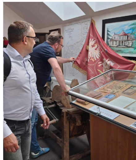
fol. GBP Ceków-Kolonia

Gminna Biblioteka Publiczna im. Stefana Floriana Garczyńskiego w Cekowie-Kolonii