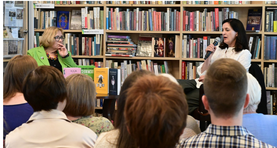
fol. D. Zawadzka

Szczególnym momentem wieczoru była rozmowa o Kazimierze Iłakowiczównie – bohaterce debiutanckiej książki Joanny Kuciel-Frydryszak, zatytułowanej Iłła . Wzruszające wspomnienia