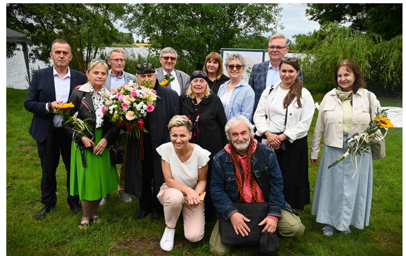
fol. BPiCK Łubowo