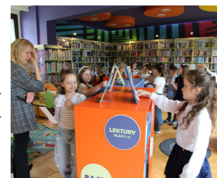
fol. MiPBP Nowy Tomyśl