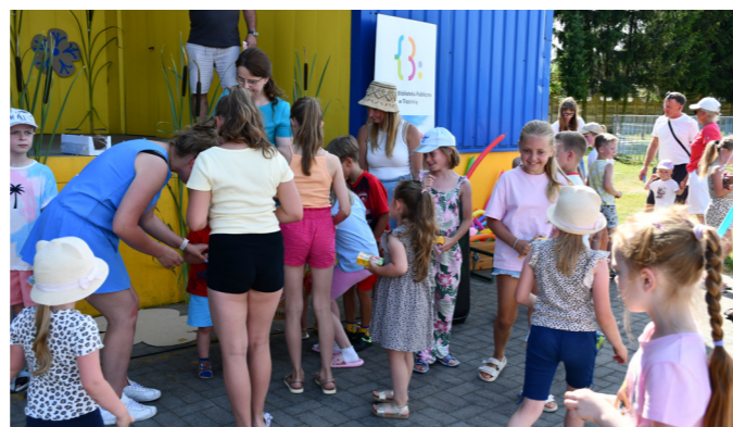
fol. GBP Trzcinica