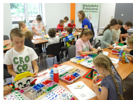
fol. BPG Grodziec