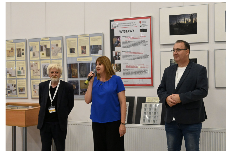
Biblioteka Publiczna i Centrum Kultury Gminy Łubowo

W ramach Festiwalu „Pogranicza Literatury” odbyło się wieczorne zwiedzanie zabytkowego, drewnianego kościoła pw. św. Mikołaja w Łubowie.