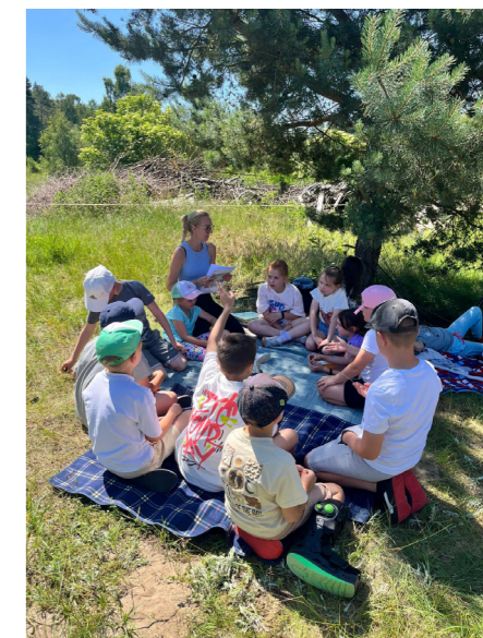
fol. GBP Zdziechowa

Gminna Biblioteka Publiczna w Zdziechowie, Filia w Jankowie Dolnym