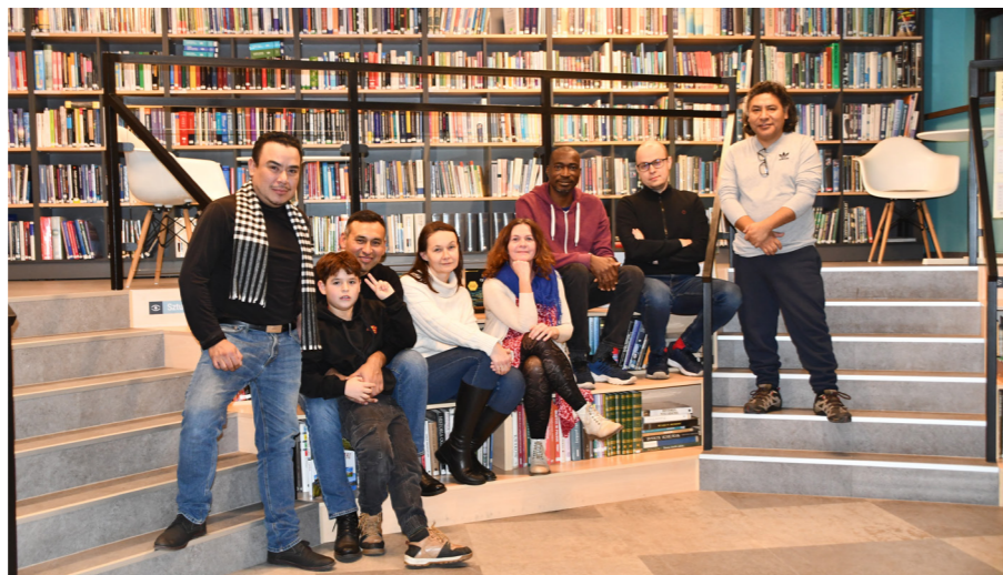
fol. MIPBP Nowy Tomysz

Choć podstawowym celem kawiarenki jest doskonalenie kompetencji językowych, zarówno w języku polskim, jak i hiszańskim, to spotkania te niosą ze sobą znacznie więcej. To przestrzeń wymiany kulturowej, w której rozmowy