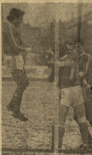
Radość lechitów po zdobyciu wyrównującego gola.