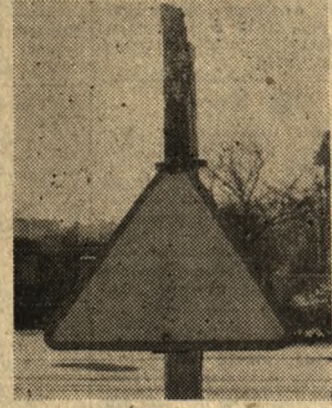
Nie tylko kapryśna pogoda, ale także uszkodzone lub nieczytelne znaki drogowe utrudniają poruszanie się zmotoryzowanym. Na zdjęciu przykład z ul. Olszynka.

na krótkie, lokalne trasy — jak choćby do Wągrowca — bo o pociągach dalekobieżnych lepiej nie wspominać. Te, które zjawiały się w Poznaniu z po-