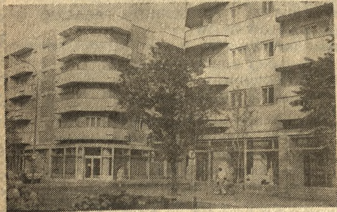
Mnogość balkonów, staranne elewacje, handlowe partery — oto cechy domów mieszkalnych w Rumunii.