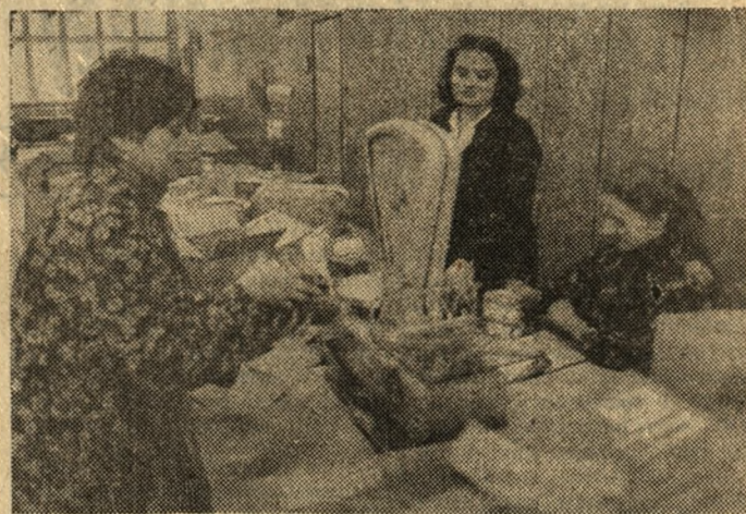
Wydział pocztowo-celny w Poznaniu pracuje na najwyższych obrotach. Codziennie przyjmuje wysyłkę do adresatów kilka tysięcy paczek żywnościowych nadchodzących z zagranicy. Na zdjęciu: pracownice podczas odprawy celnej przesyłek.