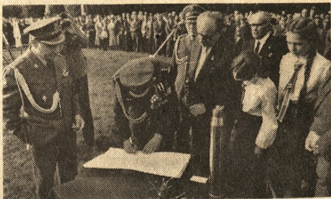
Na zdjęciu: wmurowanie aktu erekcyjnego pomnika Armii „Poznań”.