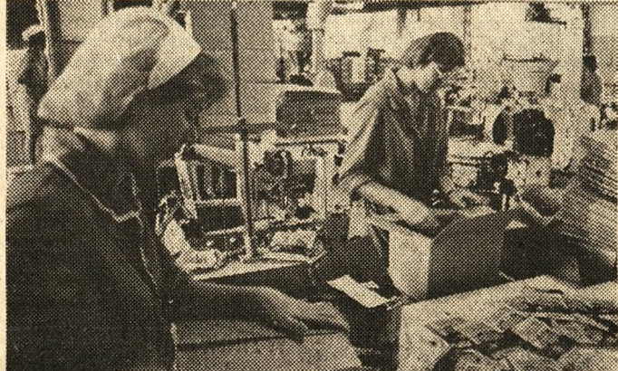
Pakowanie zup w poznańskim „Amimo”.

Mięsa, cukru, masła i jeszcze co najmniej kilku innych artykułów żywnościowych jest w Polsce za mało i dlatego mamy karkki. Gdyby zatem próbować w żywieniu rozszerzać dietę o te produkty, których sprzedaż nie podlega jeszcze racjonowaniu, to możliwości urozmaicenia menu są raczej niewielkie. No bo co pozostaje w „niekartkowej” sprzedaży? Ryby, herbaty, ocet, warzywa i owoce, po części sery — o ile się wystoi w długiej kolejce. Nawet chleb można w Poznaniu nabywać w sposób ograniczony do 4 bochenków jednorazowo. Bez kartek można też ku pować teoretycznie szeroka gamę koncentratów spożywczych. Wybór jest jednak o-