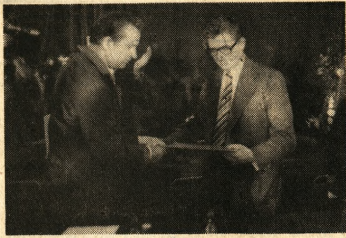
W ZNTK naprawiają także sprzęt rolniczy