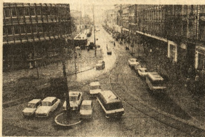
Na zdjęciu: przed „okrągłakiem” parkowanie też często budzi zastrzeżenia.