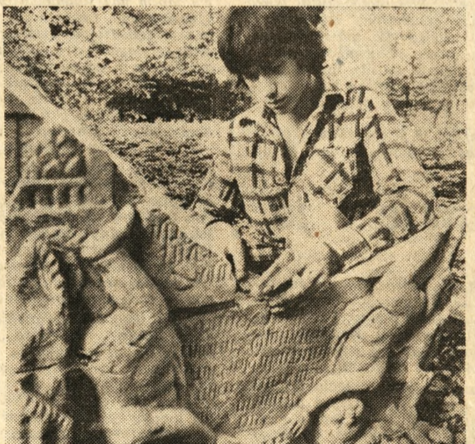
We Wschowie (Leszczyńskie) powstaje lapidarium, czyli zbiór budowli i rzeźby cmentarnej. Na zdjęciu: sklepanie zniszczonych nagrobków pochodzących z cmentarza w Święciechowej.