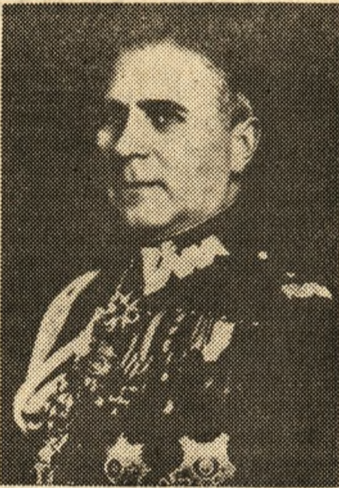
Gen. dywizji — Tadeusz Kutrzeba.

Jako komendant Wyższej Szkoły Wojennej nie ograniczył swojej funkcji do organizowania tylko procesu dydaktycznego i gier wojennych. Ale również wiele czasu poświęcał publicystyce wojskowej. W szeregu teoretycznych prac pisanych po 1936 r. dał właściwą ocenę politycznej i wojskowej sytuacji w Europie. Pisał wówczas, że na wypadek wojny z Niemcami, „sojusz wojskowy z Francją może mieć podstawowe znaczenie do