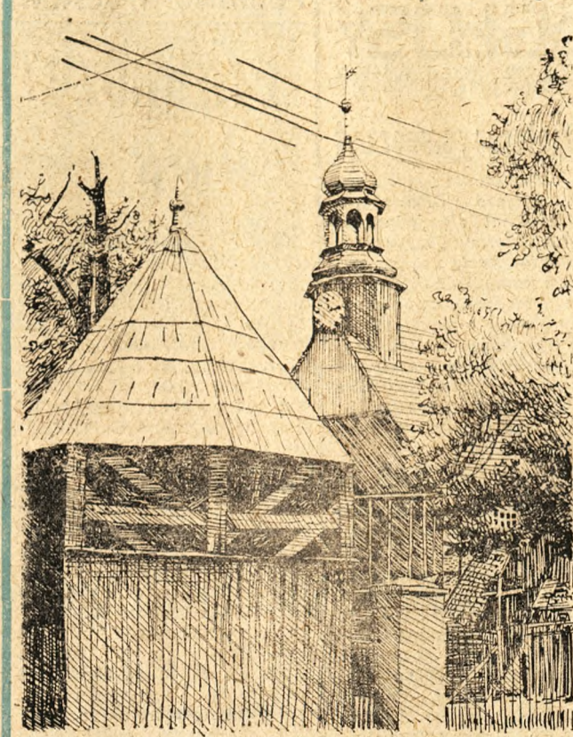
Szlichtyngowa (Leszczyńskie) nazwę swą wzięła od nazwiska założyciela Jana Szlichtynga, sędziego wschowskiego. Za jego życia zbudowano w tym miasteczku drewniany kościół. Rys. Krystyna Popiak