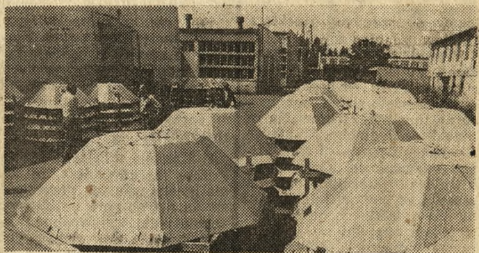
Zakłady Produkcji Sprzętu i Urządzeń Drobiarskich w Gostyniu (Leszczyńskie) są jednym z producentów sprzętu i urządzeń do wylęgu i hodowli drobiu. Wstrzymanie inwestycji spowodowało wycofanie zamówień, w związku z tym na terenie zakładu w Gostyniu na odbiór czeka 400 elektrycznych kwok (na zdjęciu).