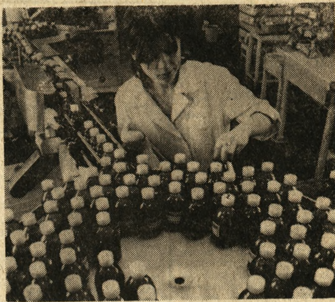
Mimo, że ceny skupu nie zachęcają do uprawy i zbieractwa ziół, produkcja w zakładach zielarskich utrzymuje się na stałym poziomie. M. in. poznański „Herbapol” dostarcza na rynek krajowy leki, syropy i esencje spożywcze. Na zdjęciu: produkcja syropu „Tussipept”.