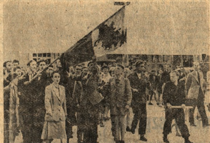
Poznański Czerwiec 1956.

wyraźne etapy. Pierwszy to manifestacja uliczna której celem było doprowadzenie do wiecu z udziałem przedstawicieli najwyższych władz. Drugi to zamieszki uliczne, rewolucja uliczna, której równoległe towarzyszyły działania państwowe o charakterze militarnym.