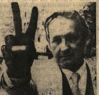
Na zdjęciu: Andrzej Wajda w chwili po ogłoszeniu werdyktu jury.