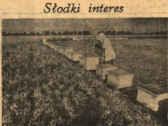
Dział Pszczelarski Wojewódzkiego Ośrodka Postępu Rolniczego w Sielinku (Poznańskie) prowadzi liczne badania związane z hodowlą pszczoł. Na zdjęciu: ruchoma pasleka na polu rzepaku dostarczy danych związanych z ich żywieniem.