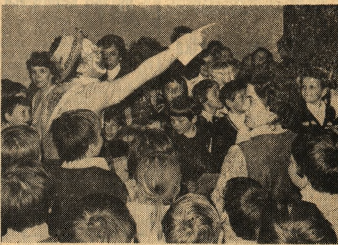
Na zdjęciu: występ teatru „Kalambur” z Wrocławia.