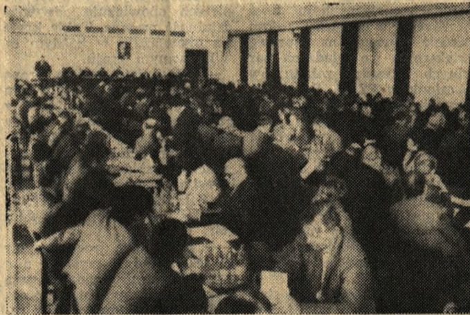
Na zdjęciu: fragment sali obrad.