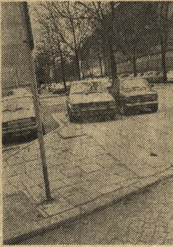
Bywa, że kierowca parkuje samochód na chodniku skutecznie uniemożliwiając przejście przechodniom, co ilustruje zdjęcie wykonane na ul. Marcelesińskiej.