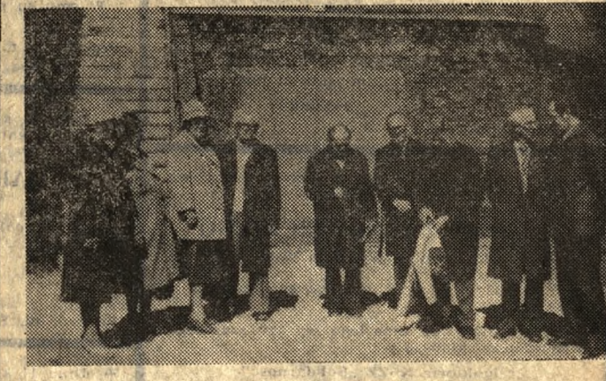
Kwiecień - Miesiąc Pamięci Narodowej - szczególnie skłania do refleksji o przeszłości. Odżywa w wielu środowiskach pamięć do ludzi, którzy walcząc z hitlerowskim okupantem, oddali życie za Ojczyznę. Na terenie Fortu VII i obozu w Żabikowie hold poległym oddali dziennikarze-emeryci, składając wiązanki kwiatów.