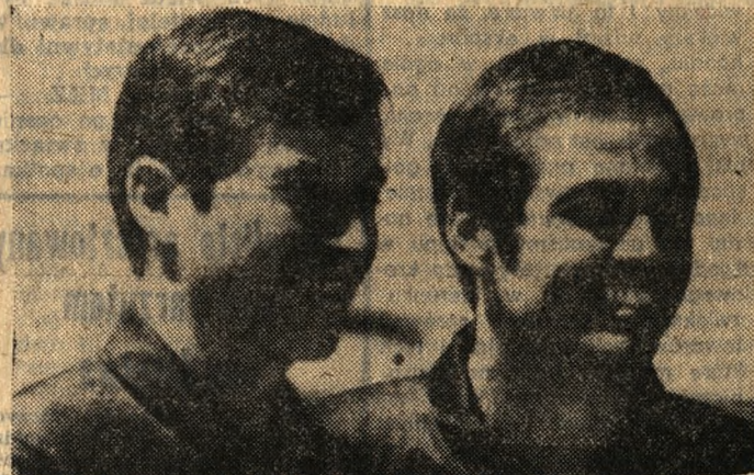
Astronauta amerykańscy John Young i Bob Crippen po pomyslnym wyładowaniu promu kosmicznego „Columbia” w bazie lotniczej Edwarda w Kalifornii.