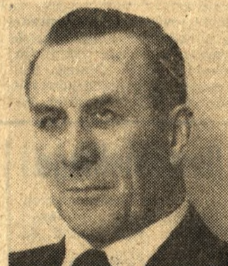
STANISŁAW WYLUPEK MINISTER PRZEMYSŁU MASZYN CIĘŻKICH I ROLNICZYCH