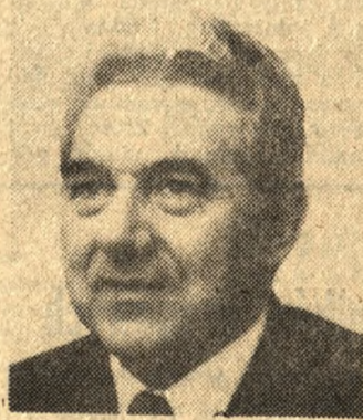
ANDRZEJ JEDYNAK WICEPREMIER