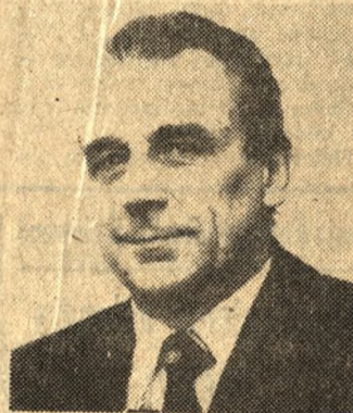
WALDEMAR KOZŁOWSKI MINISTER LEŚNICTWA I PRZEMYSŁU DRZEWNEGO