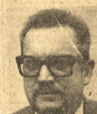
TADEUSZ SZLACHOWSKI MINISTER ZDROWIA I OPIEKI SPOŁECZNEJ