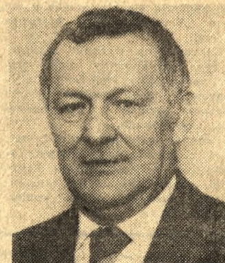
MIECZYŚLAW RAKOWSKI WICEPREMIER