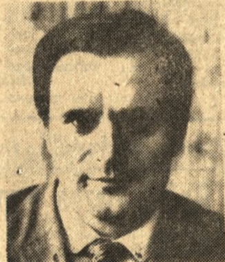
BOLESŁAW FARON MINISTER OŚWIATY I WYCHOWANIA