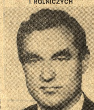
JERZY WOJTECKI MINISTER ROLNICTWA