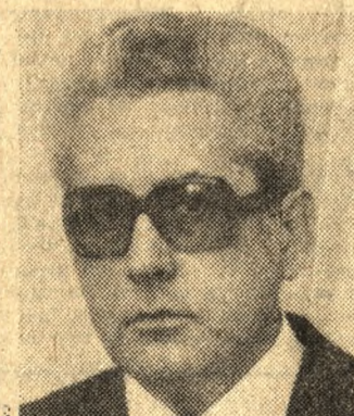
KAZIMIERZ KLEK MINISTER PRZEMYSŁU CHEMICZNEGO