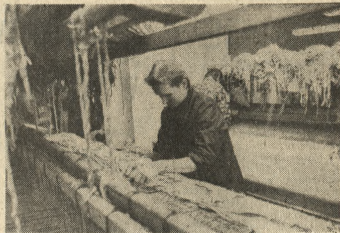
Pracownicy wzorczeni Wielkopolskiej Spółdzielni Rękodzielstwa Artystycznego w Poznaniu przygotowują rocznie do produkcji około 30 projektów kilimów wzorowanych na regionalnej sztuce ludowej. Na zdjęciu: tkanie kilimów w jednym z zakładów spółdzielni w Wielichowie.