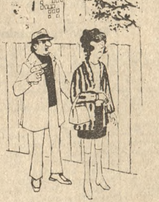
— Proszę się nie ruszać. Mój pistolet wodny wycelowany jest w pani fryzurę...