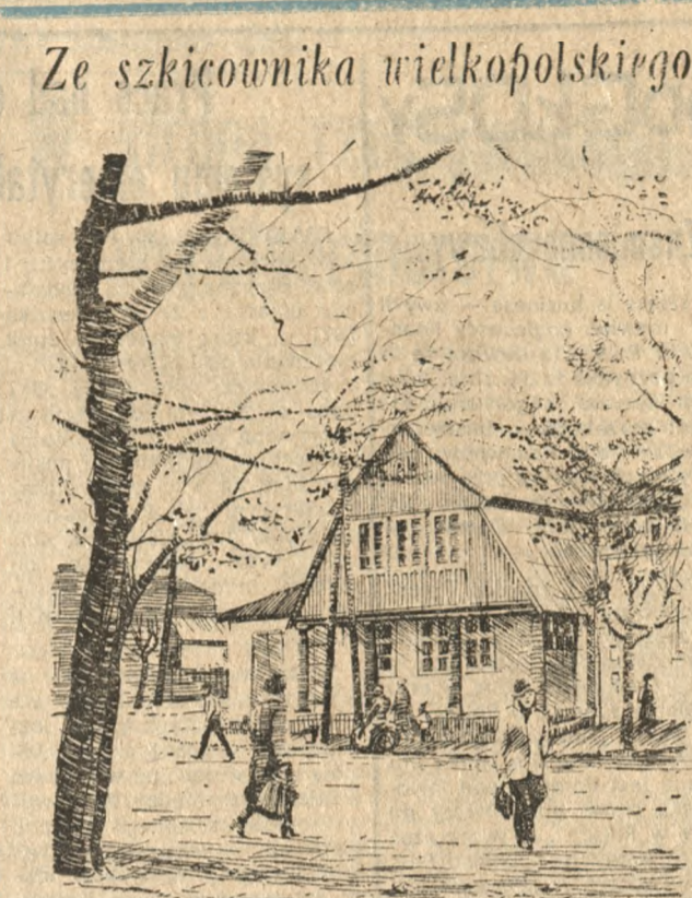
Ze szkicownika wielkopolskiego Pyzdry (Konińskie) posiadają kilka interesujących zabytków architektury. Na rysunku — jeden z nich, drewniany dom z podcieniami, postawiony w 1768 roku. Obecnie znajduje się w nim Muzeum Regionalne i Historyczne. Rys. — Krystyna Popiak

Wypadek w kopalni „Jaworzno” (PAP) W Kopalni Węgla Kamiennego „Jaworzno” na poziomie 500 w pokładzie 302 nastąpił zawał na ok. 8 m chodnika. W rejonie zawału pracowało 6 górników. Na skutek niezwłocznie podjętej akcji ratowniczej dotarło do odciętych gór-