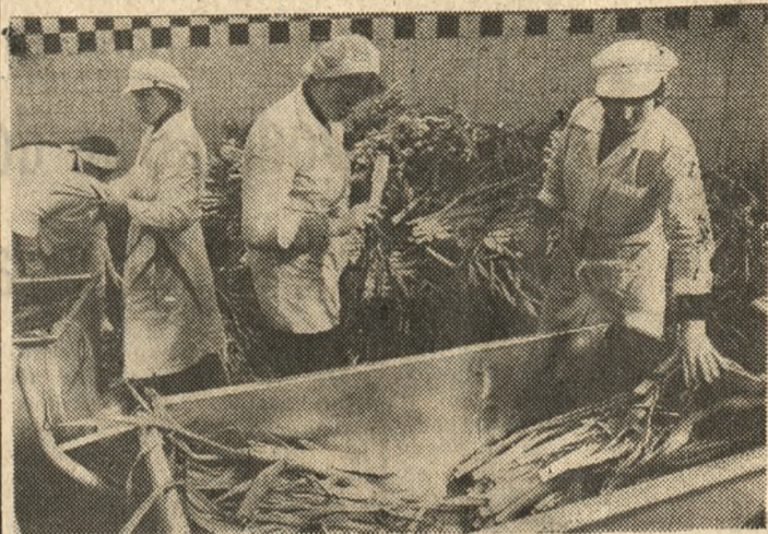
Przetwórnia Owocowo-Warzywna w Rydzynie (Leszczyńskie) mrozi w zakładowej chłodni pory, seler, marchew i kalafior. Są to składniki produkowanych tu mieszanek warzywnych. Wartość tygodniowej produkcji zakładu przekroczy 140 mln zł. Na zdjęciu: przygotowanie selerów do mrożenia.