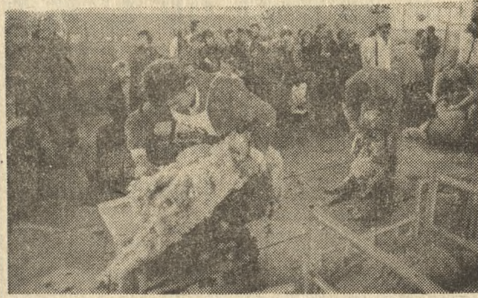
Na zdjęciu: strzygacze w czasie zawodów, które odbywały się w hali Ośrodka Wyzolenia Jeździeckiego na Woli w Poznaniu

Owce nietrudno wyhodować, trudno natomiast ostrzyć. Ludzi posiadających tę umiejętność jest niewiele, toteż w okresie strzyż są rozbijywani przez właścicieli owczych stad. Aby pozyskać więcej strzyżycieli, od kilku lat organizowane są konkursy. Od włościańskiego i terminowego ostrzyżenia owcy zależą bowiem jakość wełny i jej należyte odrosty. Trzeba to zatem robić fachowo, nie wyrządzając przy tym krzywdy zwierzęciu.