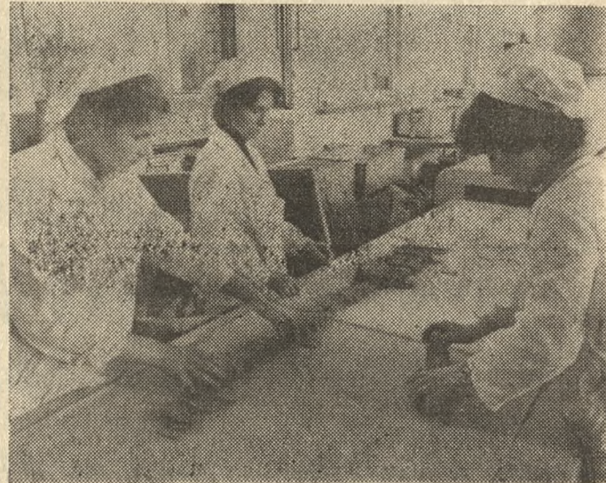
Kupujący wyroby cukiernicze „Kaliszanki” chwalą ich dobrą jakość. Najmłodszym szczególnie smakują popularne herbatniki „Be-be”. Końcowy fragment linii do ich wypieku prezentuje zdjęcie.