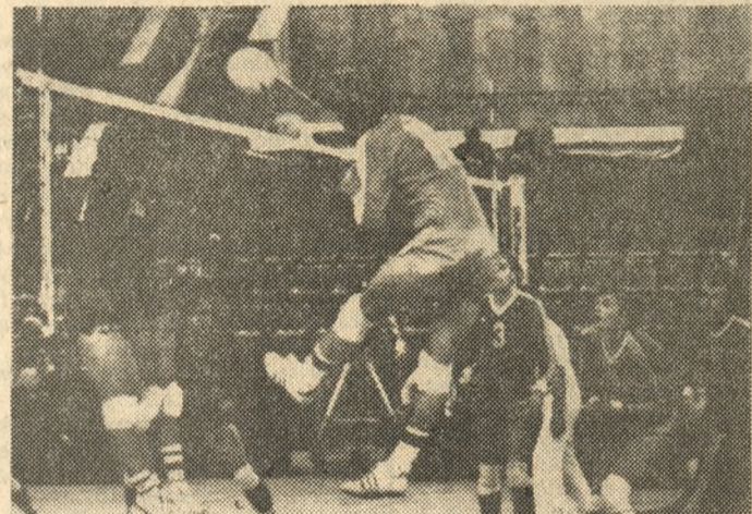
Bardzo dobrze w turnieju olimpijskim spisuje się reprezentacja polskich siatkarzy, która wczoraj w kolejnym meczu pokonała Libię 3:0. Na zdjęciu: fragment inauguracyjnego pojedynku polskich siatkarzy z Jugosławią (Polacy po prawej stronie).