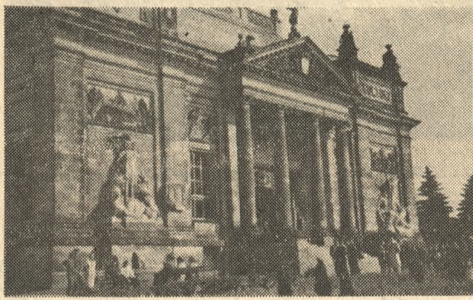
W tym budynku odbyło się podpisanie wielkopolskiego układu.