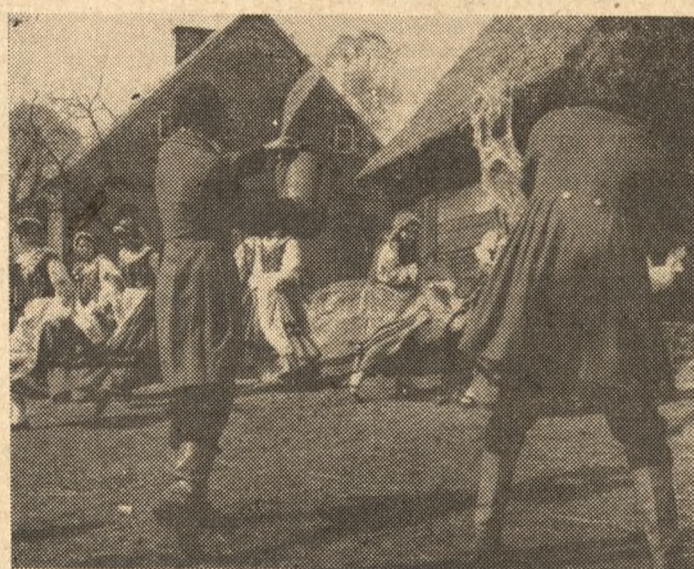
Na zdjęciu: tradycyjny śmigus-dyngus.

Dziś owo obmywanie się w rzekach i jeziorach już nie jest praktykowane, bo od wody (dziś trzeba by ją oczyścić z zanieczyszczeń chemicznych i naturalnych) skuteczniejsze okazały się środki farmaceutyczne. I dyngus w tej starej formie, o któ-