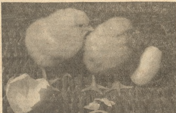
Żeby była kwoka — musi być kurczak.