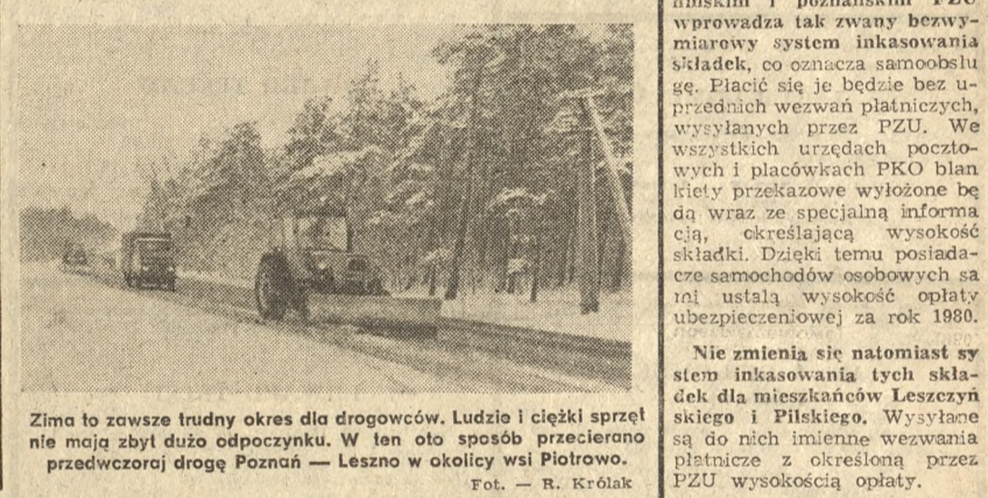
Zima to zawsze trudny okres dla drogowców. Ludzie i ciężki sprzęt nie mają zbyt dużo odpoczynku. W ten oto sposób przecierano przedwczoraj drogę Poznań — Leszno w okolicy wsi Piotrowo.