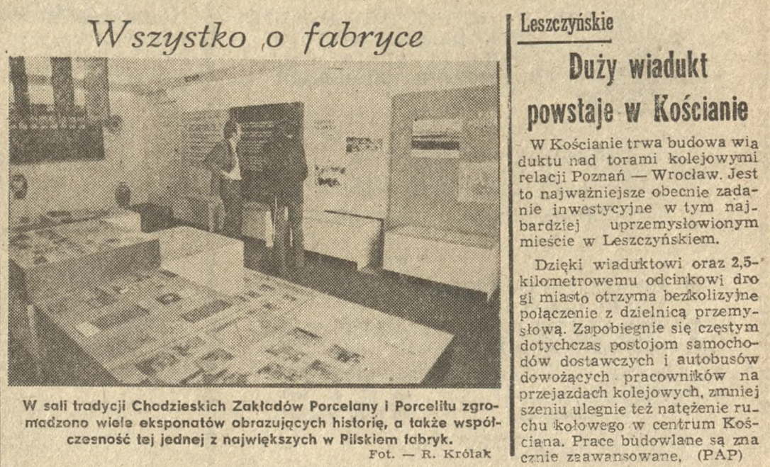
W sali tradycji Chodziejskich Zakładów Porcelany i Porcelitu zmodernizowano wiele eksponatów obrazujących historię, a także współczesność tej jednej z najwzrostających w Pilskiem fabryk.

PROGRAM I 14.15 - Kino Telefilm Najmłodszych oraz film animowany TV