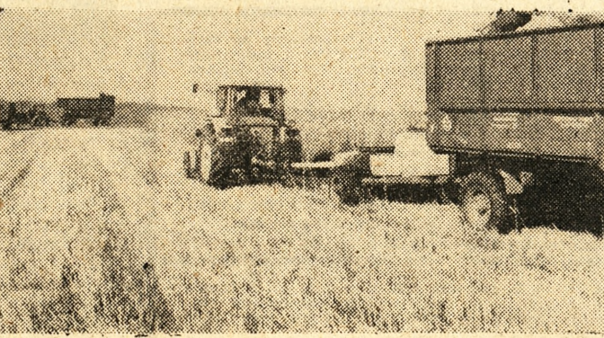
Na polach należących do stadniny koni w Racocie (Leszczyńskie) trwa ścinanie zielonki na kiszonkę.