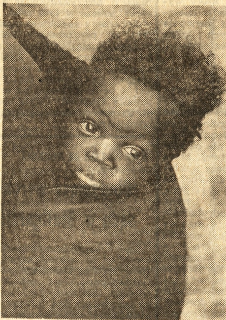
Jeden z fotografów wystawy „Dzieci świata”.

Z. Staszyszyn — z okazji Międzynarodowego