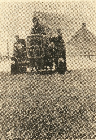
Opryskiwanie zbóż środkami chemicznymi na polach w Mielżynie (województwo konińskie).