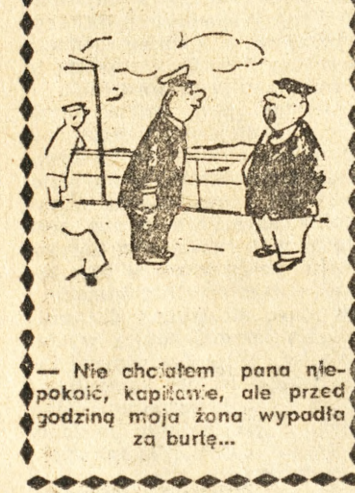
Nie chciałem pana niepokoić, kapić, ale przed godziną moja żona wypadła za burtę...