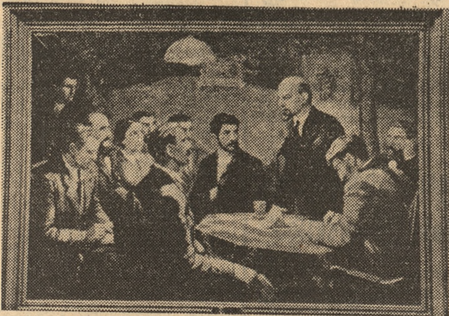
Obraz Czesława Galy — Narada krakowska.

ną wiosną w lesie jest cudownie, krzaki pokryte są pachem złotych kwiatów, gałęzie drzew nabrzmiały wiosennymi sokami. Było upajająco. Ale z powrotem długo wlekliśmy się, zanim dobrnęliśmy do miasta, tramwaje nie kursowały z powodu Wielkiej Soboty, a ja byłam już zupełnie bez sił. Całą zimę 1913 roku choro wałam, serce niedomagało, ręce mi drżały, byłam