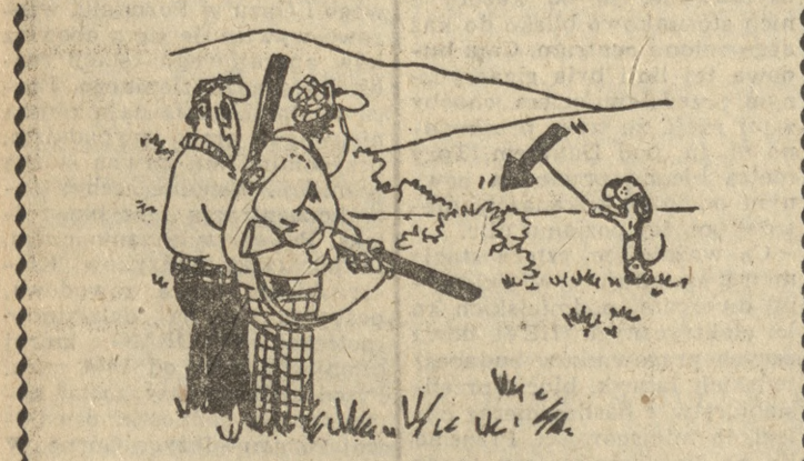
— To mój najlepszy wyzół.