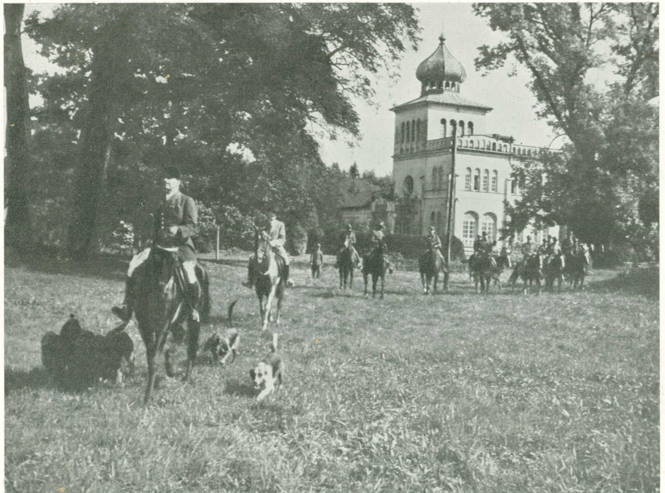
Osiek. Wyjazd Oddziału Konnego Przystosobienia Wojskowego „Krakus” z parku osieckiego na bieg za sforą Podkarpackiego Koła Jazdy Myśliwskiej.

5) W majątku są dwa zasadnicze rodzaje gleb: w dolinie rzeki Soły, w tej okolicy tworzącej swego czasu dno około 4 km szerokiego jeziora dyluwialnego, są mady na przepuszczalnym podglebiu. Fa-