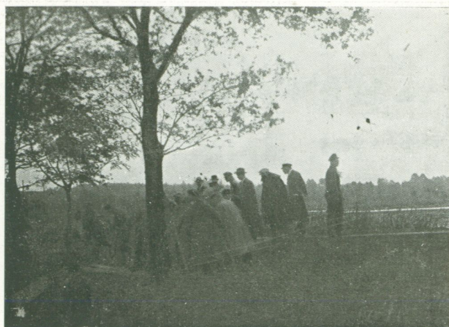
Osiek. Zwiedzanie rybołówstwa osieckiego przez Misję Rolniczą Francuską w 1923 roku.

listy teren, otaczający tę dolinę, złożony jest z ciężkich glin podkarpackich na nieprzepuszczalnym podglebiu ilastym. Grunty te wymagają z uwagi na obfitość opadów drenowania przy małych odstępach sączków (6—8 m). Do takich warunków glebowych i atmosferycznych dostosowana jest cała produkcja roślinna.