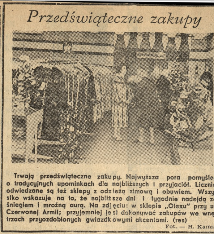
Trwają przedświąteczne zakupy. Najwyższa pora pomyśleć o tradycyjnych upominkach dla najbliższych i przyjaciół. Licznie odwiedzane są też sklepy z odzieżą zimową i obuwiem. Wszystko wskazuje na to, że najbliższe dni i tygodnie nadejdą ze śniegiem i mroźną aurą. Na zdjęciu: w sklepie „Ofexu” przy ul. Czerwonej Armii; przyjemniej jest dokonywać zakupów we wnętrzach przyozdobionych gwiazdkowymi akcentami. (res)

PROGRAM I: 8.10 Mel. naszych przyjaciół; 8.35 Bydgoski koncert; 9.05 Dla kl. III i IV (jęz. polski); 9.25 Ślask czarny może być zielony; 9.25 Muzyka lud. krajów azjatyckich; 10.03 Różne arie, różne głosy w operach polskich; 10.30 „Lalka”; pow.; 10.40 Z nagrań E. Garnera; 11.12 Rytm, barwy, nastroje; 11.30 Kozłowski na muz. antenie; 12.25 Kozłowski na muzycznej antenie; 13 Wirtuoz instrumentu — Janusz Muniak — saksofon; 13.15 Dom i my; 13.35 Spotkanie z folklorem; 14 Co się wam w tej audycji najbardziej podoba; 14.25 Człowiek i środowisko — wawęda; 14.30 Rytm młodych — tylko solo; 15.10 Z polskiej fonetki; 15.15 Z lekka muzyka przez lata; 16.05 U przyjaciół; 16.11 Antologia jazzu polskiego; 16.30 Aktualności kulturalne; 16.35 Estrada przyjaciół; 17 Radiokurier; 17.20 Parada polskiej pieśni; 17.40 Wielkie Ork. — Sławne tematy; 18 Muzyka i Aktualności; 18.30 Twórcy polskiej pieśni; 19.15 Ork. PR i TV w Katowicach; 19.40 Świętę przebiego na czesku; 20.05 NURT — „Współczesne lewicowe ruchy i ich doktryny polityczne”; 20.25 Nowości telewizyjnej przedstawia Roman Waszeko; 21.15 Koncert żywych; 22.20 Mel. filmowe „Matczyno z rozszala”; 22.45 Mini-recital M. Kotarskiej; 23.10 Kompendium z zagranicy; 23.15 Polki Paganini — Karol Lipiński.