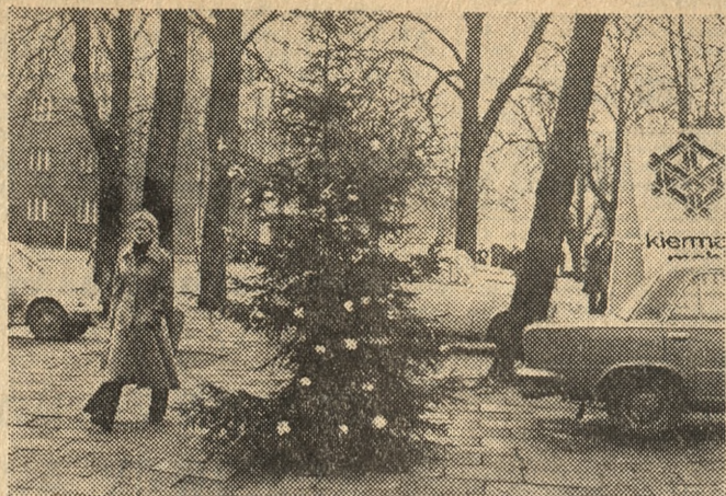
Na placach i ulicach miasta pojawiły się tradycyjne drzewka choinkowe, sygnał zbliżających się świąt; na zdjęciu: przy ul. Swierczewskiego.