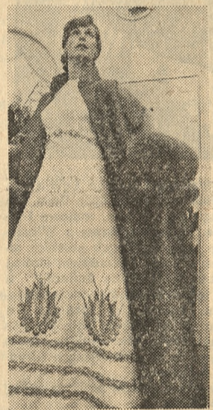
Suknia wieczorowa bogato zdobiona haftem, model wie-deński.