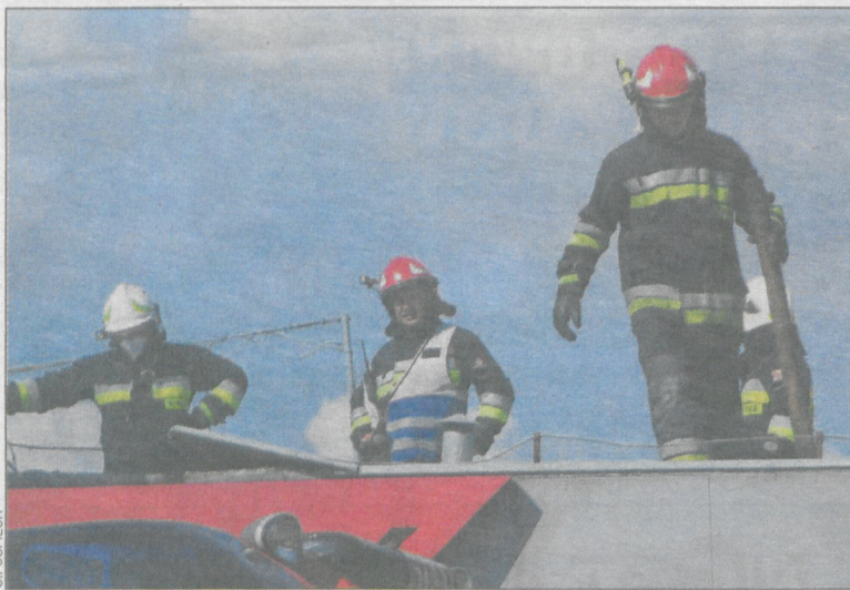
Strażacy rozebrali część konstrukcji dachu sklepu