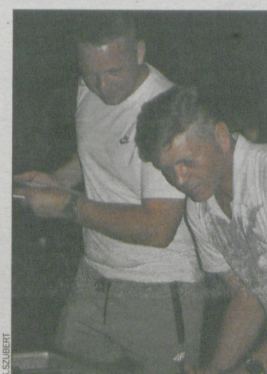
Panowie grali w piłkarzyki