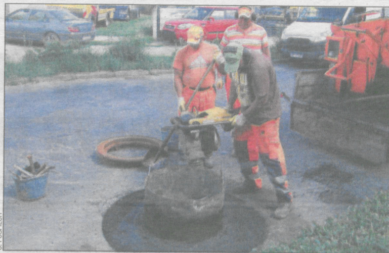
W trakcie wymiany włazu na ul. Kobylińskiej

Spółka komunalna wymienia włazy w ciągu dróg krajowych przechodzących przez Krotoszyn (zarówno w studniach kanalizacji deszczowej, jak