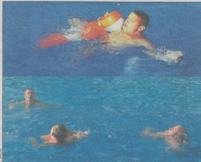
Zajęcia odbyły się na pływalni miejskiej przy ul. Ogrodowskiego

Zajęcia tego typu są niezbędne. Sezon wakacyjny w pełni, a gorące dni sprawiają, że amatorów kąpieli nie brakuje. Statystyki wypadków związanych z wypoczynkiem nad wodą nie napawają optymizmem. Jest coraz więcej utonięć. Profilaktyka w tym zakresie stała się konieczna. (popi)