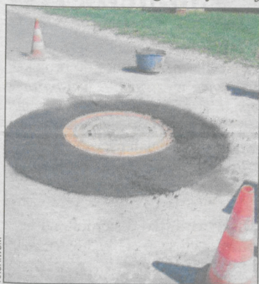
Pierwszą naprawę wykonano na ul. Bolewskiego

Prace, na które przetarg wygrała firma z Gliwic, rozpoczęły się 24 lipca. Nowe pokrywy z włazami wymieniono najpierw na ul. Bolewskiego, Kobylińskiej