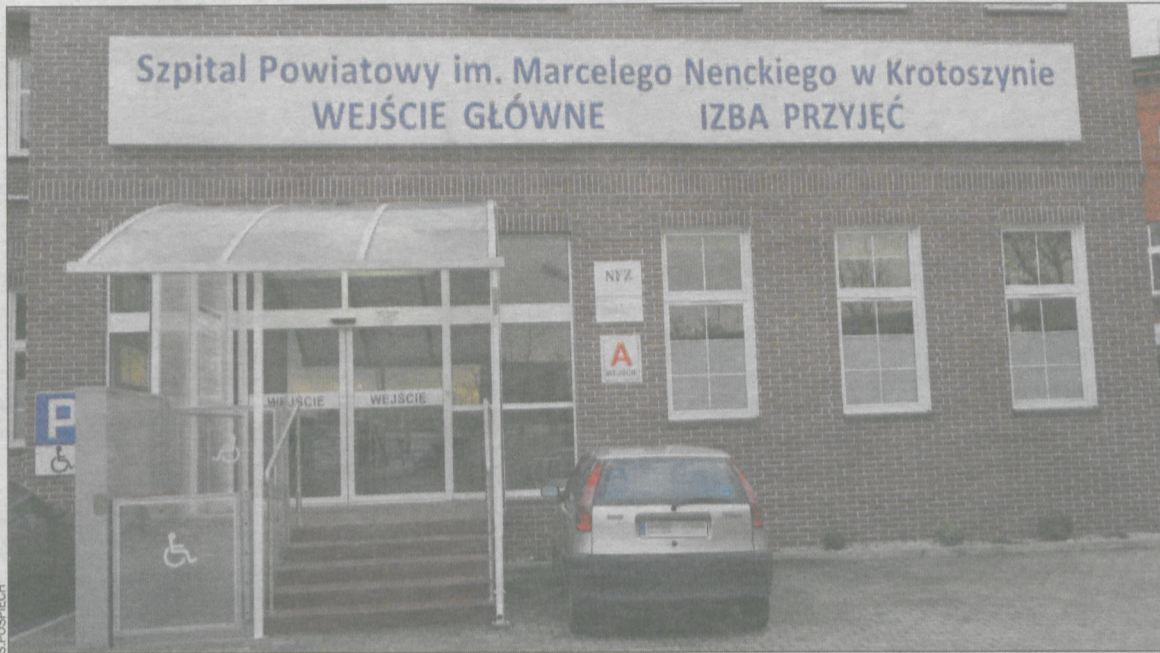
Przez cały swój pobyt pacjent nie sprawiał żadnych problemów, był przyjaźnie nastawiony do wszystkich