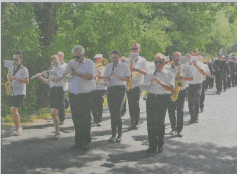
Akompaniowała Krotoszyńska Orkiestra Dęta