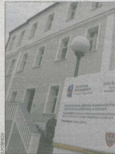
Budynek ma nowe oblicze

– Nie możemy postawić ławek bez żadnych konsekwencji. Jest to bowiem element małej architektury i trzeba przeprowadzić procedurę budowlaną