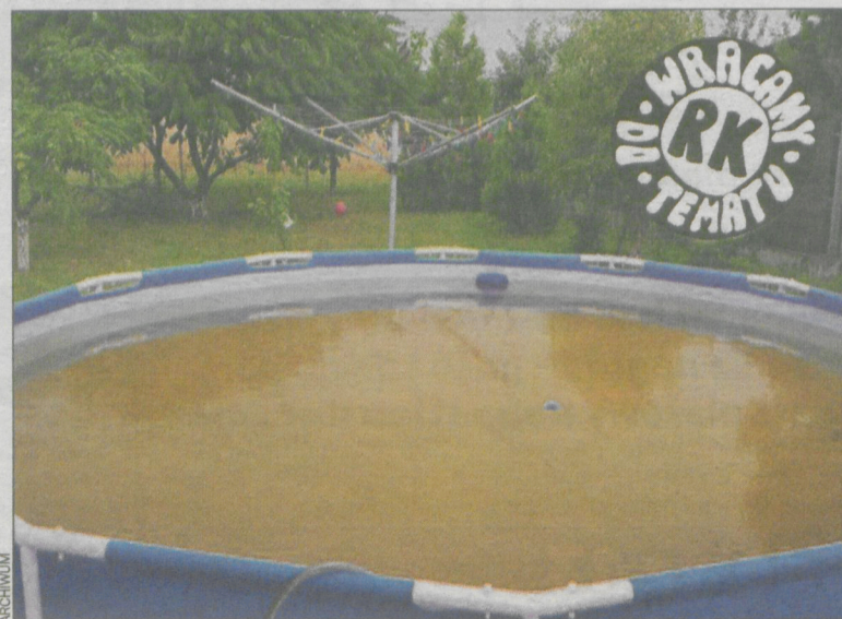
Basen napełniony brązową wodą

Czytamy w nim m.in. Zwracamy się z uprzejmą prośbą o zainteresowanie się jakością wody płynącej z naszych kranów. Problem ten został zaobserwowany już w kwietniu br,