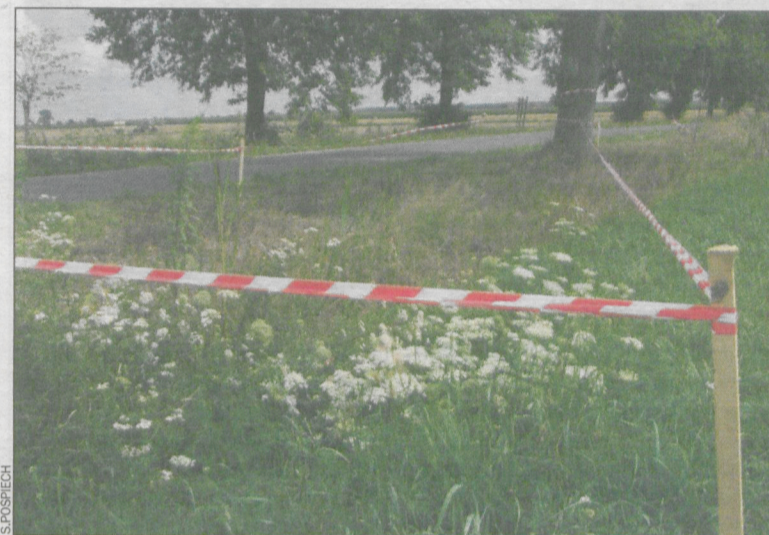
Teren przy drodze powiatowej został ogrodzony