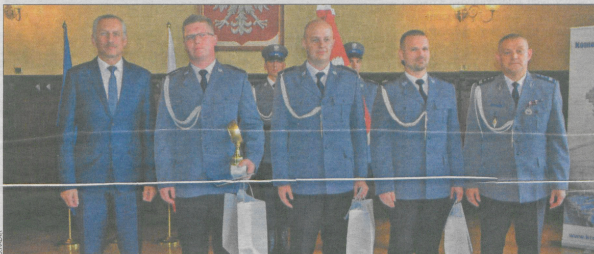
Funkcjonariusze zbrali się w sali Ratusza