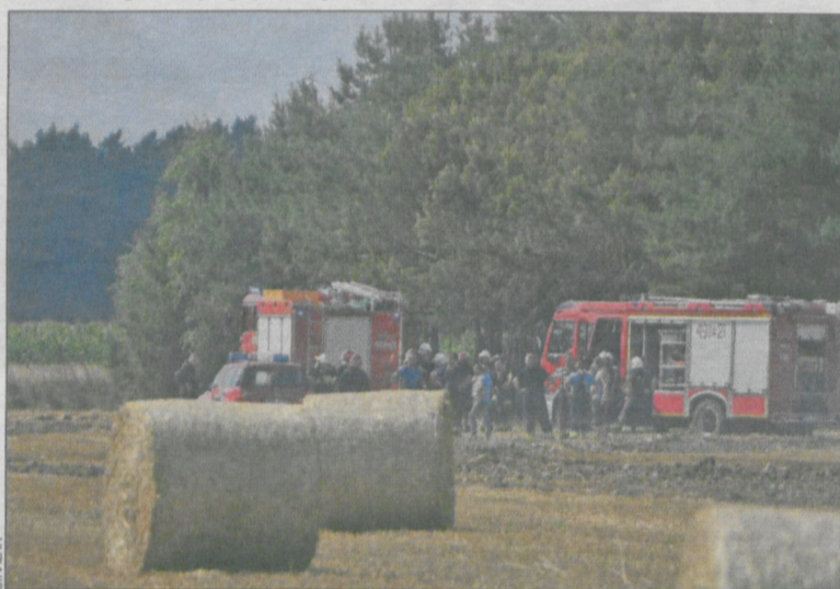
Splonęło zboże na pniu

Prawopodobna przyczyna powstania ognia to wada techniczna maszyny rolniczej, ale ostateczne ustalenia należą do policji.