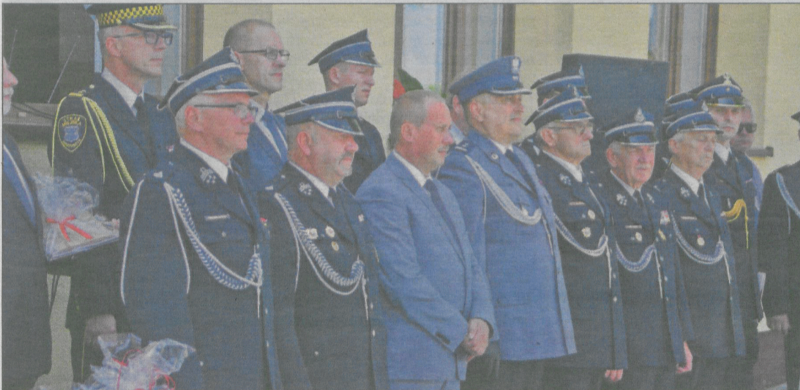
Przed remizą zebrali się zaproszeni goście z burmistrzem Krotoszyna na czele