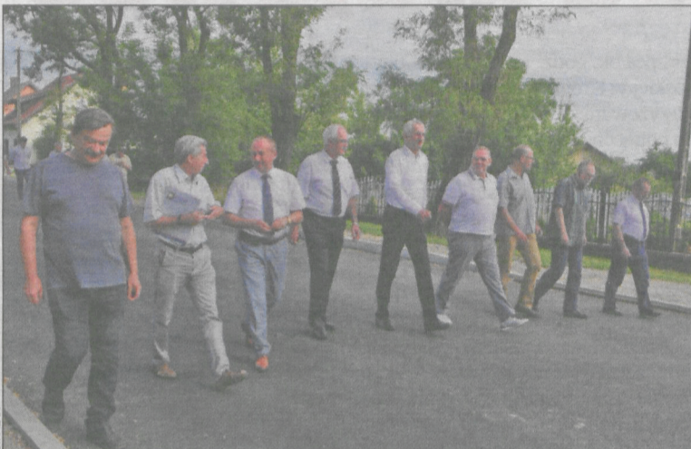
W odbiorze inwestycji wzięli udział m.in. starosta, burmistrz, szefowie firmy wykonawczej

Na fragmencie drogi o długości 220 m od ul. Ostrowskiej (przy stacji paliw) do skrzyżowania z os. Księżycowym położono asfalt. Konstrukcja nawierzchni to podbudowa, warstwa bitumiczna i wiążąca. Brakuje jednak pięciocentymetrowej warstwy ścieralnej.