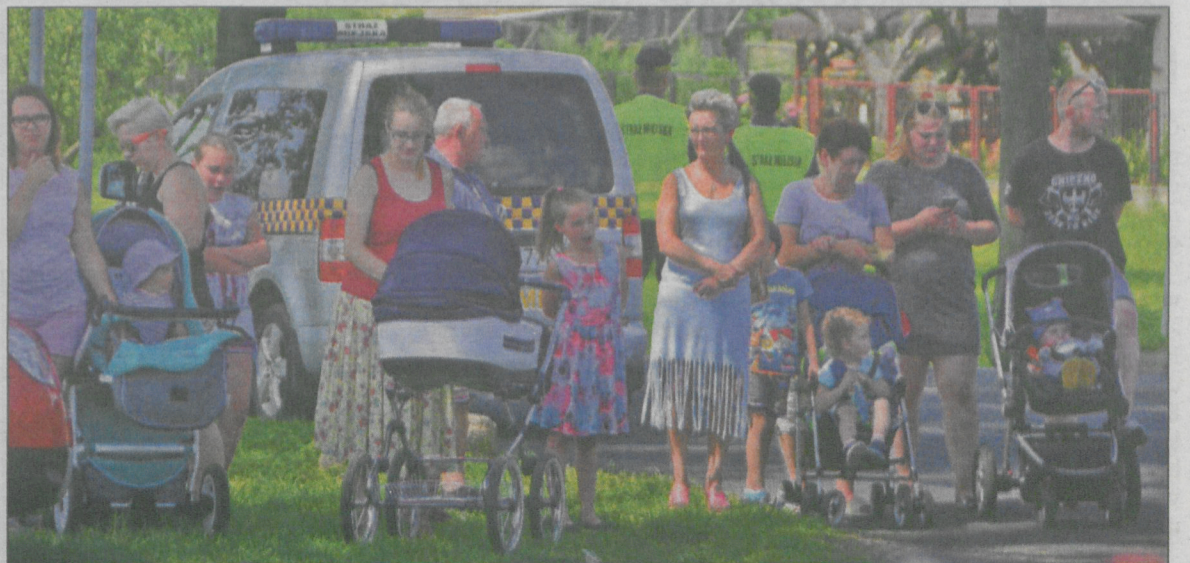
Mieszkańcy Benic z zaciekawieniem przyglądali się uroczystości