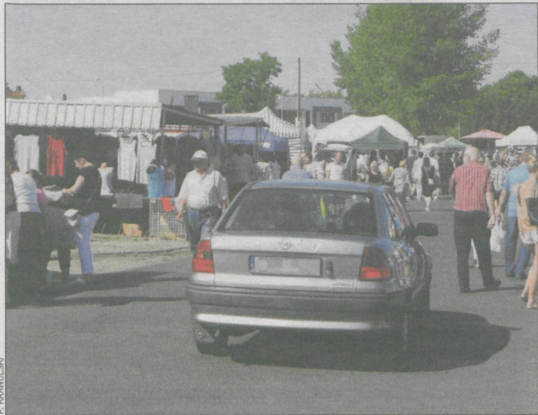
Przez środek placu jeżdżą samochody

tłum. Dziś ruch jest regulowany jedynie przez zakaz zatrzymywania się obowiązujący we wtorki i piątki w godz. 5.00-12.00. Niestety, brak ograniczenia prędkości. – Przez to kierowcy mogą poruszać się z prędkością dopuszczalną w mieście, czyli 50 km na godz. – mówi krotoszynianin.