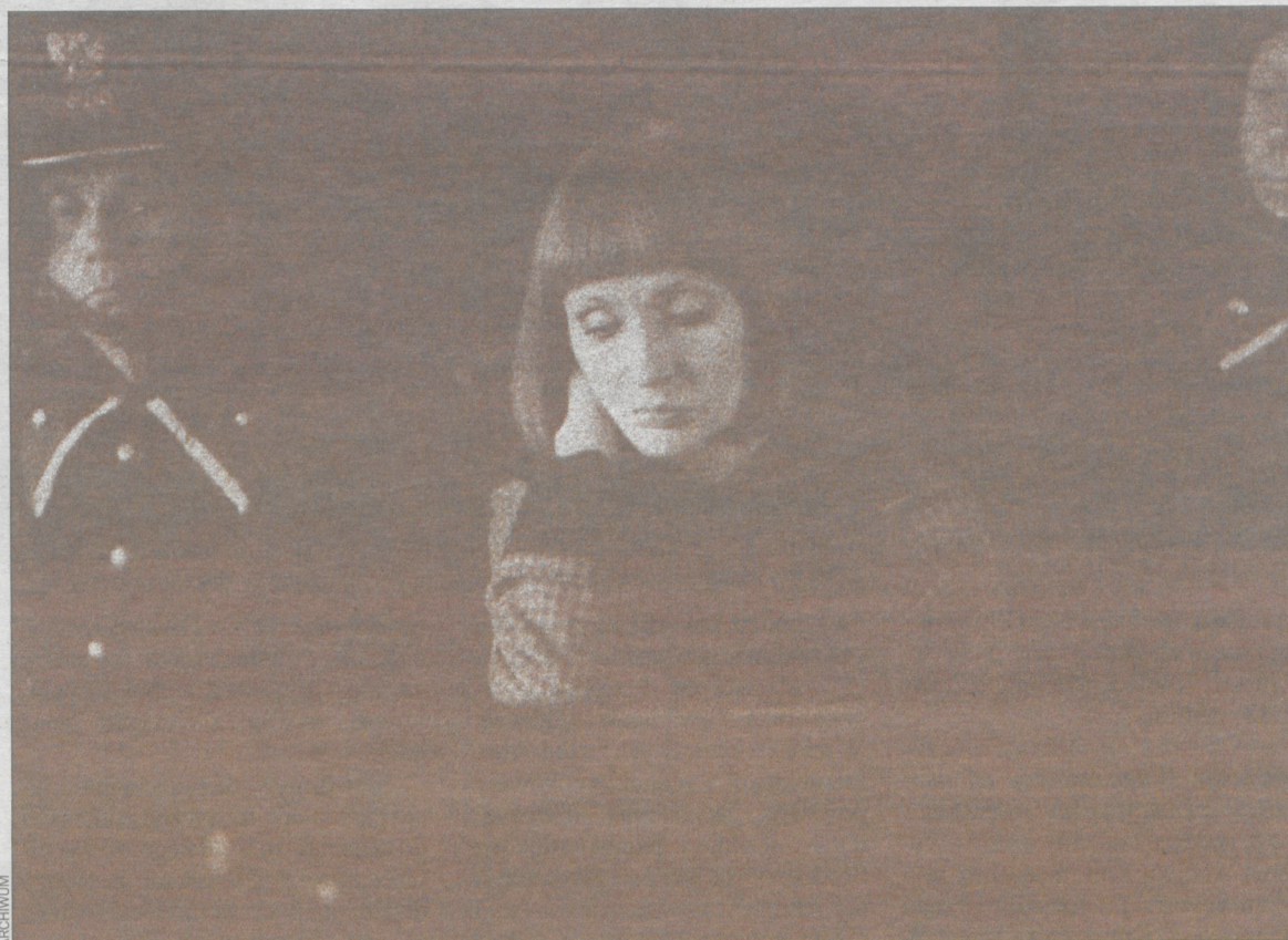
Scena z filmu G. Królikiewicza „Na wylot” (1973) – fotoilustracja