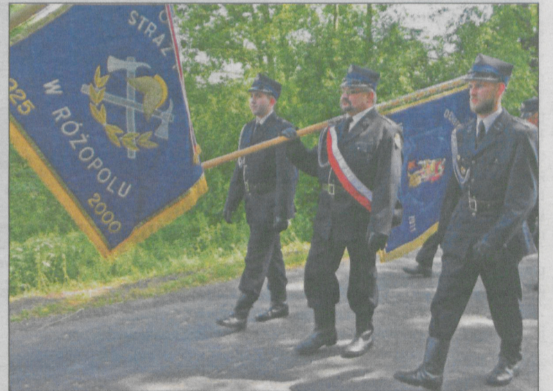
W defiladzie ulicami wsi przeszły począty sztandarowe OSP z gminy