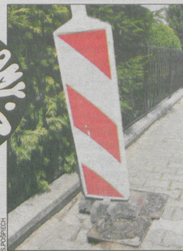
Przyczyną było słabe zagęszczenie podłoża