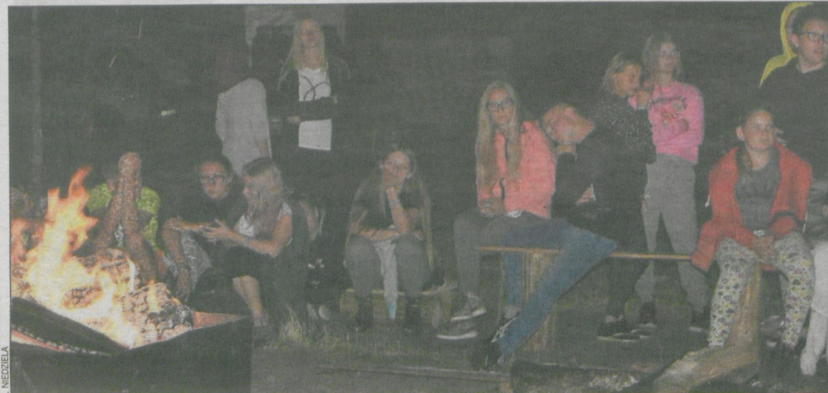
Młodzież integrowała się m.in. podczas wspólnego ogniska

Wyjazd grupy polskiej został sfinansowany ze środków fundacji Polsko-Niemiecka Współpraca Młodzieży, naszego starostwa, powiatowego oddziału Związku Ochotniczych Straży Pożarnych RP, urzędów miast i gmin powiatu krotoszyńskiego oraz licznych sponsorów. (pik)