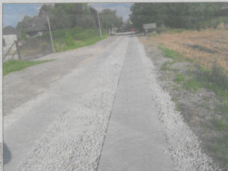
Na ulicy położono dwa pasy betonowe

Do niedawna ta kobylińska ulica była polną drogą, pełną dziur, wystających kamieni, piasku albo błota.