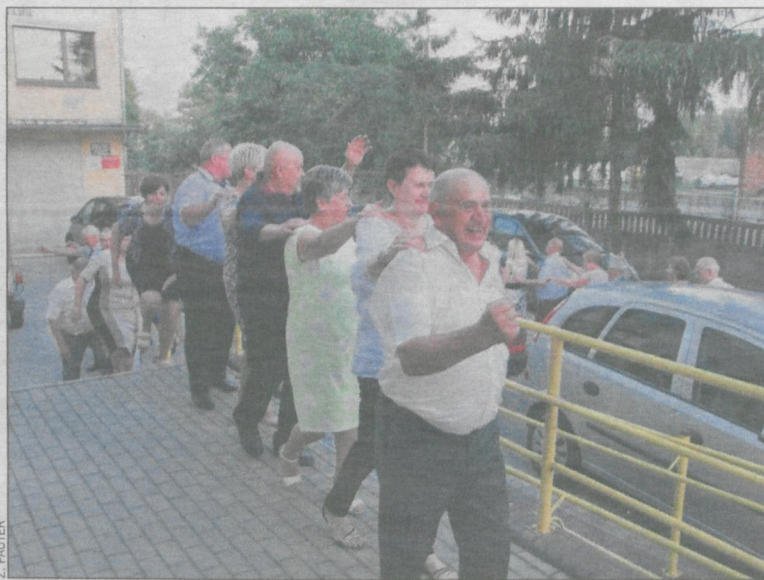
Bawiono się też na wolnym powietrzu

Rozdrażewskie koło Polskiego Związku Emerytów, Rencistów i Inwalidów zorganizowało Senioriadę, na którą zaproszono przedstawicieli kół z całego powiatu. Impreza odbyła się 22 lipca w sali wiejskiej w Rozdrażewie.