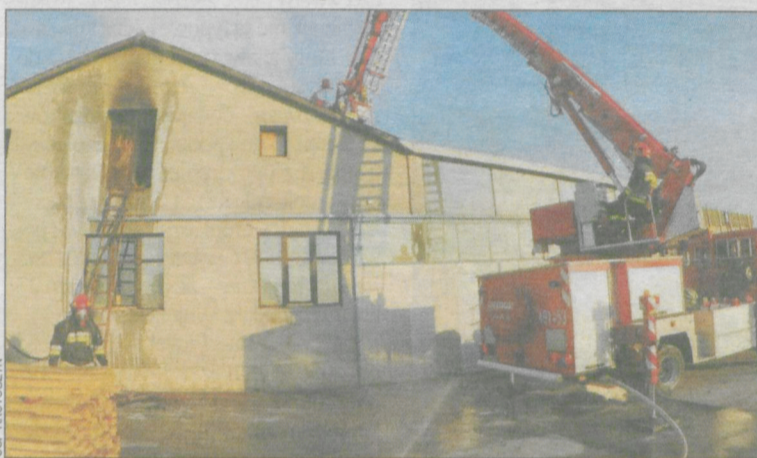
Ogień objął powierzchnię 130 m kw.

również więźby dachowej i eternitowego pokrycia. Strażacy usunęli trociny z pomieszczenia i dogasili je na zewnątrz. Częściowo musieli rozebrać części pokrycia dachowego.