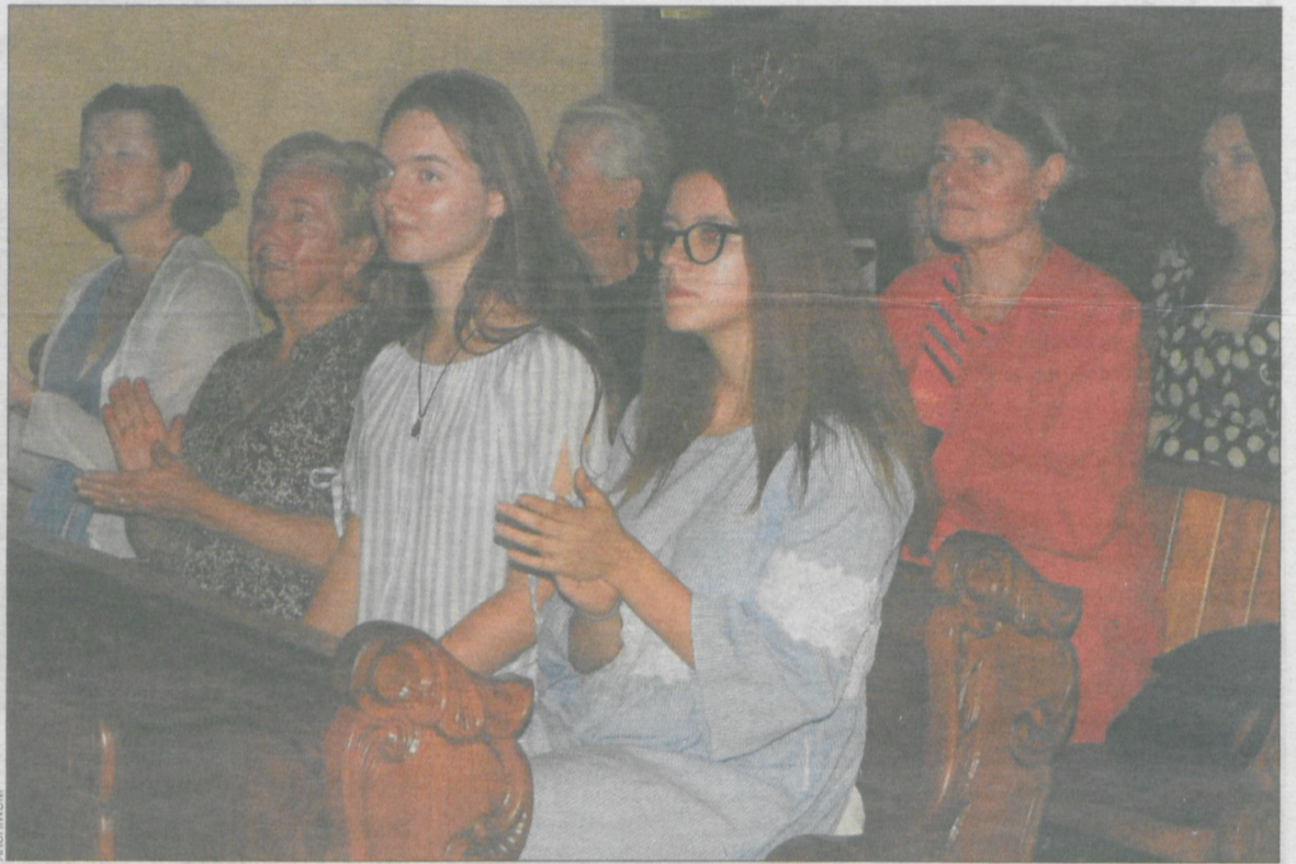
Publiczność w skupieniu wysłuchała koncertu

Licznie zgromadzona publiczność wysłuchała też próbki talentu Feliksa Borowskiego (1872-1956), zafascynowanego muzyką francuską syna polskiego emigranta po powstaniu styczniowym czy pierwszego utworu Augustyna Błocha (1929-2006), w której pobrzmiewały wątki jego fascynacji tematyką religijną. Słuchano także preludium Adoremus Feliksa Nowowiejskiego (1877-1946), twórcy muzyki do Ro-