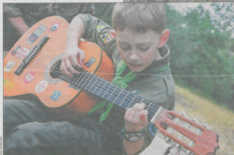
Nie mogło zabraknąć piosenek i gitary

skich 1906/07. Później przyszedł czas na zajęcia programowe, dostosowane do wieku uczestników. Harcerze uczyli się rozpalania ogniska, rozpoznawania gatunków drzew, udzielania pierwszej pomocy i innych przydatnych umiejętności. Dodatkowo na obozie odbywały się zajęcia z profilaktyki uzależnień. Prawie każdy dzień kończono ogniskiem ze wspólnym graniem i śpiewaniem.