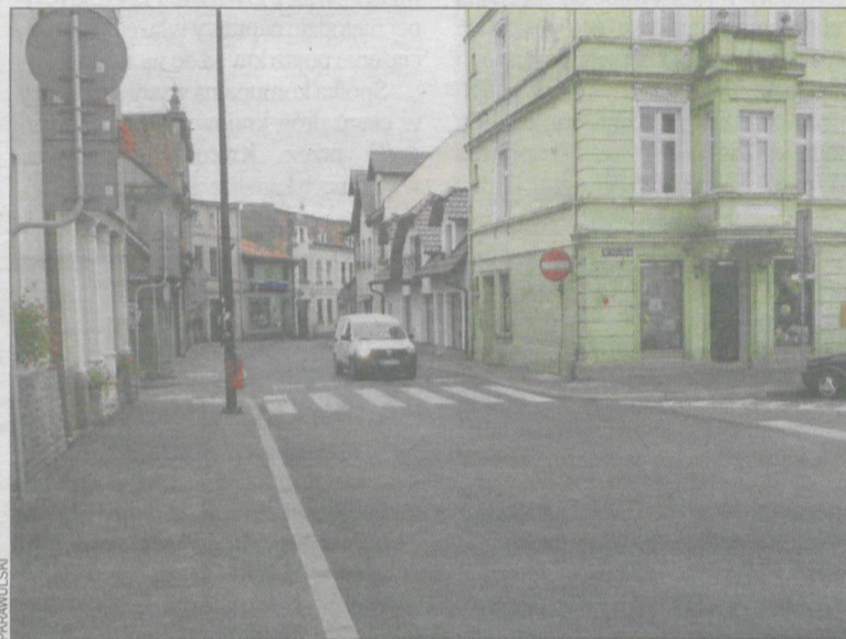
Problem występuje też w ścisłym centrum Koźmina

Poproszony o komentarz rajca stwierdził: – Problemem jest zachowanie niektórych ludzi, bo wrzucają do koszy śmieci z domów, a zimą także popiół. Nie chciałby jednak sięgać po ostrzejsze rozwiązania, jak np. karanie za nieprzestrzeganie regulaminów dotyczących czystości czy czipowania (oznaczania) worków przynależnych do posesji. – Jestem przeciwny. Znacznie podniosłoby to koszty, a poza tym wierzę w siłę edukacji – dodaje. Kosze bywają więc przepel-