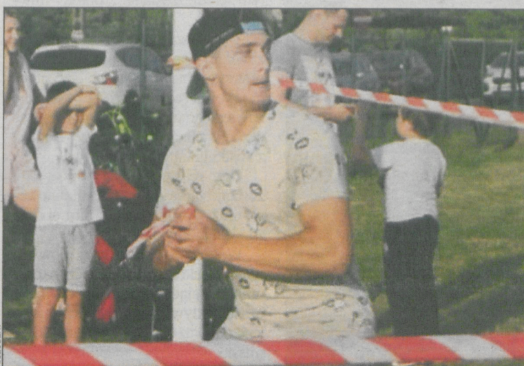
Rzut granatem był jedną z konkurencji