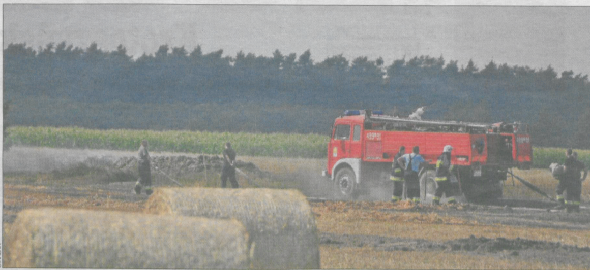
Walkę z żywiołem utrudniała wysoko temperatura

Spaliło się ok. 9 ha zboża na pniu i 800 m kw. poszycia leśnego, gdyż w środku pola był prywatny laszek.