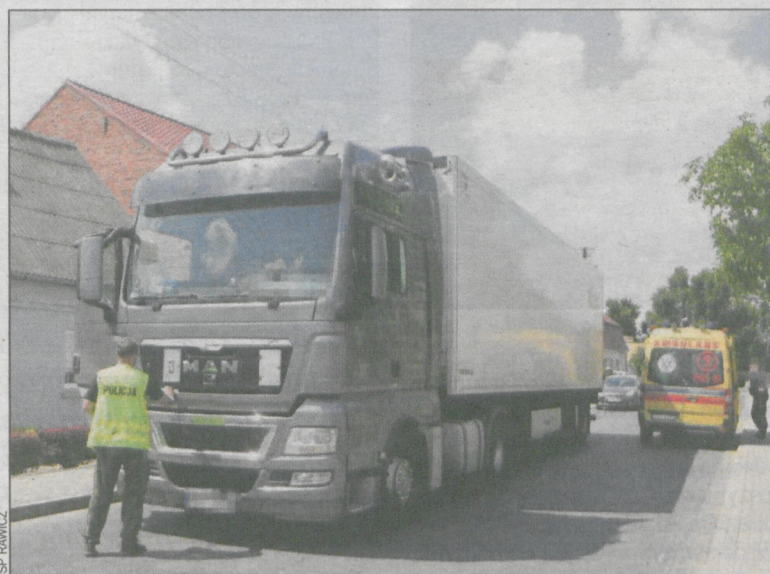
Ciężarówka jechała z małą prędkością, gdy chłopiec wpadł pod jej koła

Wezwano helikopter Lotniczego Pogotowia Ratunkowego. Strażacy na pobliskim boisku wyznaczili lądowisko. Pomogli również przetrans-