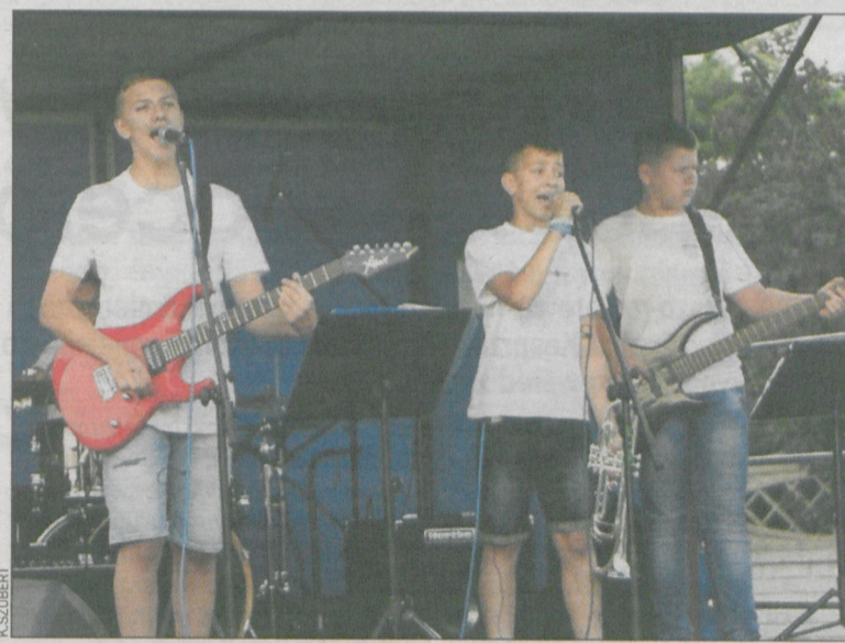
Młodzi i zdolni, czyli zespół Tacy nie Inni