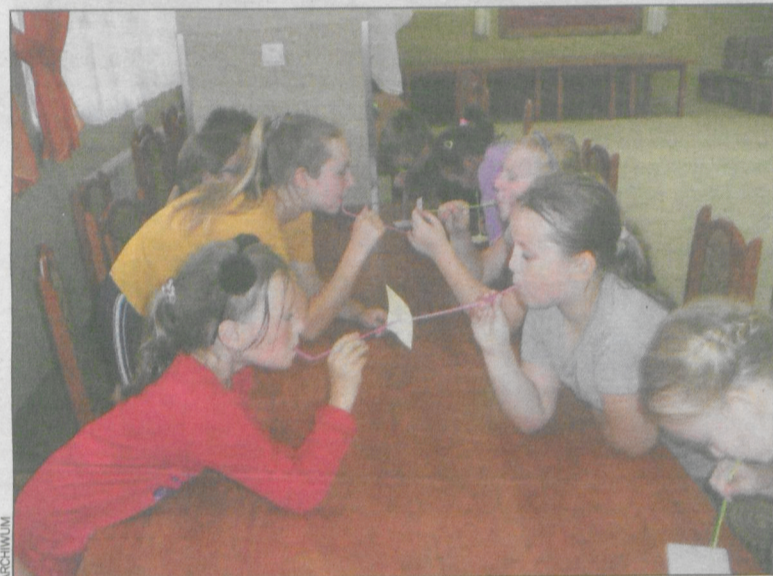
Podczas gier i zabaw w Smolicach