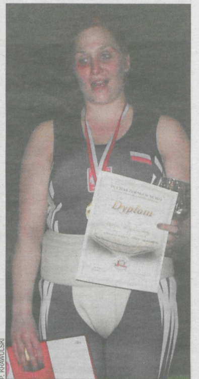
Kibice liczą, że zawodniczka wkrótce znajdzie się znów na podium