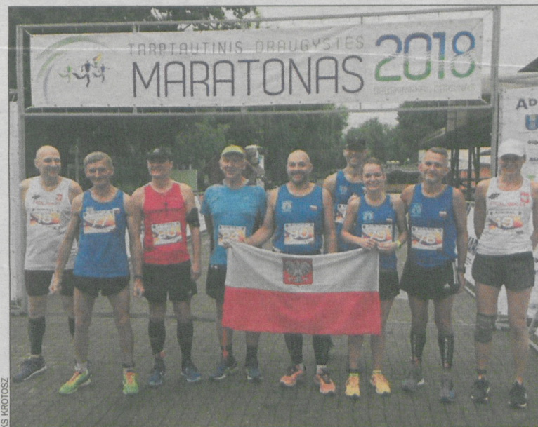
Na starcie biegu