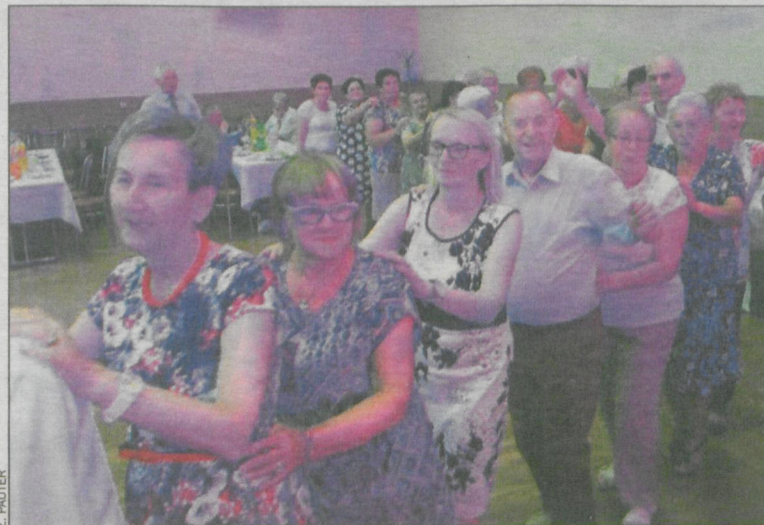
Parkiet cały czas był pełen tancerzy