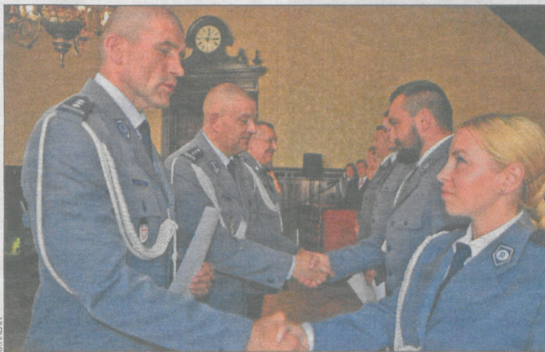
Nominacje na aspirantów sztabowych odebrało 3 policjantów