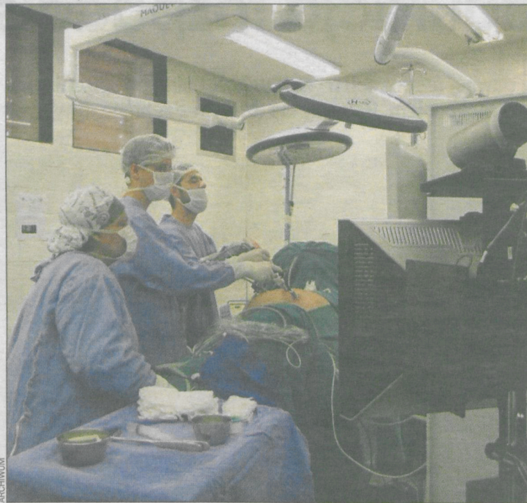
Wykryto cztery przypadki nowotworów, podjęto natychmiastowe leczenie

Z tegorocznych badań skorzystało zgodnie z założeniami projektu 80 mężczyzn, z których prawie połowa,