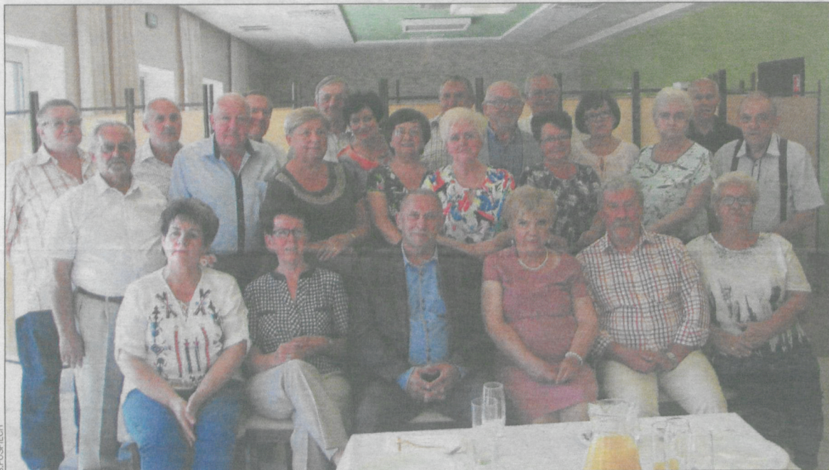
Zrobiono pamiątkową fotografię

1 sierpnia, godz. 9.30 , wycieczka do Górecznika-Rodzinnego Parku Rozrywki w Antoninie. Koszt 5 zł (dla członków) i 15 zł (dla sympatyków). Zapisy w biurze oddziału rejonowego Polskiego Związku Emerytów Rencistów i Inwalidów w Krotoszynie, Rynek 1, tel. 500 634 047.