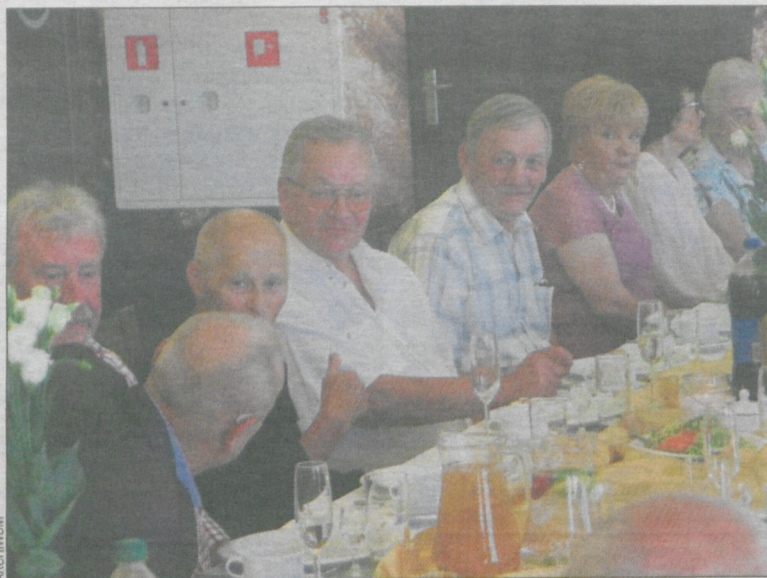
Koleadzy ze szkolnej ławy prowadzili ożywione rozmowy

Zarówno przed podaniem obiadu, jak i po posiłku, przy stole toczono