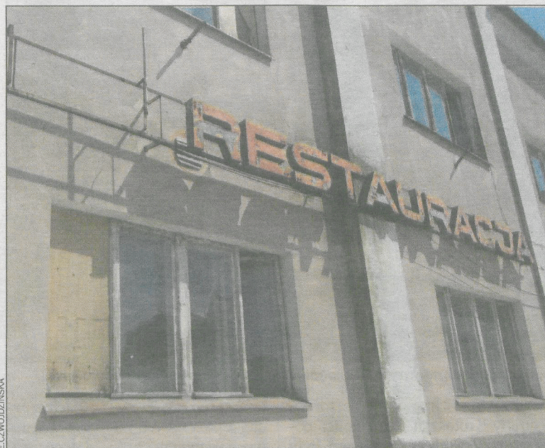
Budynek mieści się w Rynku i cały czas niszczeje

Opuszczony budynek niszczał z roku na rok, szpecąc kobyliński Rynek. Nie było pomysłu, co z nim zrobić. Radni poprzedniej kadencji