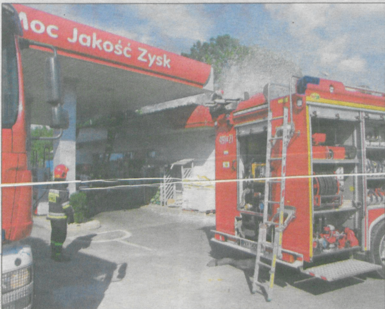
Płomienie polana pianą gaśniczą

Dyżurny stanowiska kierowania wysłał do zdarzenia trzy zastępy z Jednostki Ratowniczo-Gaśniczej oraz jeden zastęp z Ochotniczej Straży Pożarnej w Krotoszynie. W sumie uczestniczyło w nim 13 strażaków.