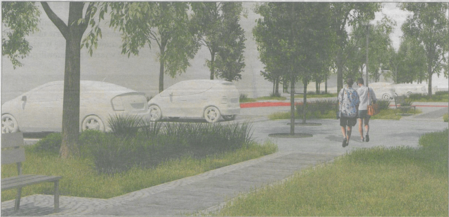
Tak ma wyglądać kameralny plac w obrębie alei Powstańców Wlkp. w Krotoszynie

go Jessica, teren dawnego browaru – poprzez rozbudowę Galerii Krotoszyńskiej i prawdopodobnie budowę McDonalds'a.