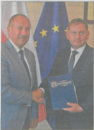
Umowę podpisali burmistrz Krotoszyna i prezes firmy Zbylbruk

– Jest to historyczna chwila. Wszyscy robią rewitalizację, ale w Krotoszynie rewitalizacja wykonywana jest w sposób kompleksowy – podkreślił wójt gminy. W ramach szerokiej inwestycji będzie też rewitalizowany szpital (rozbudowa obiektów przy ul. Mickiewicza) oraz, także przy pomocy funduszu unijne-