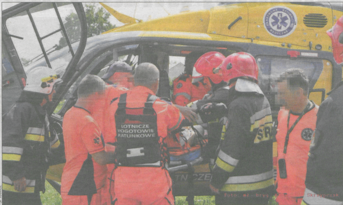
Śmigłowcem poleciał do szpitala w Ostrowie

Poważny wypadek w Konarach (pow. rawicki). 26 lipca pod koła samochodu ciężarowego wpadł 5-letni chłopiec ze Smolic. Z poważnymi urazami trafił do szpitala.