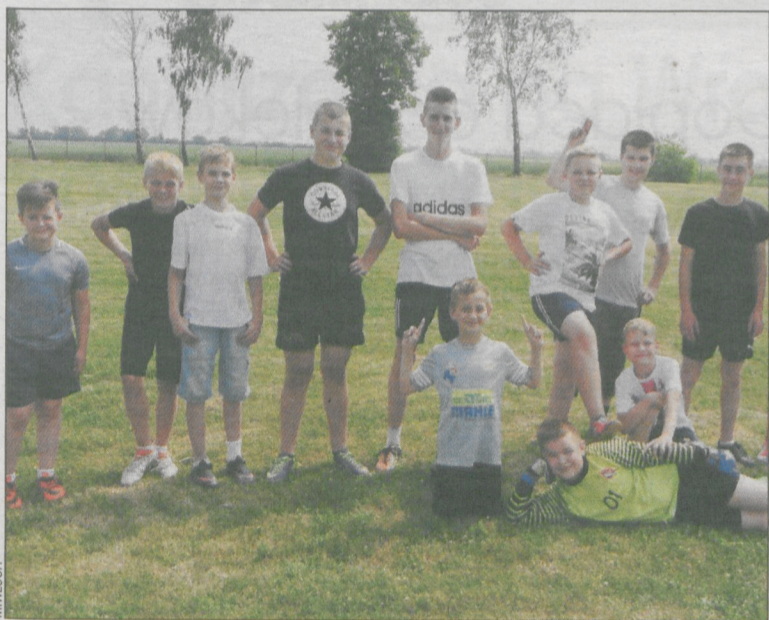
Młodsza drużyna uległa doświadczonej ekipie