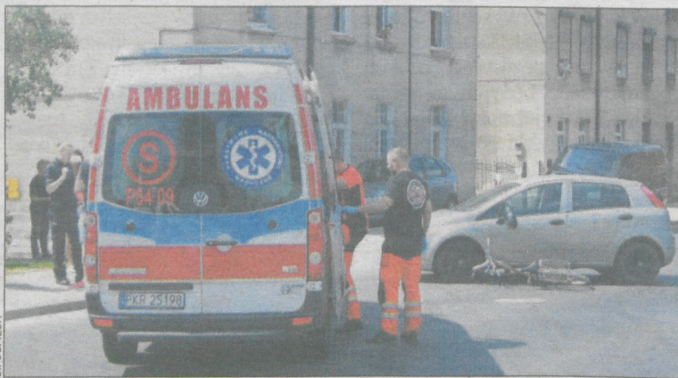
Karetka zabrała ją do szpitala na dalsze badania