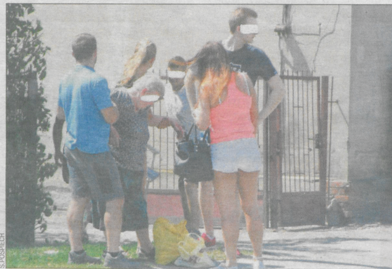
Rowerzystka była przytomna, ale oszołomiona

Po kilku minutach przyjechała karetka pogotowia. – Lekarz zbadał pacjentkę. Wykonano też medyczne czynności ratunkowe na miejscu –