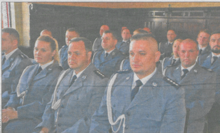
Nagrody dla najlepszych dzielnicowych