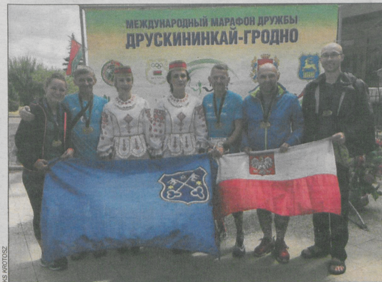
Uczestnicy biegu z jego organizatorami