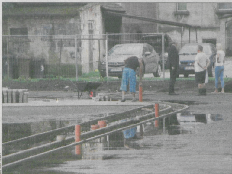
Na miejsce po ustaniu opadów udał się zastępca starosty krotoszyńskiego