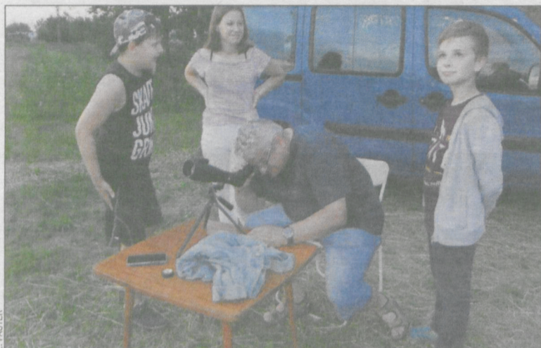
Uczestnicy spotkania skorzystali z rzadkiej okazji przyjrzenia się zjawisku

Kilkadziesiąt osób zebrało się w 27 lipca wieczorem w Rozdrażewie, by podziwiać całkowite zaćmienie Księżyca.