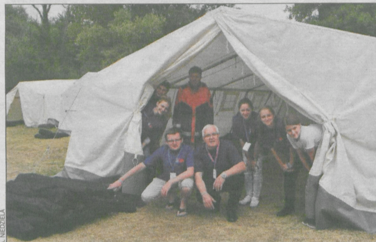
Pod tymi namiotami ustawiono łóżka polowe

W drugim dniu obozu odwiedzono park rozrywki w miejscowości Hasloch, gdzie obozowicze korzystały z licznych atrakcji, m.in. wieży swobodnego spadania, a także rollerco-