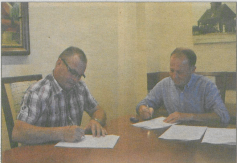
Burmistrz Dębicki podpisuje umowę z szefem firmy Kasprzak