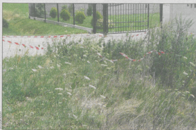
Roślinę szybko wycięto