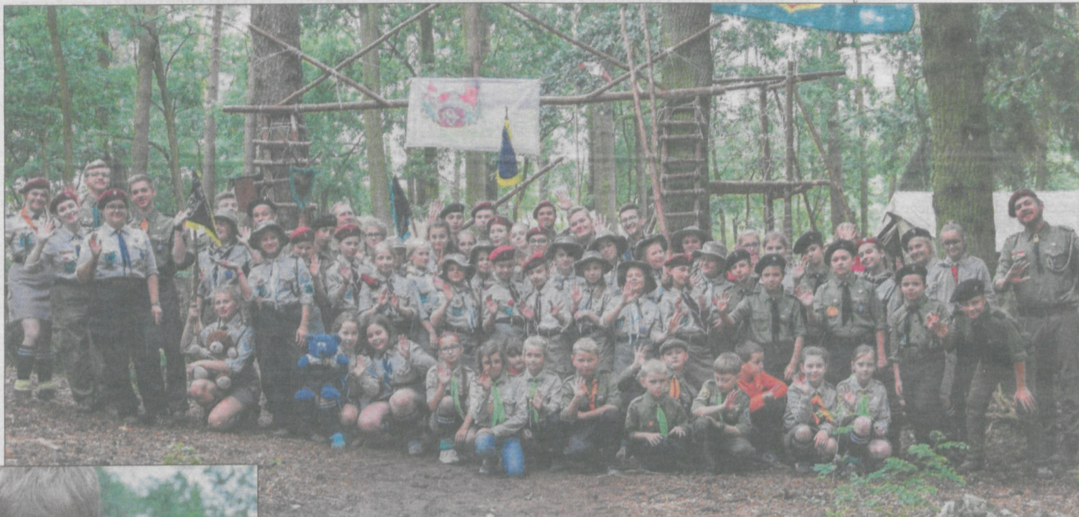
Dwa tygodnie spędzili nad jeziorem k. Wagrowca