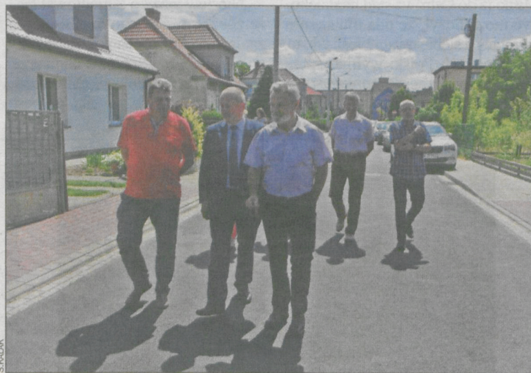
W odbiorze ulicy wzięli udział mieszkańcy, radni, władze miasta i wykonawcy

Ulica Sowińskiego w Krotoszynie ma nowy asfalt. 24 lipca oficjalnie odebrano ją po modernizacji.