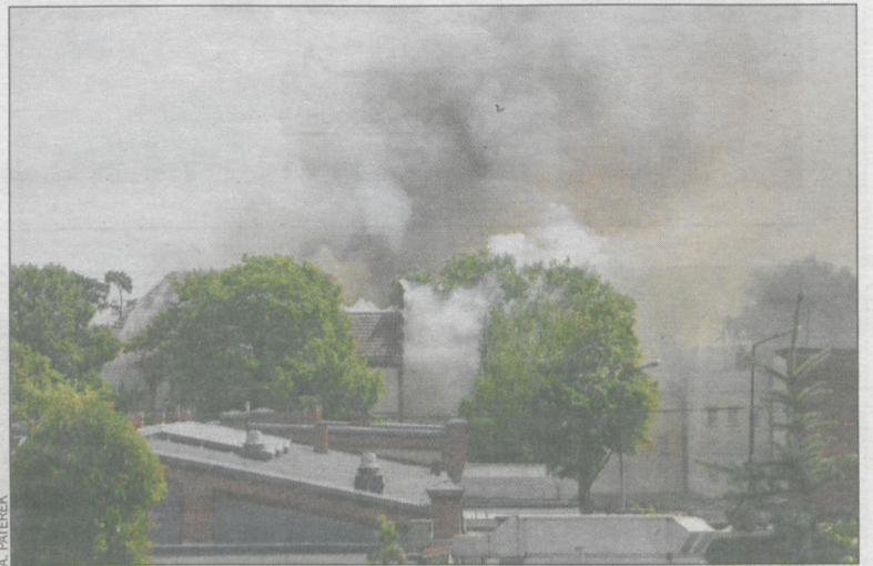
Silny wiatr nie ułatwiał akcji gaśniczej

Taką hipotezę przedstawia biegły z dziedziny pożarnictwa, który został powołany do zbadania przyczyny pożaru budynku szkoły muzycznej w Krotoszynie.