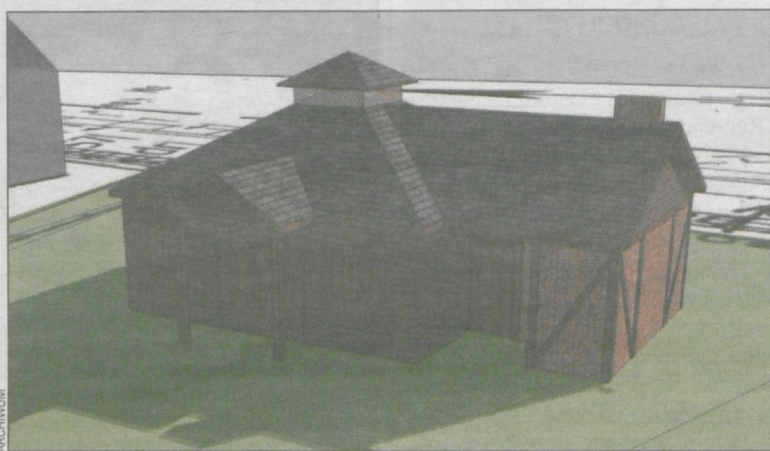
Budynek będzie miał wymiary 11 x 8 m. To coś więcej niż tzw. grzybek

W zeszłym roku urzędnicy wyliczyli, że inwestycja będzie kosztowała ok. 150 tys. zł. Niestety, rzeczywistość zweryfikowała plany. Do pierwszego przetargu przystąpiła jedna firma, proponując wykonanie robót za 227 tys. zł, co było kwotą aż o 90 tys. zł wyższą niż zabezpieczona przez gminę w budżecie. Przetarg unieważniono. Mieszkańcy byli zmartwieni. Sołtys Stanisław Andrzejak nie krył rozczarowania i za-