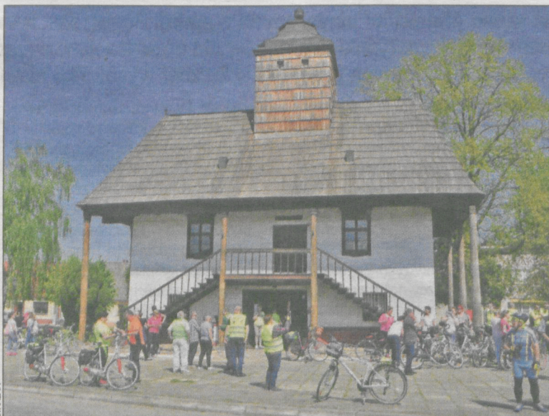
Zabytkowy ratusz – najbardziej charakterystyczny obiekt w Sulmierzycach

Dach jest kryty gontem i wymaga odmalowania. – Zakres prac obej-