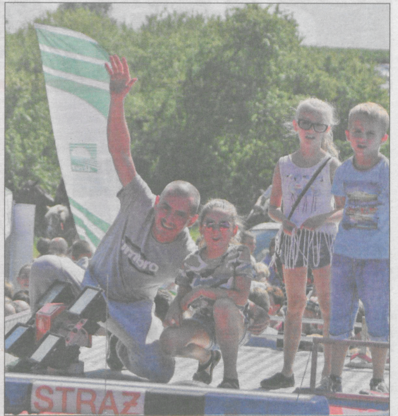
Zabawa trwała aż do wieczora