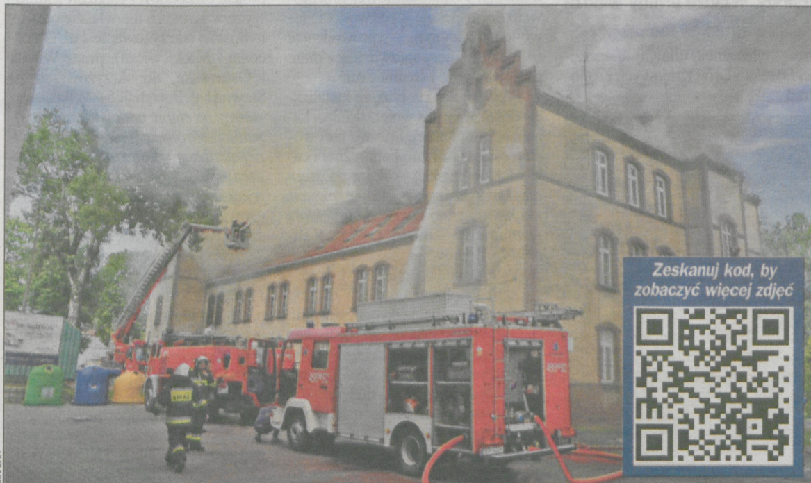
Z pożarem walczyło 14 zastępów strażackich