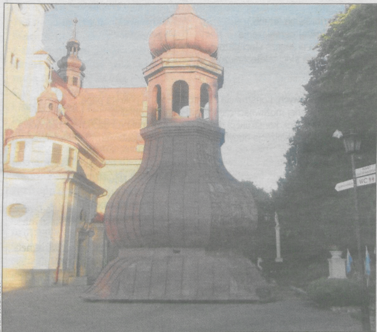
Kopuła zostanie pokryta miedzianą blachą

1 lipca br. rozpoczęły się przygotowania do remontu najwyższej wieży kościoła. Trzeba było zdjąć kopułę i położyć ją na ziemi. By zapobiec uszkodzeniom, plac przy kościele wyłożono betonowymi płytami. Prace poprzedziła wspólna modlitwa budowlanców i parafian. Widowiskowe roboty ściągnęły pod kościół mieszkańców Smolic i przejezdnych, obserwujących perfekcyjne działania operatorów maszyn.