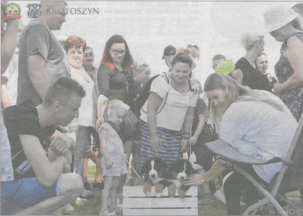
Szczeniaki cieszyły się wielkim zainteresowaniem zwiedzających