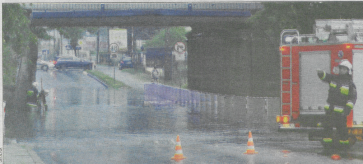
Woda zbiera się w nieszczęśliwym miejscu pod wiaduktem

strony właściciela ulicy, tj. Generalnej Dyrekcji Dróg Krajowych i Autostrad.