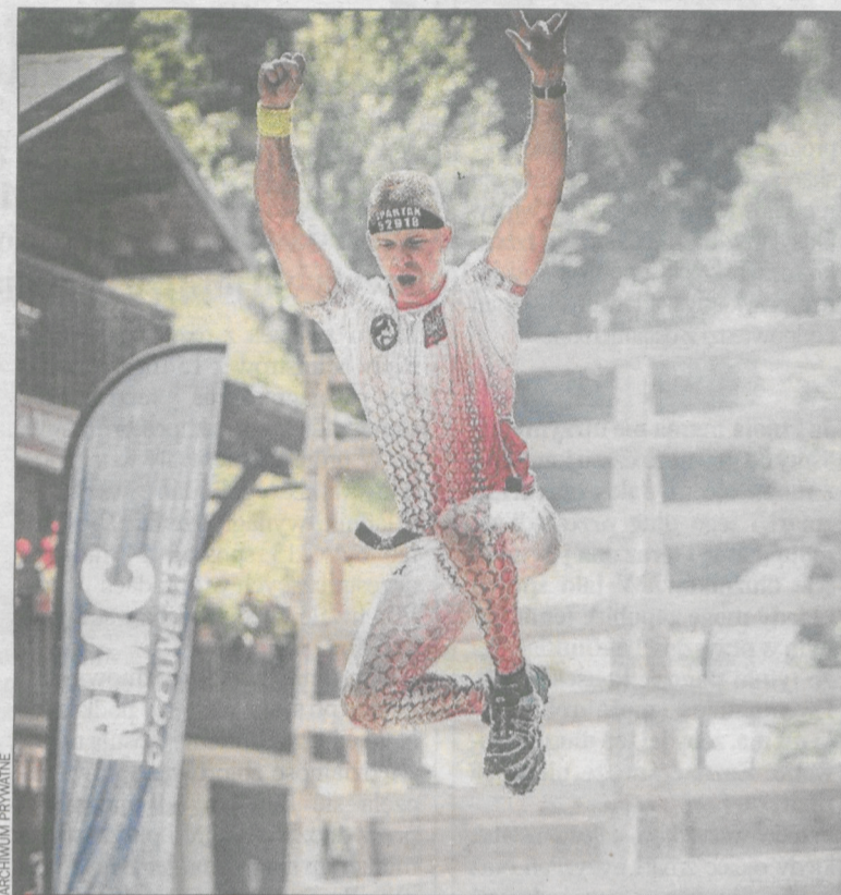
Przeszkód było ponad 30

Był to najcięższy „spartan race”, w jakim brałem udział. Wiedziałem, że będzie ciężko. W końcu to mistrzostwa Europy, a ludzie biorący udział w wyścigu to czołowi zawodnicy. Byłem bardzo dobrze przygotowany, o czym świadczy rezultat, z którego jestem bardzo zadowolony. Bieg ukończyłem bez żadnych problemów, wszystkie przeszkody pokonałem, a zarazem uniknąłem kar. Ciężko pracowałem na ten sukces, moje marzenia się spełniły. Teraz, gdy emocje opadły, wiem, że warto było.