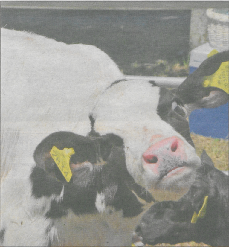
Nie mogło zabraknąć i krów