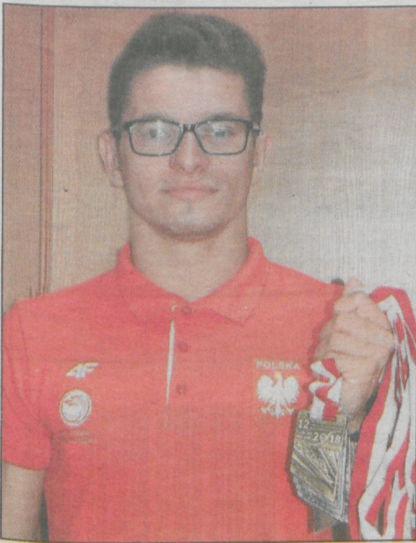
Powroźnik prezentuje medale