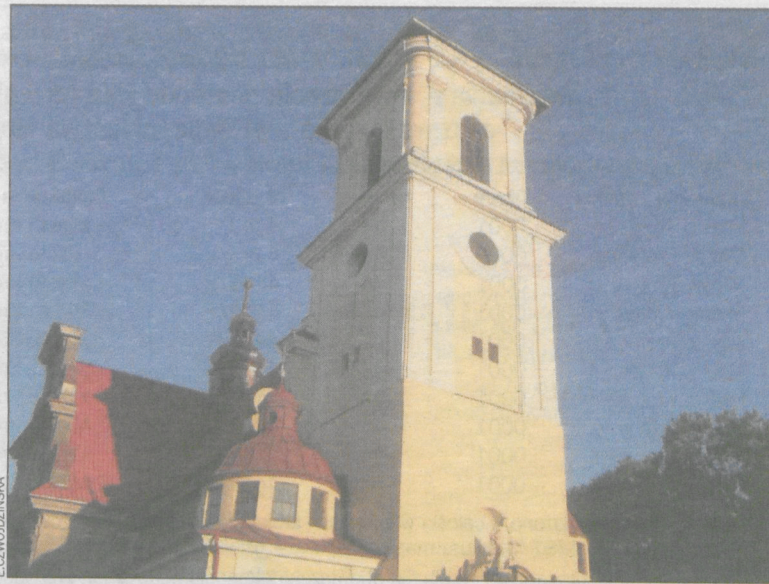
Remont w kościele trwa od 5 lat