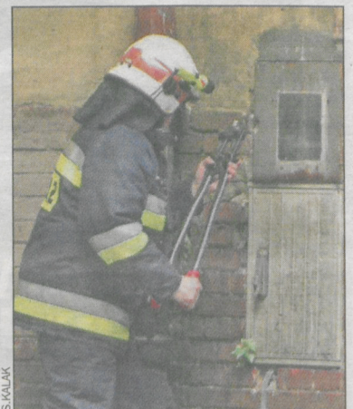
Otwieranie skrzynek z zasilaniem

Wszelkie wnioski i pisma adresowane do PCPR można składać w punkcie podawczym Starostwa Powiatowego w Krotoszynie przy ul. 56 Pułku Piechoty Wlkp. 10 – budynek główny (parter, przy wejściu).