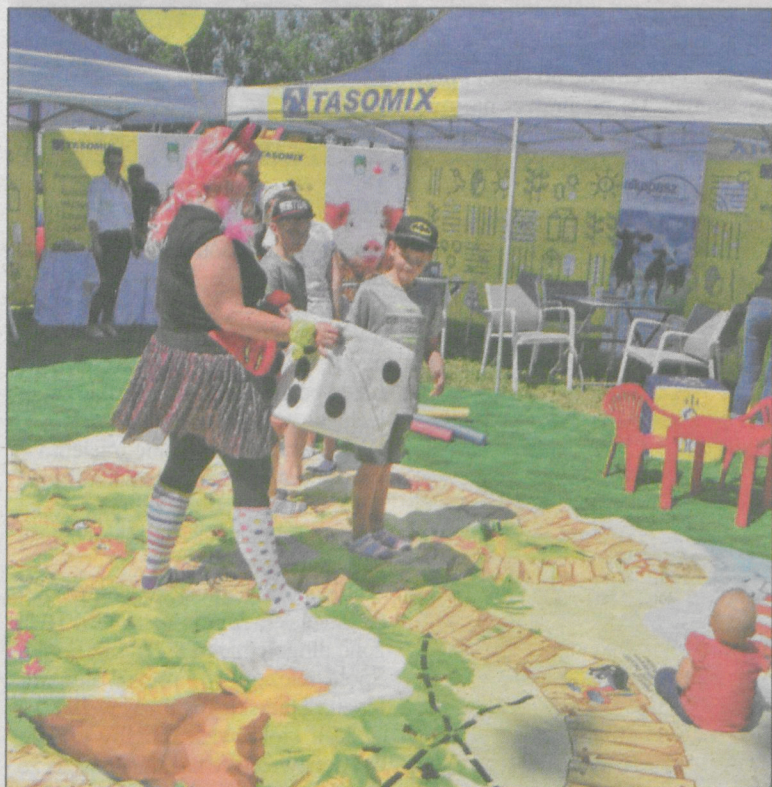
Dla najmłodszych nie brakowało atrakcji