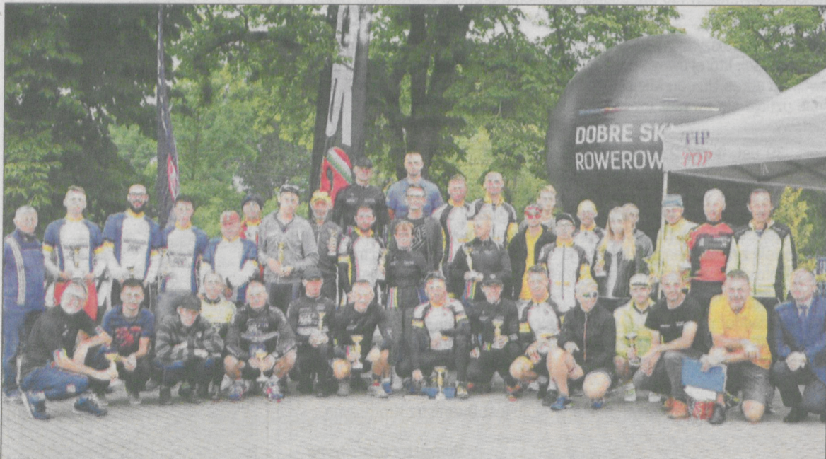
Wspólne zdjęcie kolarzy z czasówki w Strzyżewie

Kolarze z Krotoszyna wystartowali w czasówce pod Ostrowem oraz kolejnym supermaratonie szosowym tym razem w wielkopolskim Nietążkowie.