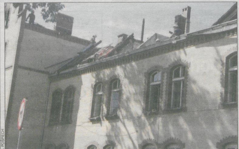
Zrzucanie spalonych elementów dachu