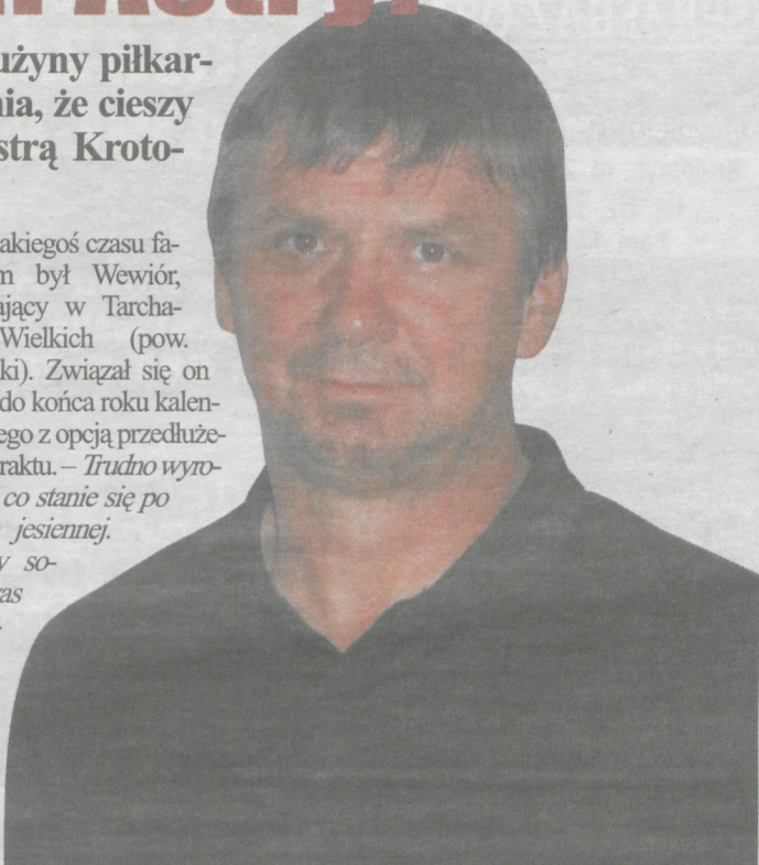
– Zaczynam budowę zespołu – mówi szkoleniowiec