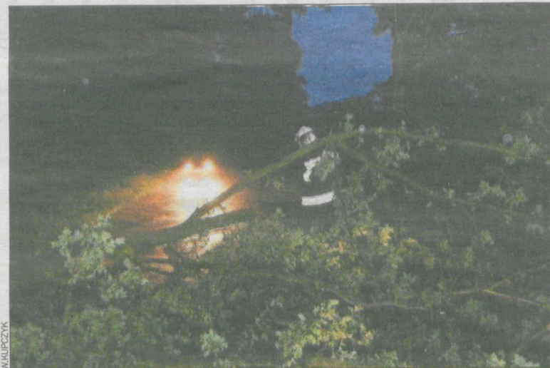
Powalone na jezdnię drzewo w gm. Kobylin

Usuwanie skutków burzy strażacy zakończyli przed północą. W działaniach brało udział łącznie 17 zastępów. (popi)