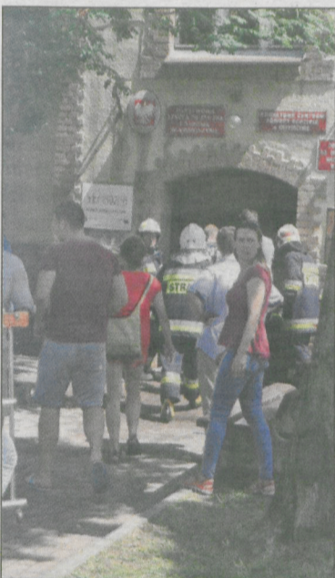
Trwa ratowanie dobytku

W budynku mieści się Państwowa Szkoła Muzyczna I stopnia, Powiatowe Centrum Pomocy Rodzinie, Warsztaty Terapii Zajęciowej i Komenda Hufca ZHP. Mimo szybkiej akcji gaśniczej spłonęło ok. 1.600 m kw. pokrycia dachowego i konstrukcji z drewna. W środku nikt nie przebywał.