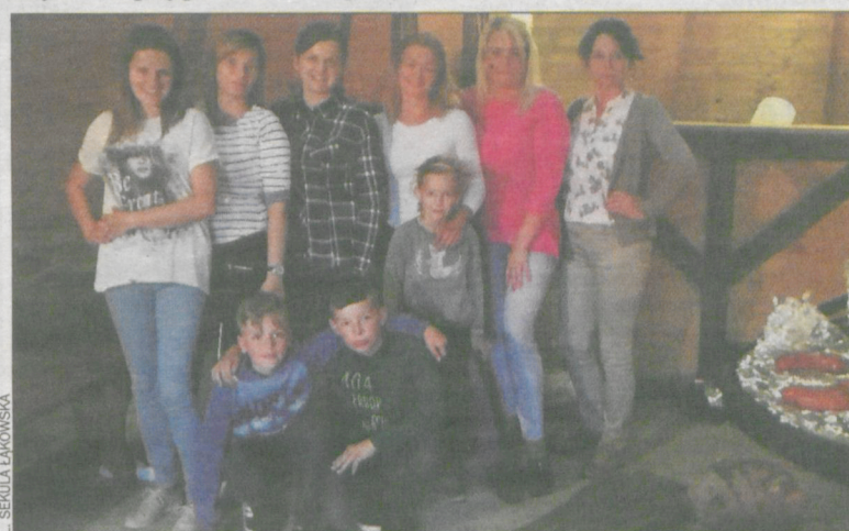
Nie zabrakło pamiątkowych zdjęć