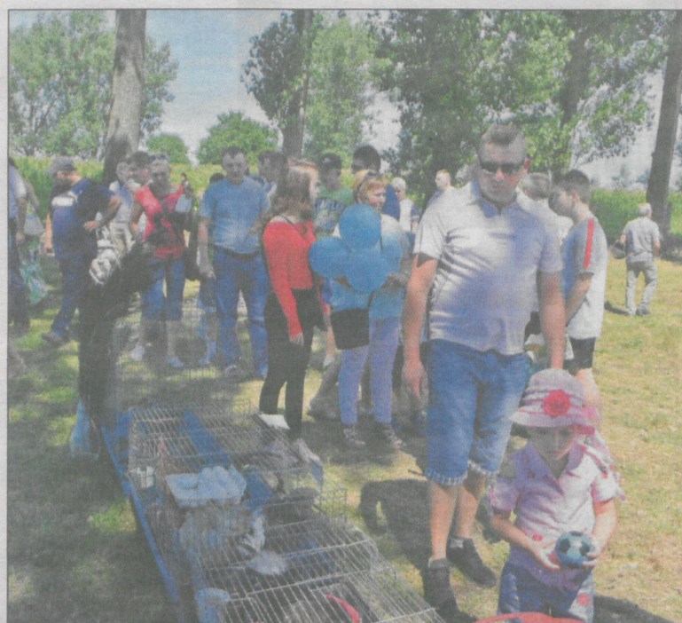
Przybyło wielu wystawców zwierząt domowych