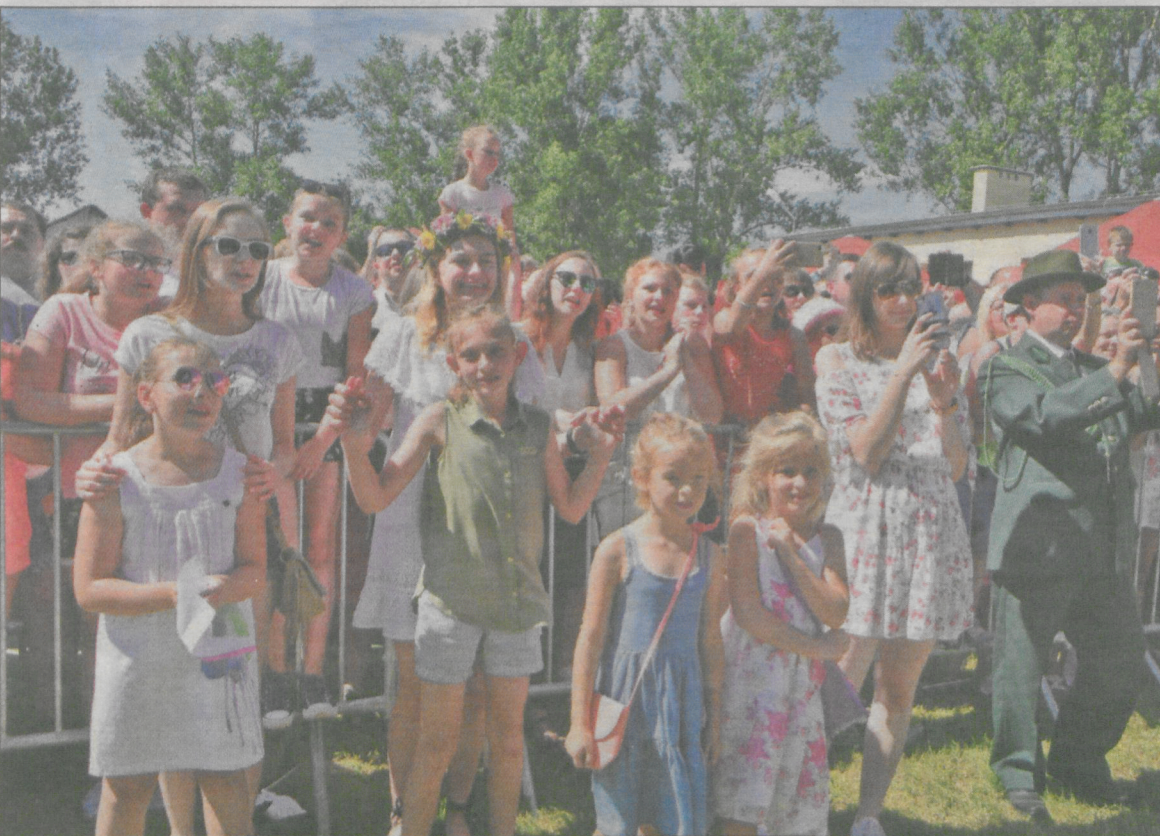
Tańczyli i śpiewali razem z zespołem