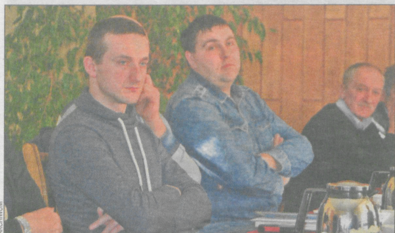
Radni gminni przyjęli zmiany budżetowe