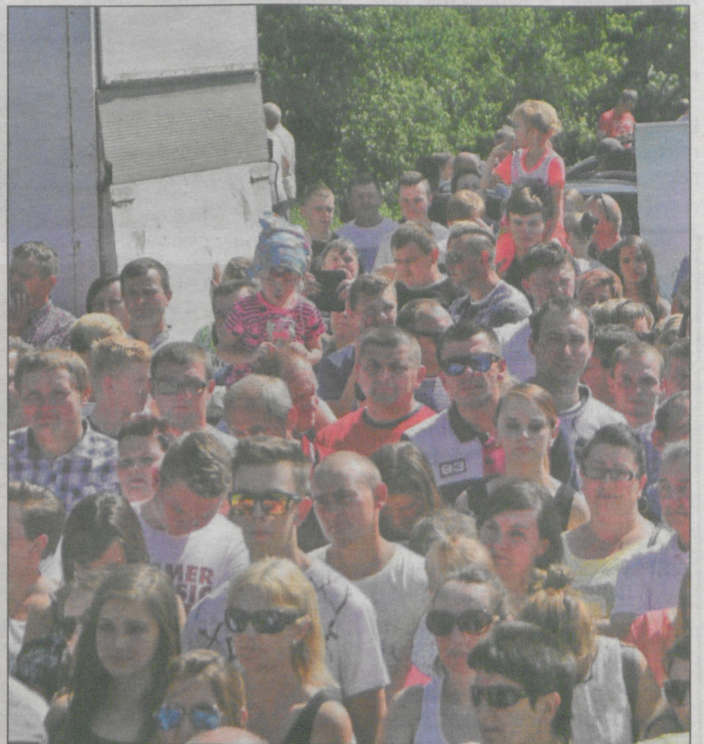
Dopisała pogoda, więc i dopisali ludzie