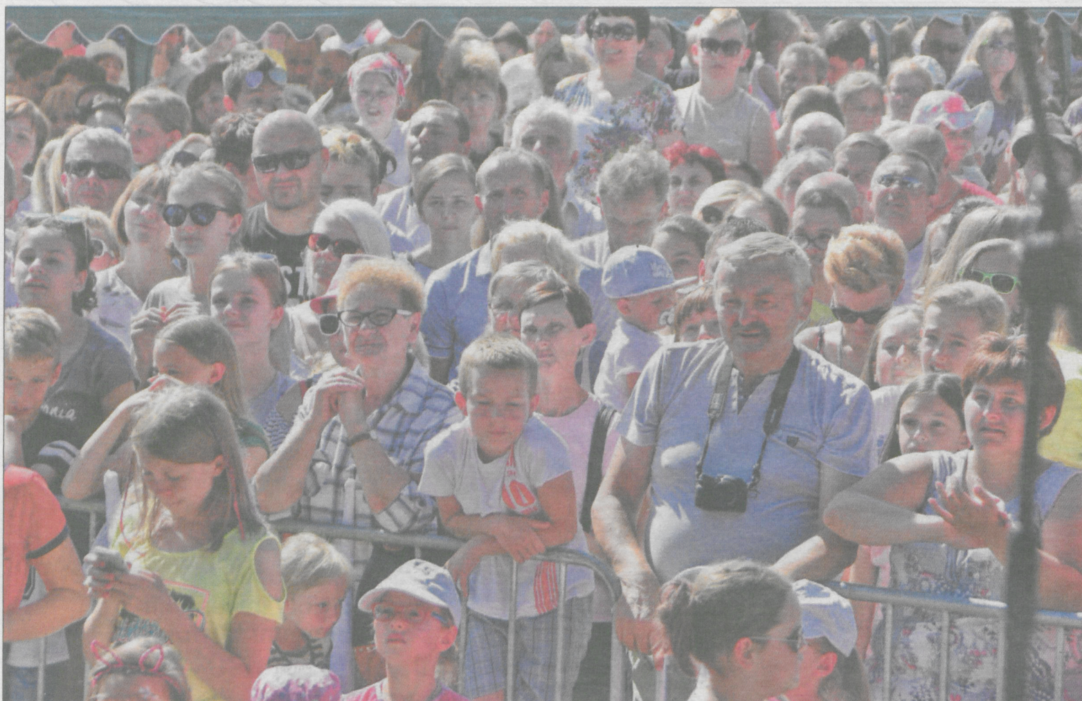
Pod sceną na koncercie Piękných i Młodych zgromadziły się tłumy