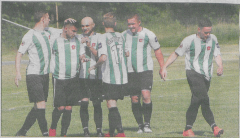
Zawodnicy z Kobyłina podczas meczu z Olimpią Brzeziny