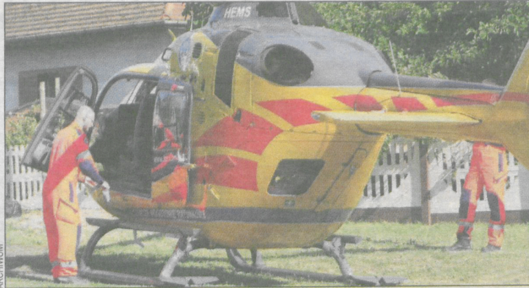
Śmigłowiec medyczny często przylatuje do Krotoszyna

Zduny. Urząd miejski informuje o przeznaczonych do wydzierżawienia nieruchomościach w Konarzewie i Zdunach. STOP.