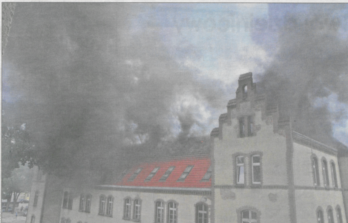
Dym z nad budynku rozprzestrzenił się na dużą część miasta

14 zastępów straży pożarnej i 2 samochody z podnośnikami gasiły potężny pożar budynku przy ul. Młyńskiej w Krotoszynie, który wybuchł 14 lipca o godz. 11.00. W obiekcie spalił się dach i górne kondygnacje.