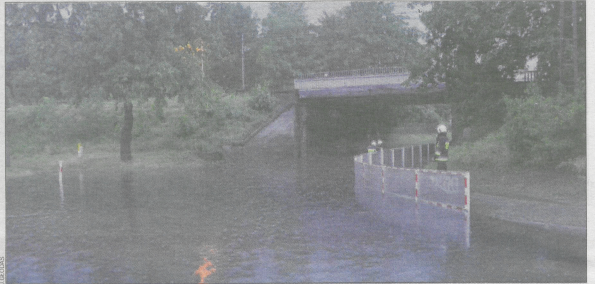
Pod wiaduktem na Kobylińskiej znowu zrobiło się jeziorko

11 lipca, w wyniku intensywnych popołudniowo-wieczornych opadów deszczu i silnych podmuchów wiatru, strażacy z powiatu krotoszyńskiego interweniowali 11 razy.