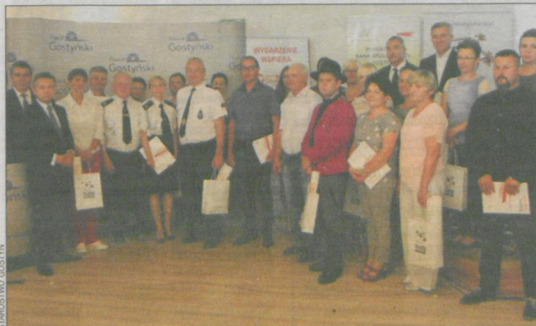
Forum Organizacji Pozarządowych Powiatu Gostyńskiego jest okazją do nagrodzenia najaktywniejszych osób i grup