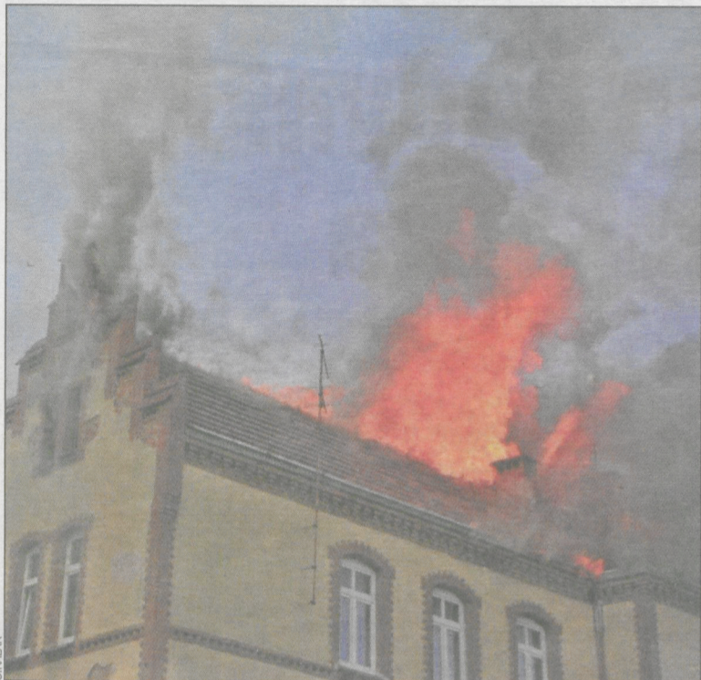
Ogień strawił m.in. dokumenty i pamiątki harcerskie