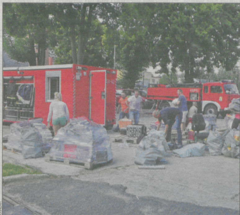
Kto mógł, pomagał w wynoszeniu dokumentów i sprzętów