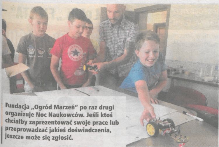
Fundacja „Ogród Marzeń” po raz drugi organizuje Noc Naukowców. Jeśli ktoś chciałby zaprezentować swoje prace lub przeprowadzić jakieś doświadczenia, jeszcze może się zgłosić.