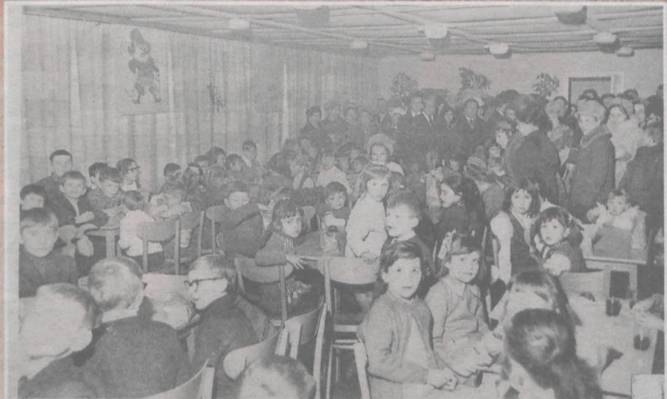
Zimowa impreza dla dzieci działkowców