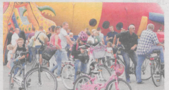
Jedną z atrakcji festynu były dmuchane zamki