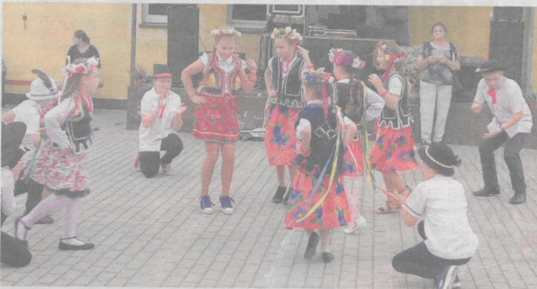
Młodzi artyści podbili serca publiczności