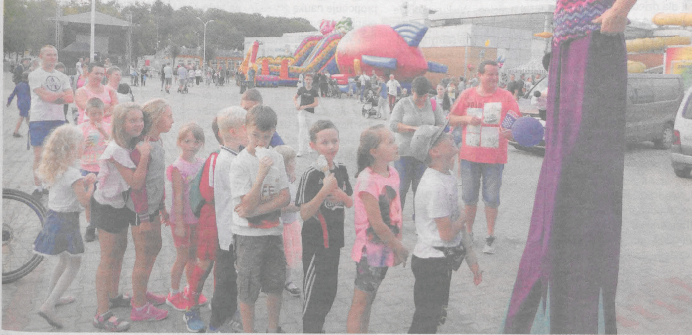
Zabawy dla dzieci prowadzili animatorzy