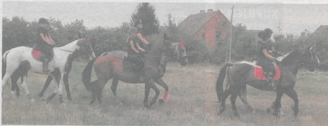
Na koniach członkowie szkółki jeździeckiej z Racendowa

Przed gośćmi zaprezentowała się także szkółka jeździecka z Racendowa. Dożynki zorganizowała Rada Sołecka Wysogotówka.