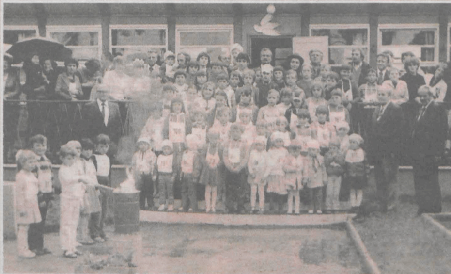
Dzień Dziecka na ogródkach działkowych