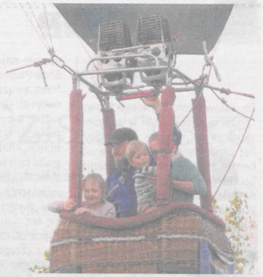
Lot balonem należało uwiecznić za pomocą telefonu komórkowego