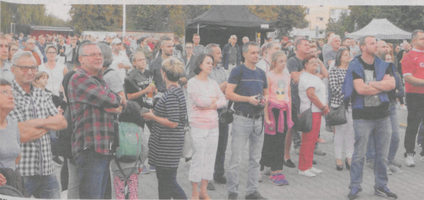
Młode dziewczyny zgromadziły na widowni całkiem pokaźną publiczność