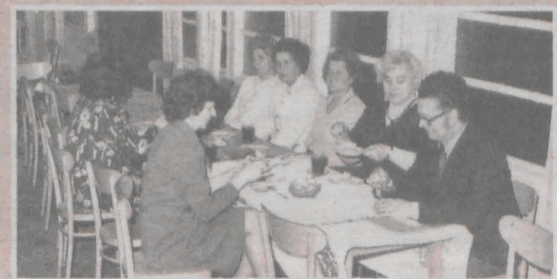
Komisja Kobiet przy pracy