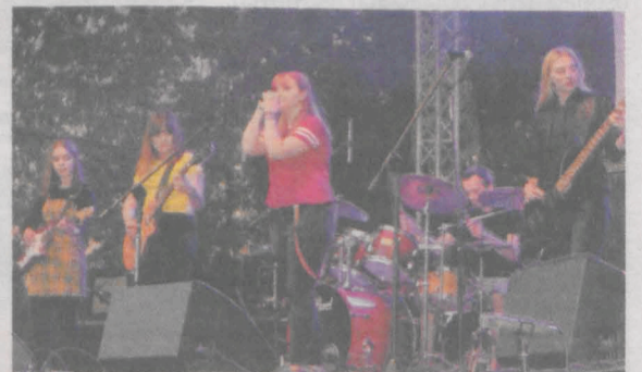
Supportem dla gwiazdy był występ „Ostatniej Szansy”