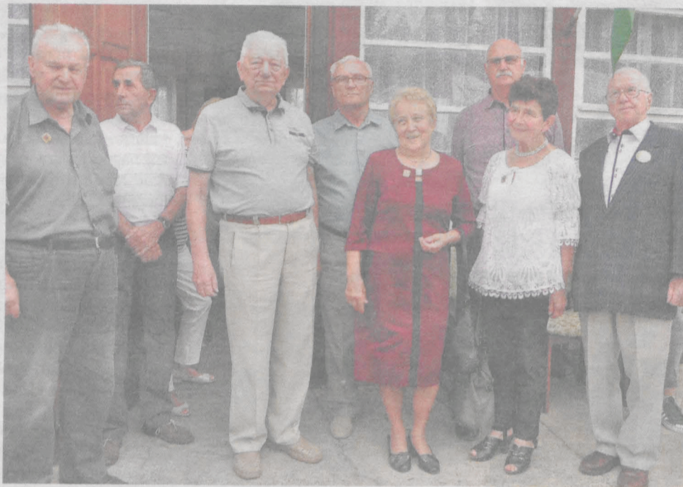
Najstarszych stażem działkowców uhonorowano specjalnymi odznaczeniami