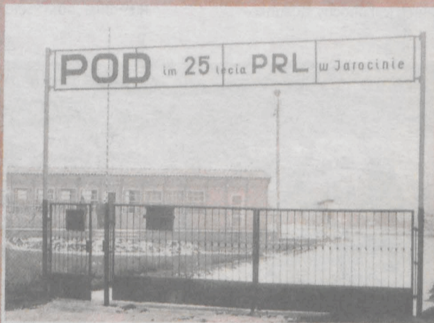
Widok na świetlicę i bramę od obecnej ul. Św. Ducha