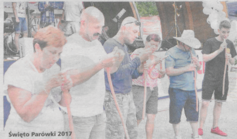
Święto Parówki 2017