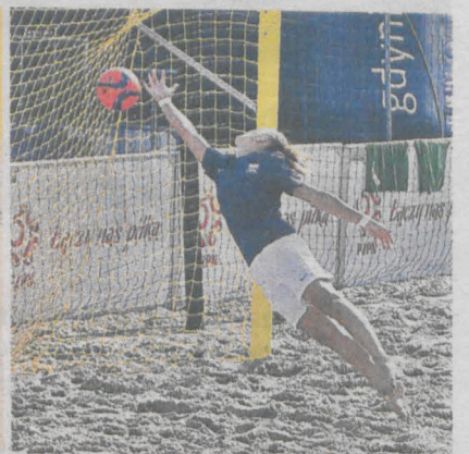
- Może się wydawać, że akurat ta piłka wpadła, ale dobrze pamiętam, że do niej doskoczyłam - opowiada bramkarka z Wolicy Nowej