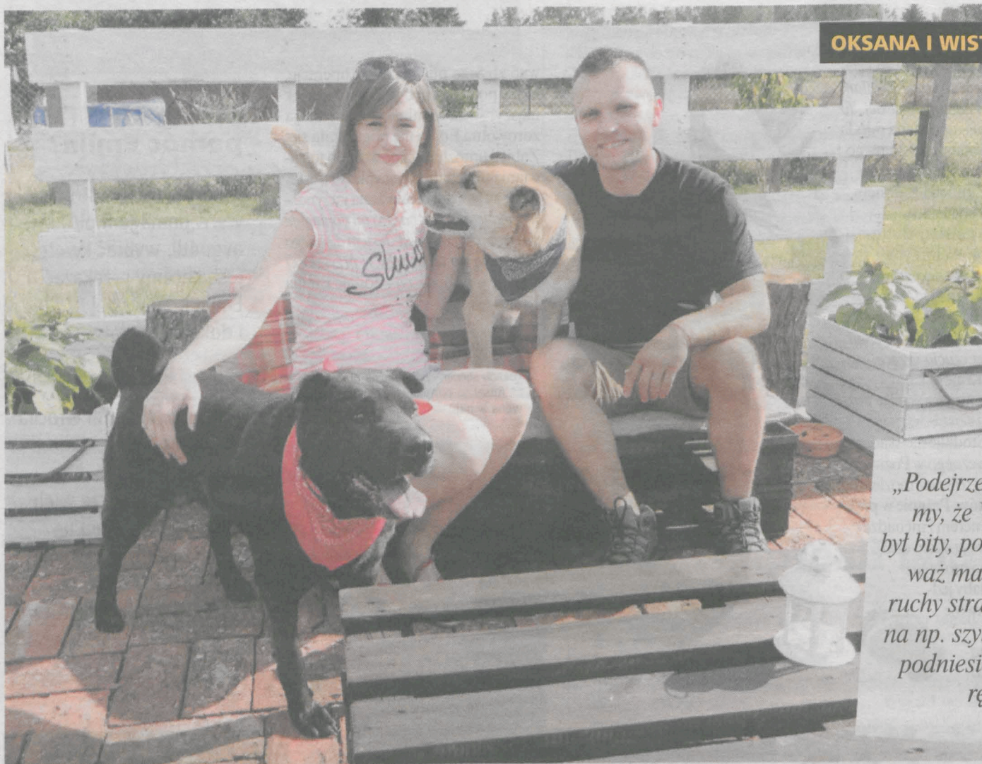
OKSANA I WIST

► Czego mają w Schronisku dla Zwierząt w Radlinie za mało? Adopcji. Żadna taka placówka, nawet najlepiej wyposażona i z górą najlepszej jakościowo karmy, nie zastąpi psu czy kotu ciepła domowego. Do podrzucania lub porzucania zwierząt dochodzi najczęściej w wakacje i przed świętami Bożego Narodzenia.