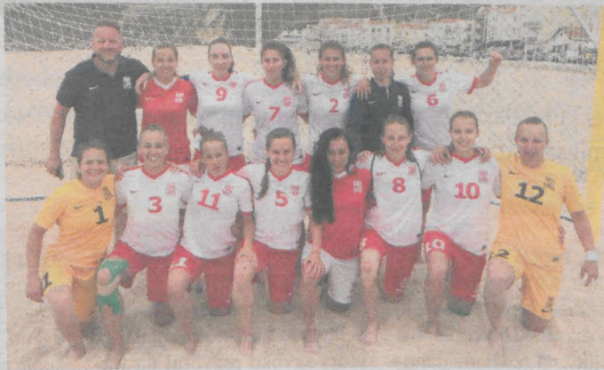
Po zdobyciu Mistrzostwa Polski w beach soccerze z całą drużyną