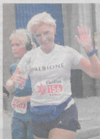
Dotarcie do mety RockRunu wzbudza ogromną radość