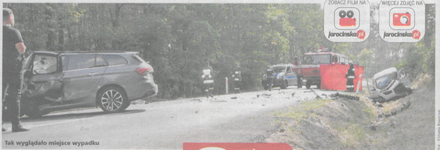
Tak wyglądało miejsce wypadku

▶ - Mówił, że zrobiło mu się ciemno przed oczami - tak o sprawcy środowego wypadku opowiadał jeden z ratowników pracujących na miejscu tragedii. 41-letni kierowca citroena berlingo stracił życie po tym, jak uderzył w niego jadący fiatem tipo. Na tym feralnym odcinku drogi wojewódzkiej za Suchą w ostatnim czasie zginęły już trzy osoby.