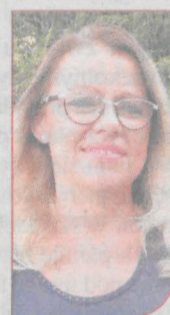
Fot. Anna Koprzas-Fijolek