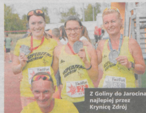
Z Golicy do Jarocina najlepiej przez Krynicy Zdrój