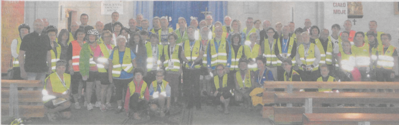
Fot. Lidia Sokowicz