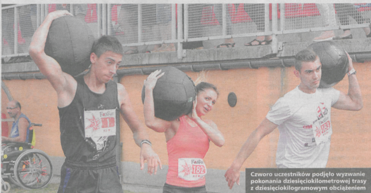
Czwooro uczestników podjęło wyzwanie pokonania dziesięciokilometrowej trasy z dziesięciokilogramowym obciążeniem