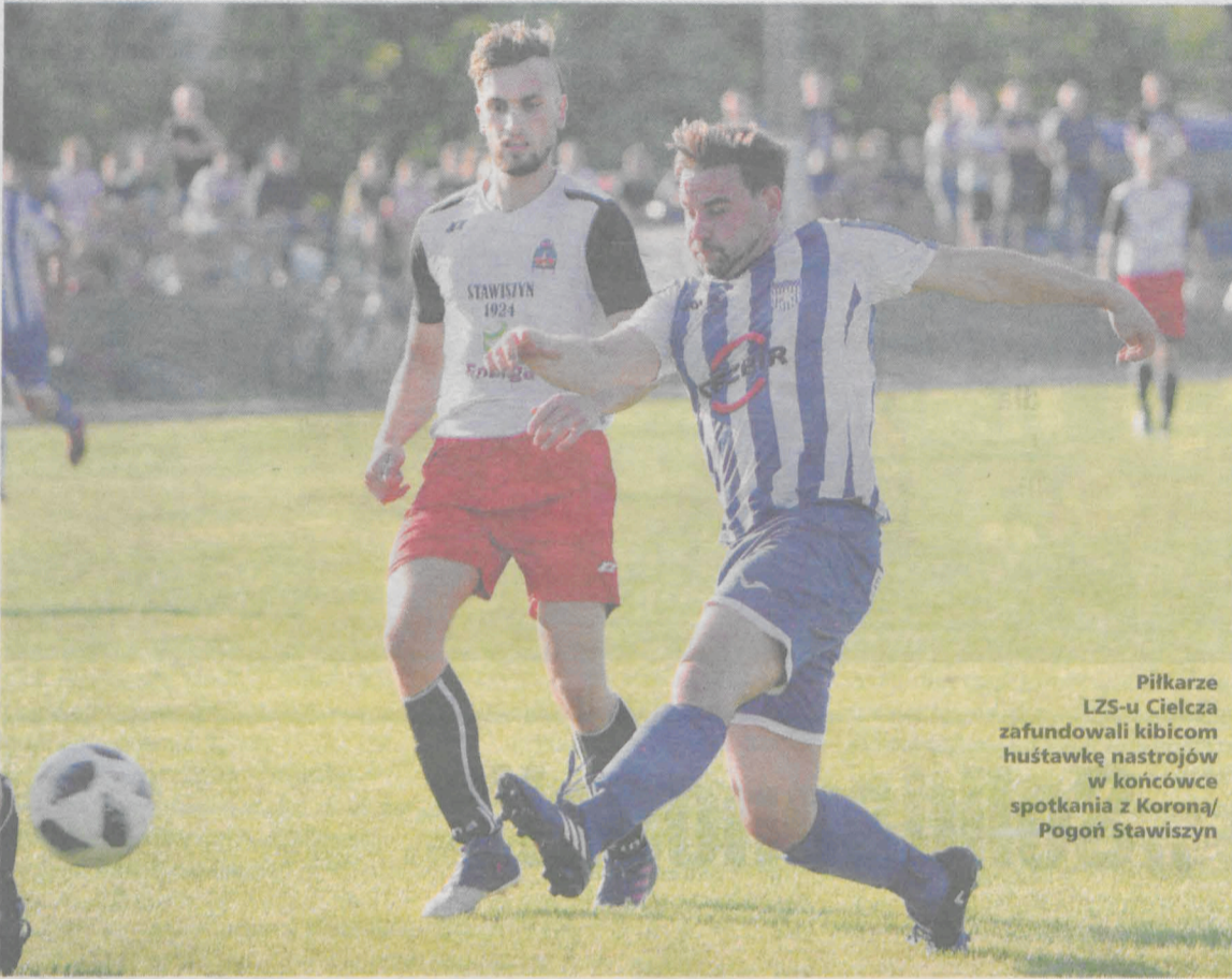
Piłkarze LZS-u Cielcza zafundowali kibicom huśtawkę nastrojów w końcówce spotkania z Koroną/Pogoń Stawiszyn

Trzy zwycięstwa w czterech meczach zanotowały zespoły występujące w klasie okręgowej. Udany debiut przed własną publicznością w B Klasie zanotowali piłkarze GKS-u Jaraczewo. Zawiedli za to zawodnicy Gromu Golina, którzy na własne życzenie przegrali pierwszy mecz w sezonie.