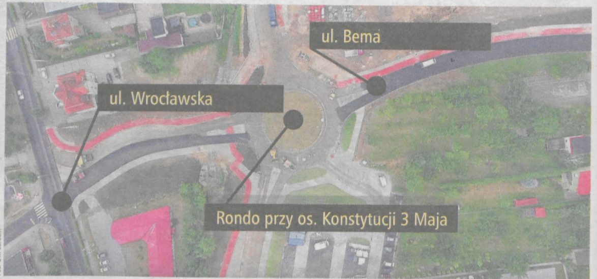
Jedno z rond nowego łącznika - przy osiedlu Konstytucji 3 Maja

Najpóźniej do połowy października powinny być gotowe obydwa odcinki łącznika, który przetnie centrum Jarocina i połączy miasto z nową obwodnicą. Oddanie do użytku dużego ronda, mającego połączyć nie tylko te nowe ulice, ale i trzy inne - Śródmiejską, Hallera i Wojska Polskiego, planowane jest jednak dopiero w przyszłym roku.