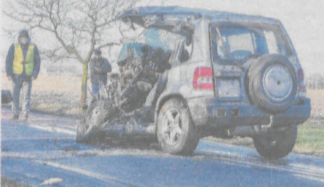
W zderzeniu mitsubishi pajero z wojskowym honkerem zginął 25-latek