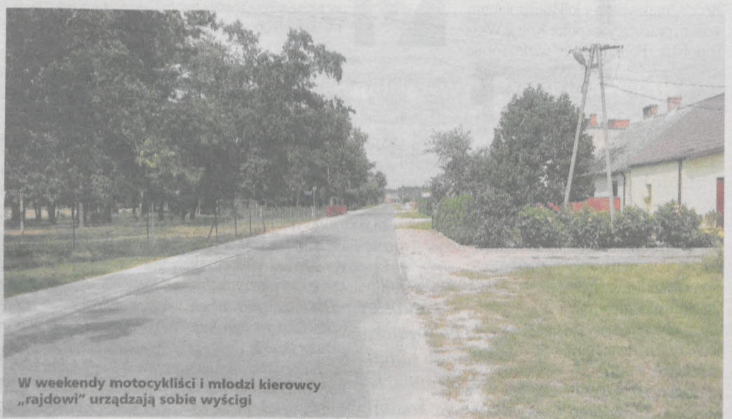
W weekendy motocykliści i młodzi kierowcy „rajdowi” urządzają sobie wyścigi