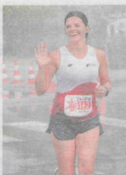
Uczestnicy pozdrawiali dopingujących kibiców