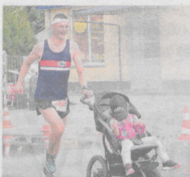
Biegacze chętnie korzystali z ustawionych na trasie „kurtyn wodnych”