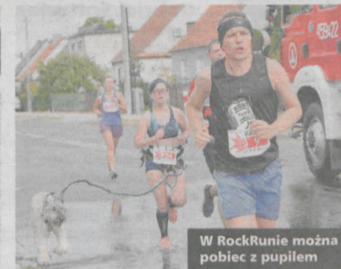
W RockRunie można pobiec z pupilem