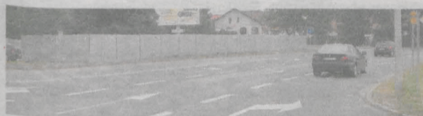
Za płotem trwa budowa ronda