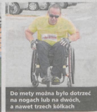
Do mety można było dotrzeć na nogach lub na dwóch, a nawet trzech kółkach