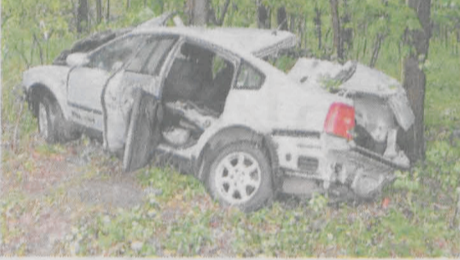
20-latkę straciła życie po zderzeniu volkswagena passata z land roverem