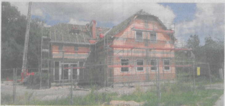
Biblioteka w trakcie budowy