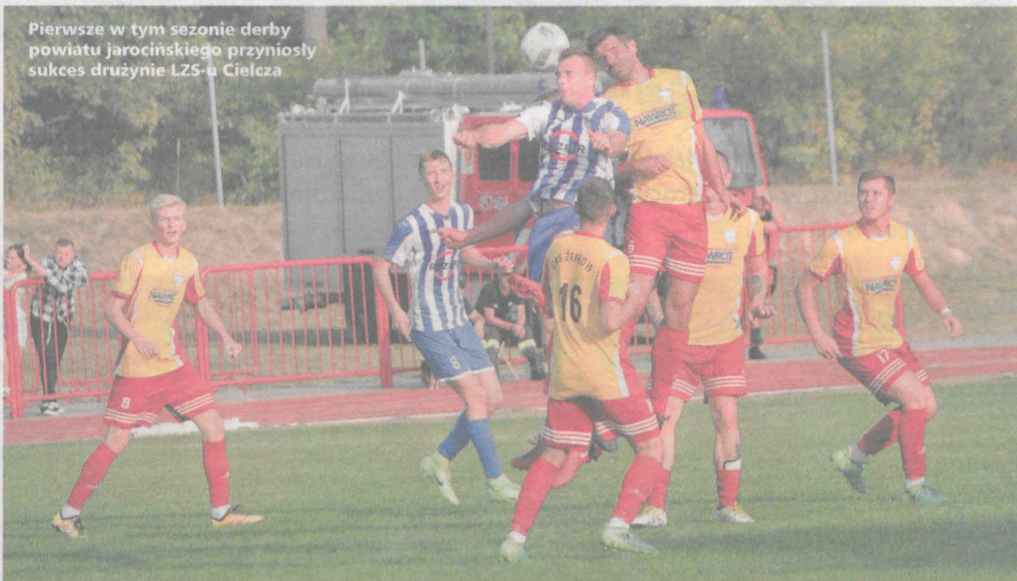
Pierwsze w tym sezonie derby powiatu jarocińskiego przyniosły sukces drużynie LZS-u Cielcza