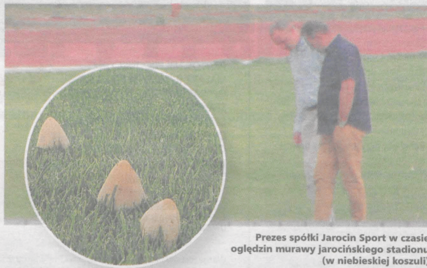
Prezes spółki Jarocin Sport w czasie oględzin murawy jarocińskiego stadionu (w niebieskiej koszuli)