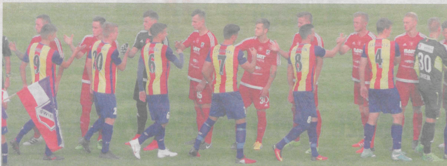
Tym razem piłkarze Jaroty wrócili ze Świecia z jednym punktem