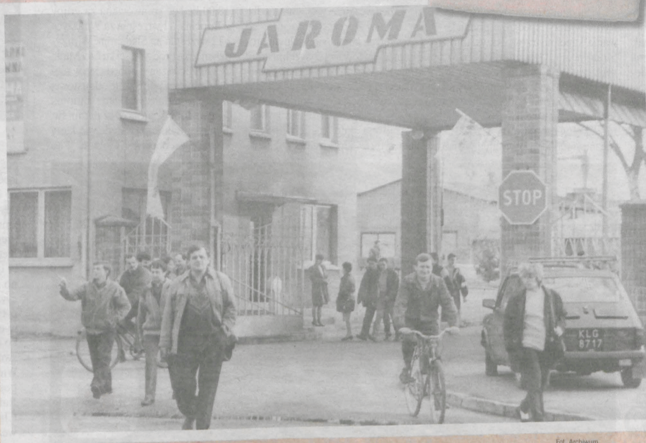
Jaroma, rok 1994

Prawie rok po pamiętnych wydarzeniach Sierpnia '80, w wyniku narastającego niezadowolenia związanego z pogarszającym się stanem zaopatrzenia jarocińskiego rynku lokalnego w artykuły żywnościowe oraz w tak deficytowy produkt, jakim były papierosy, 24 czerwca 1981 r. w Jarocińskich Zakładach Przemysłu Maszynowego Leśnictwa „Jaroma” ostrzegawczo przerwało pracę 30 pracowników działu mechanicznego. Cały dział liczył wtedy 100 osób.