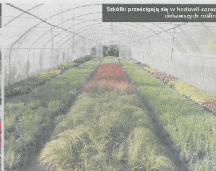
Szkółki prześcigają się w hodowli coraz ciekawszych roślin