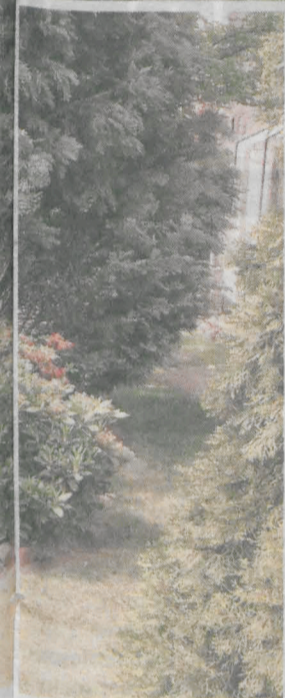
- Wszystko na swoje potrzeby, by nie kupować. Mamy altankę oraz w części ozdobnej zasianą trawę, by po pracy przysiąść sobie i odpocząć - tłumaczy Maciej Ekert