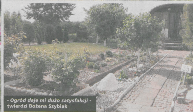
- Ogród daje mi dużo satysfakcji - twierdzi Bożena Szybiak