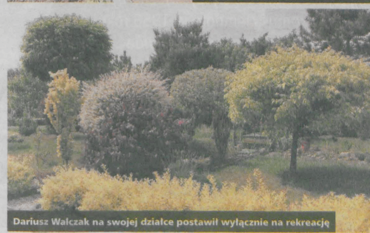
Dariusz Walczak na swojej działce postawił wyłącznie na rekreację