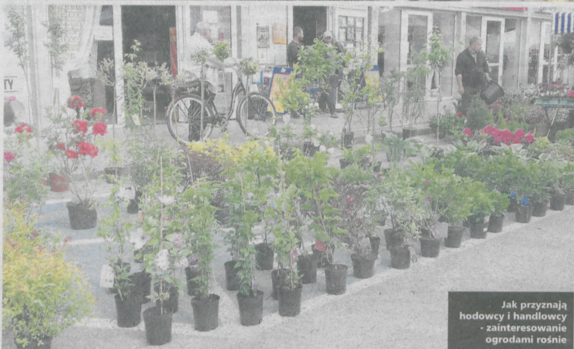
Jak przyznają hodowcy i handlowcy - zainteresowanie ogrodami rośnie