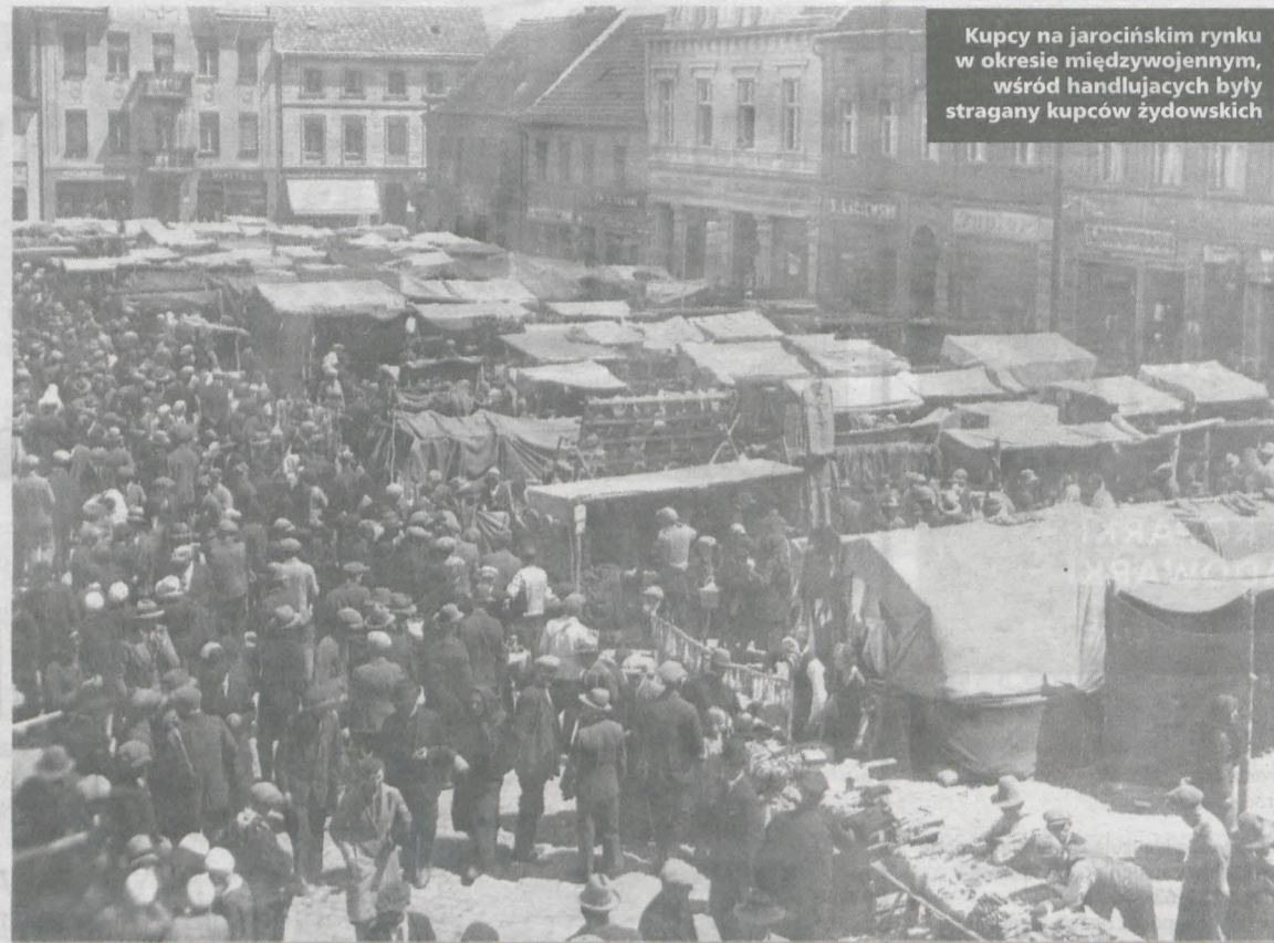
Kupcy na jarocińskim rynku w okresie międzywojennym, wśród handlujących były stragany kupców żydowskich

W JAROCINIE BOJÓWKI ATAKOWAŁY ŻYDOWSKIE SKLEPY, REDAKTORZY NAWOŁYWALI DO PRZEŚLADOWAŃ