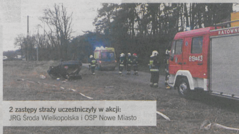
2 zastępy straży uczestniczyły w akcji: JRG Środa Wielkopolska i OSP Nowe Miasto

2,7 promila alkoholu miał w organizmie 44-latek kierujący oplem vectra.