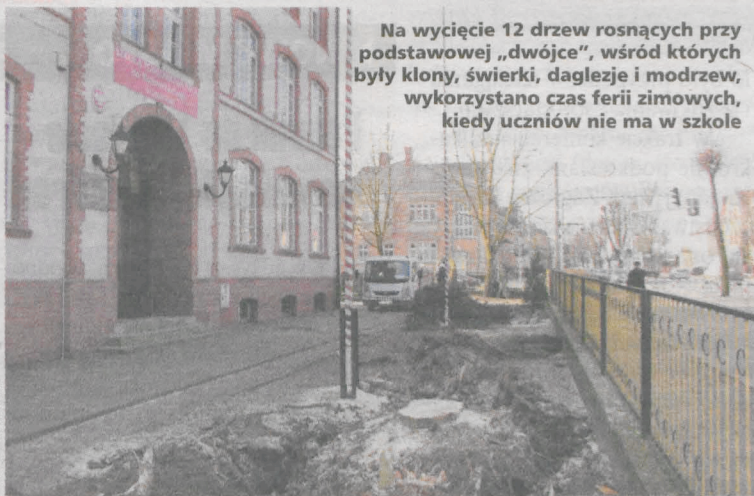
Na wycięcie 12 drzew rosnących przy podstawowej „dwójce”, wśród których były klony, świerki, daglezie i modrzew, wykorzystano czas ferii zimowych, kiedy uczniów nie ma w szkole