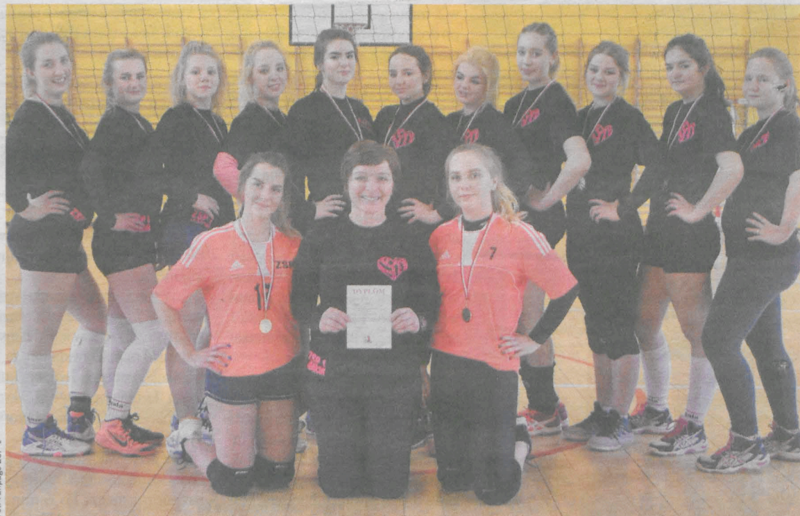
Siatkarki z ZSP 1 w Jarocinie zostały mistrzyniami powiatu i powalczą o zwycięstwo w rejonie