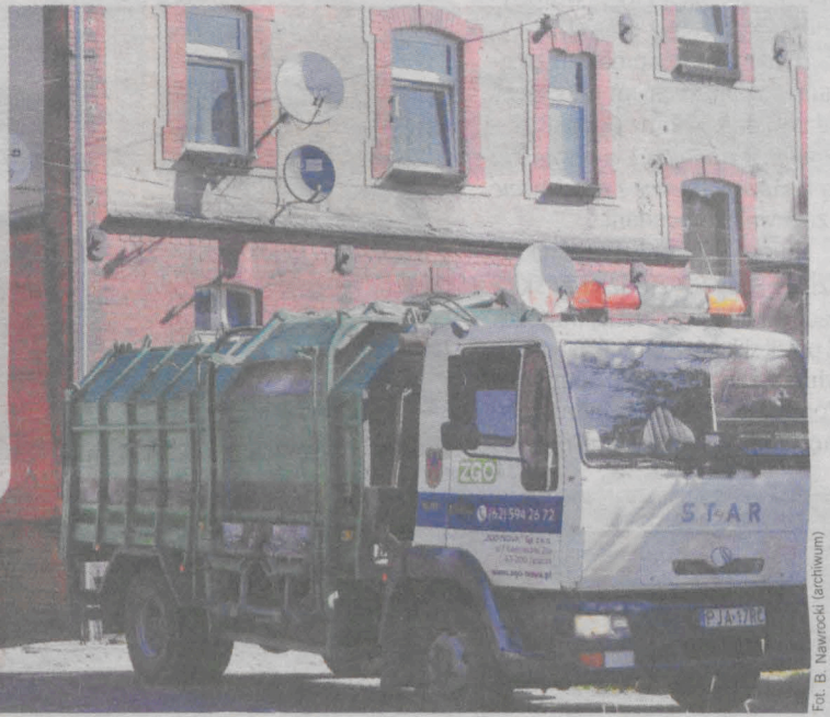
Odpady z terenu gminy Jarocin - w tym również popiół - odbiera ZGO Nova

Etykiety z napisem „popiół” można bezpłatnie odbierać w dwóch miejscach: w siedzibie spółki ZGO Nova (Witaszyczki, stara siedziba ZGO) oraz w punkcie obsługi klienta w Jarocińskim Funduszu Poręczyń Kredytowych (ul. Kościuszki 15b, z tyłu dawnego domu partii)