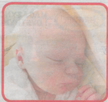
LUIZA GROCH Z BACHORZEWA ur. 2 czerwca o godz. 12.20 waga 2.900 g, wzrost 52 cm

Lonia to maleńka, urocza i bardzo grzeczna suczka. Nie niszczy w domu, zachowuje czystość, akceptuje psy i koty. Nie jest szczekliwa, uwielbia spacerować, nawet te długie. Spuszczona ze smyczy nie oddala się, reaguje na wołanie. Grzecznie jeździ w samochodzie, jest troszkę nieśmiała w stosunku do obcych. Przez liczne zwyrodnienia w stawach biodrowych, kolanowych oraz kręgosłupie musi zażywać suplementy wspomagające stawy oraz bacznie pilnować wagi. Lonia waży w tym momencie 4,8 kg i taka waga powinna się utrzymać, by nie obciążać stawów. Została wysterylizowana, zaszczepiona i odrobaczona. Szukamy dla niej domu, chętnie z innym przyjaznym czworonogiem. Lonia przebywa w domu tymczasowym w Jarocinie. Kontakt w sprawie adopcji: tel. 661-100-252.