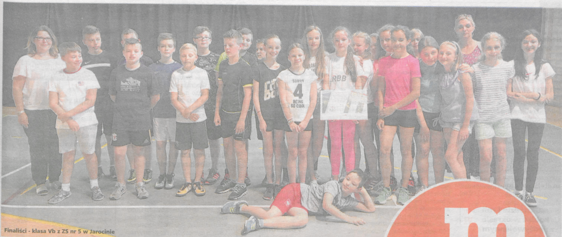
Finaliści - klasa Vb z ZS nr 5 w Jarocinie