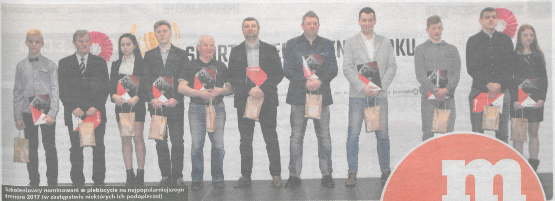
Szkoleniowcy nominowani w plebiscycie na najpopularniejszego trenera 2017 (w zastępstwie niektórych ich podopieczni)