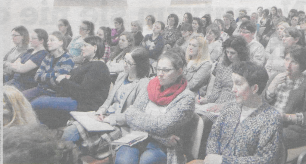
Wiele ważnych rad dotyczących pracy z dzieckiem, u którego stwierdzono mutyzm wybiórczy, przekazanych zostało podczas szkoleniowego spotkania zorganizowanego przez jarocińską poradnię psychologiczno-pedagogiczną

Jeden z głównych mitów na temat mutyzmu: - mutyzm to poważna nieśmiałość. Większość dzieci z tego wyrośnie.