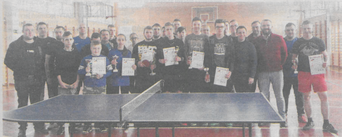
Wspólne zdjęcie uczestników i organizatorów turnieju