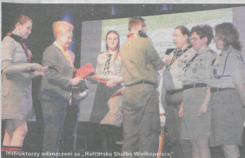
Instruktorzy odznaczeni za „Harcerską Służbę Wielkopolsce”