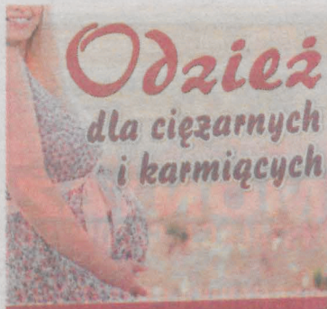
„Matylda” Jarocin, ul. Św. Ducha 4