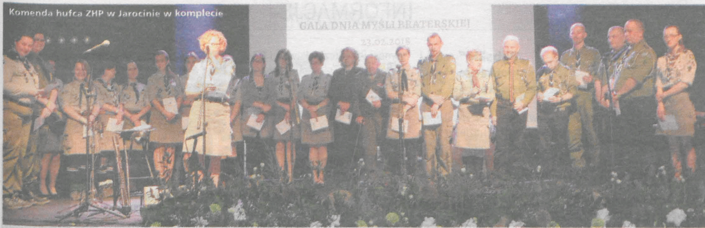
Komenda hufca ZHP w Jarocinie w komplecie