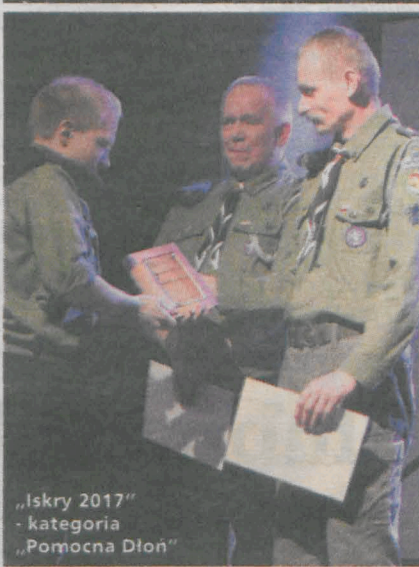
„Iskry 2017” - kategoria „Pomocna Dłoń”