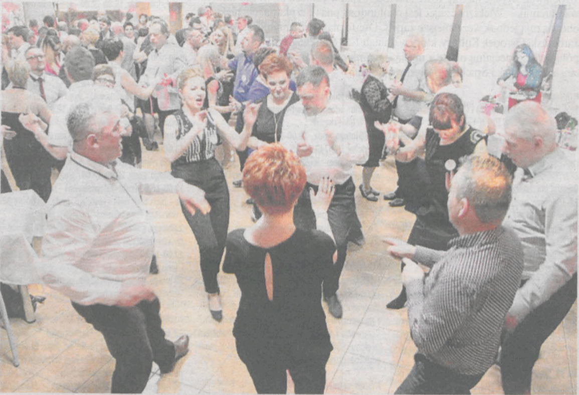
Biesiadnicy bawili się do białego rana