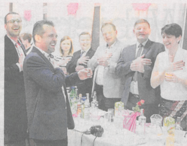
Goście składający przysięgę, że będą się dobrze bawić