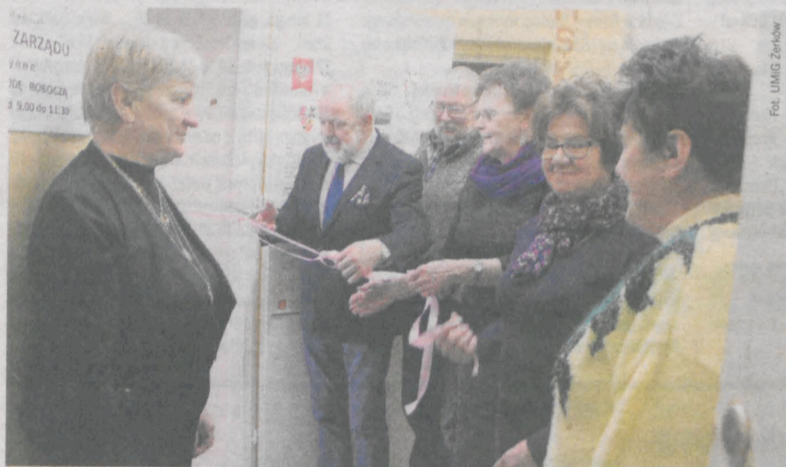
Fot. UMIG Żerków