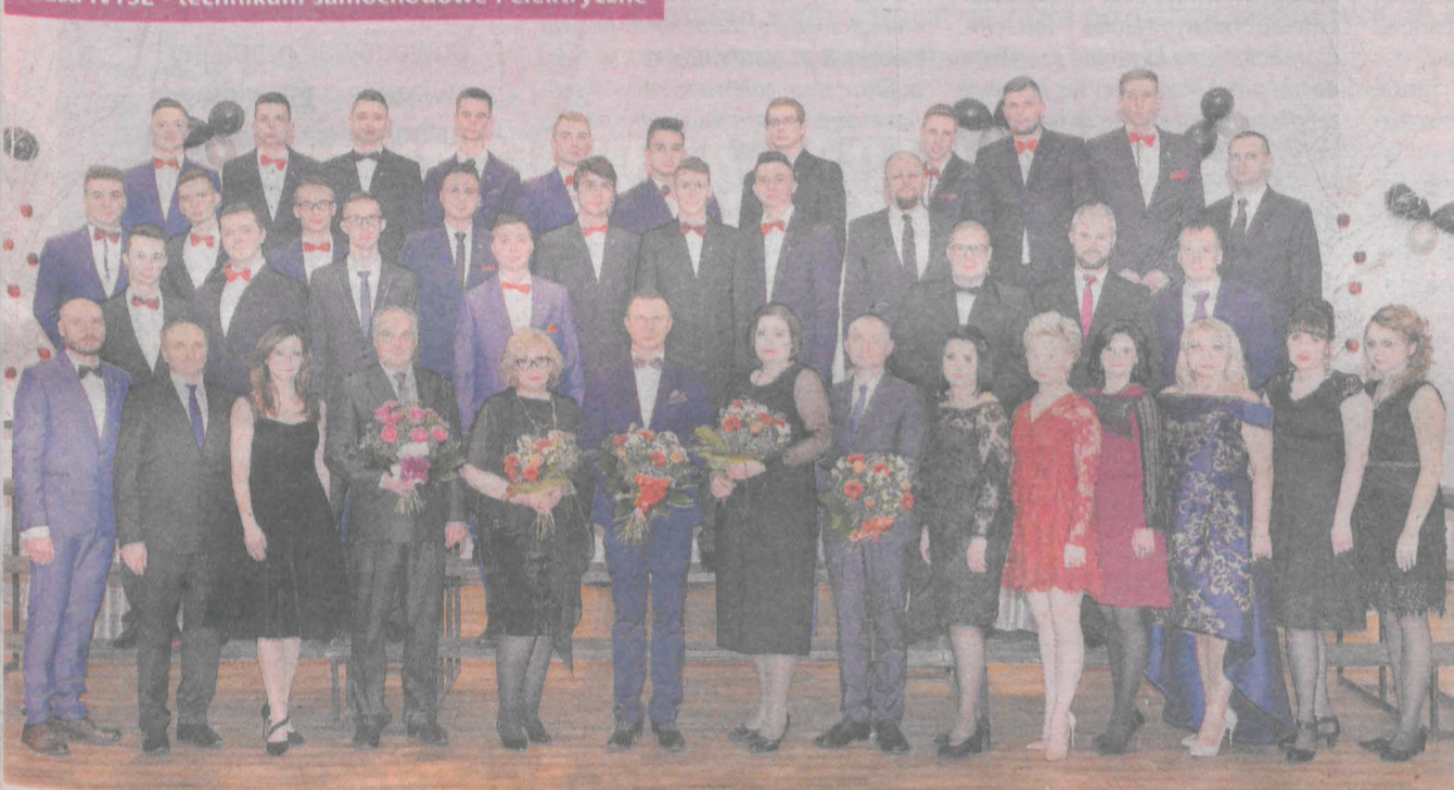
Zdjęcia klasowe maturzystów z Zespołu Szkół Ponadgimnazjalnych nr 1 w Jarocinie