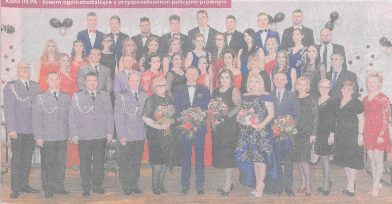
Zdjęcia klasowe maturzystów z Zespołu Szkół Ponadgimnazjalnych nr 2 im. Eugeniusza Kwiatkowskiego w Jarocinie