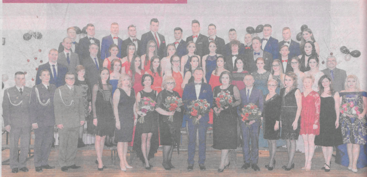
Klasa III LW - liceum ogólnokształcące z przysposobieniem wojskowym