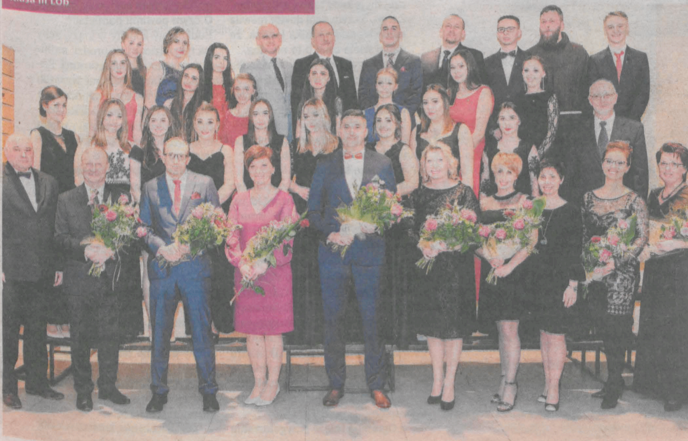
Klasa III LOb