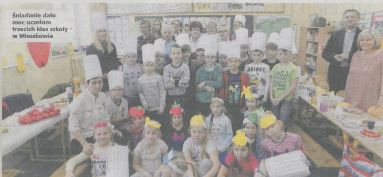
Śniadanie dało moc uczniom trzecich klas szkoły w Mieszkowie