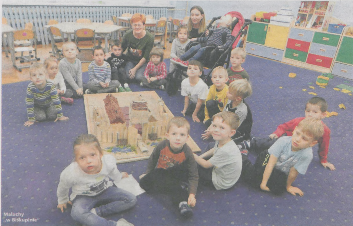
Maluchy „w Biskupinie”

Przedшкоlaki z jarocińskiego „Marcinka” poznają historię swojego miasta i regionu.