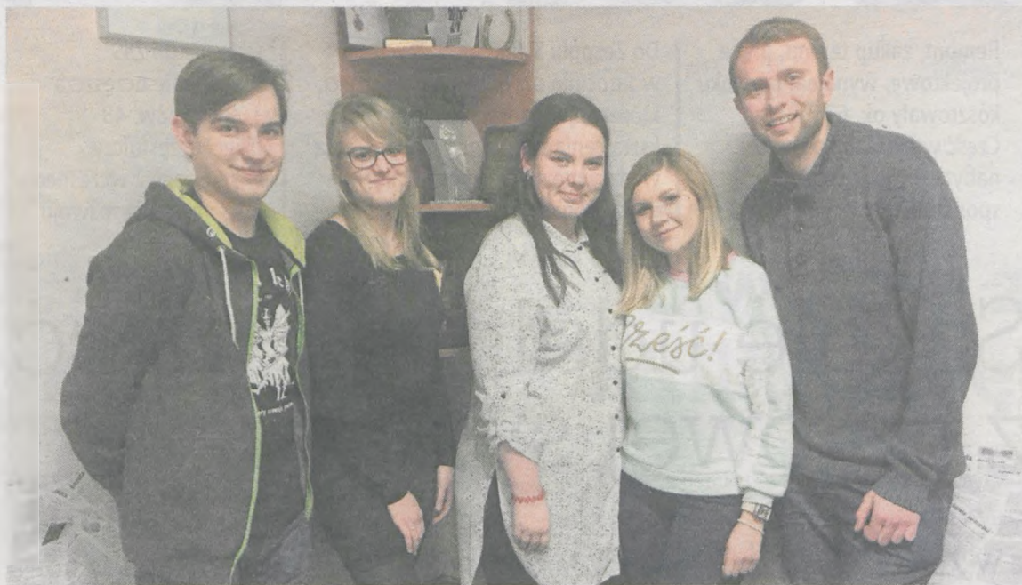
Przedstawiciele wolontariuszy Szlachetnej Paczki podczas spotkania w redakcji „Gazety Jarocińskiej”

Środki czystości, zimowa kurtka, para nowych spodni, buty, pralka czy łóżko do rehabilitacji... - to tylko niektóre z „wielkich” marzeń wielu rodzin, dla których zakup, tych kilku najpotrzebniejszych rzeczy stanowi nie lada wyzwanie. Wolontariusze Szlachetnej Paczki docierają do wielu domów, gdzie wraz z prezentami zostawiają również odrobinę nadziei na lepsze jutro.