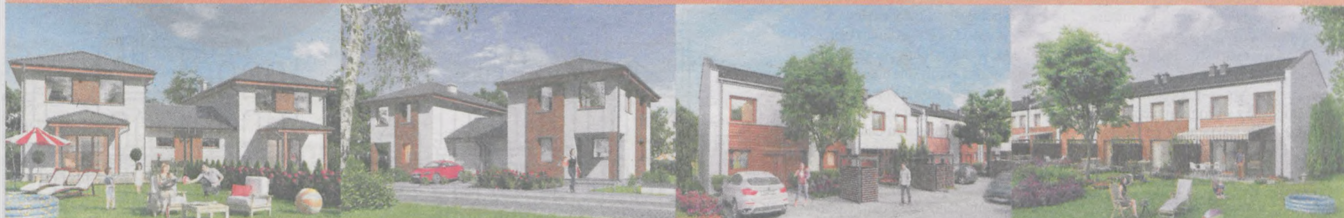
Poznań / ul. Glebowa / Os. Kameralne Poznań / ul. Gospodarska / Os. Kameralne II Skórzewo / Os. Przyjazne (etap 1W)