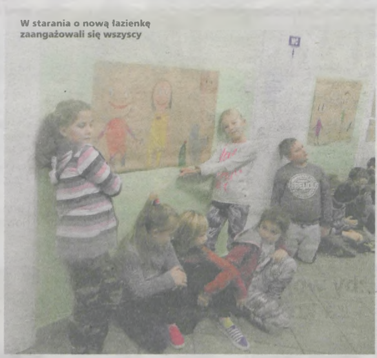
W starania o nową łazienkę zaangażowali się wszyscy

mym zwiększenie bezpieczeństwa i dbałość o zdrowie najmłodszych. Organizatorzy fundują zwycięskim szkołom generalny remont szkolnej łazienki, a wyróżnionym placówkom roczny zapas produktów do czyszczenia toalet. Jednak program to nie tylko nagrody, ale przede wszystkim edukacja. W oparciu o gotowe scenariusze nauczyciele z Mieszkowa przeprowadzili cykl lekcji uczących higieny. Szkoła zorganizowała też event propagujący ideę Światowego Dnia Toalet, który przypada 19 listopada.