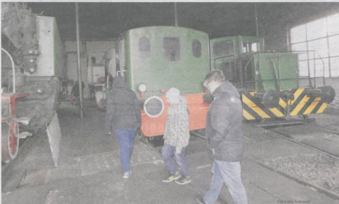
Mimo listopadowej aury jarociniacy chętnie korzystali z zaproszenia na Dzień Kolejarza zorganizowanego przez Muzeum Parowozownia w Jarocinie. Wielu z sentymentem wspominało czasy, gdy pociągi były popularnym środkiem transportu

wania zabytków zmienia się bardzo powoli, tak samo jak renowacja naszych eksponatów. Po ostatnich wichurach i ulewach zaczął nam przeciekać dach. Woda zaczyna spływać po eksponatach. Przez dwa dni chodziliśmy po dachach